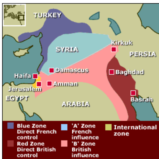
Příloha 1. Sykes-Picotova dohoda. 125