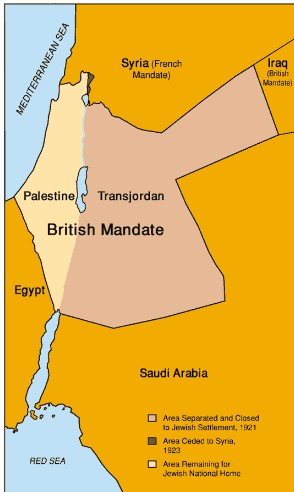
Great Britain's Division of the Mandated Area, 1921-1923