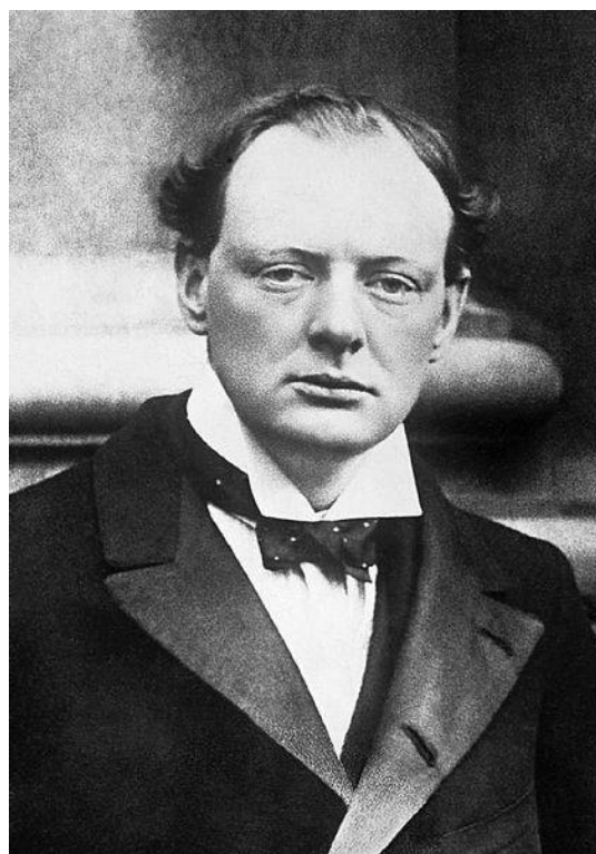
Příloha č. 3: Winston Churchill v roce 1915.