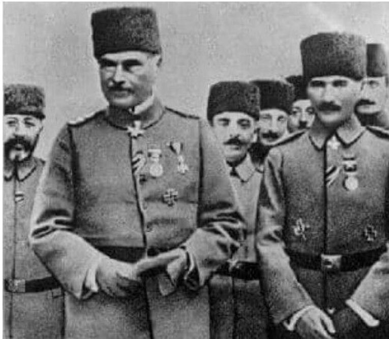
Příloha č. 4: Zleva Liman von Sanders a zprava Mustafa Kemal Atatürk.