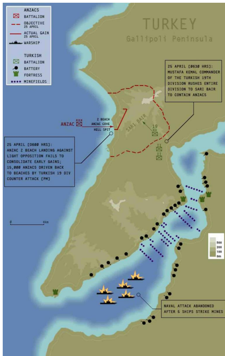
Příloha č. 1: Mapa ukazující poloostrov Gallipoli, válečné lodě, pozice turecké dělostřelby, pevnosti a miny, dále i pozice jednotky ANZAC dne 25. dubna 1915.