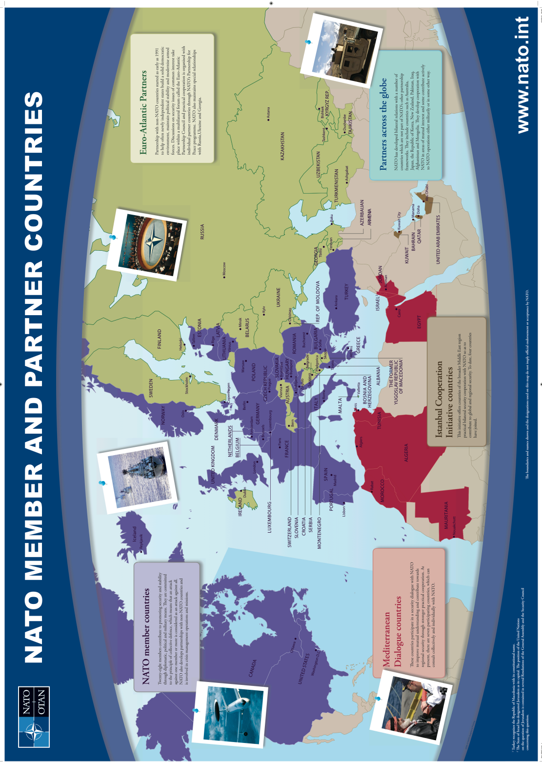
Zdroj: NATO. NATO Member and Partner Countries (http://www.nato.int/cps/en/natolive/topics_81136.htm, 31. 3. 2012).