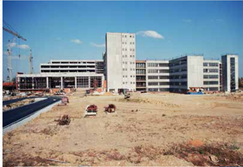
Stavba budovy strojní fakulty.

vypracován investiční záměr na výstavbu nového areálu VŠSE na Borských polích