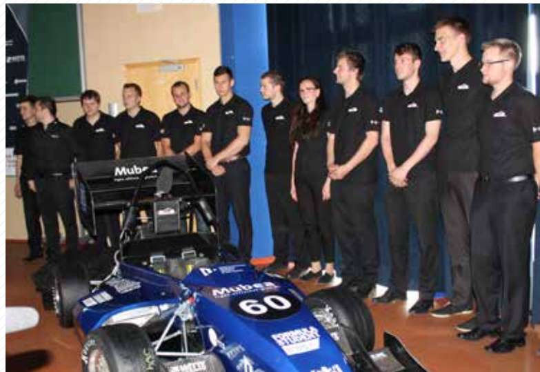
Studentská formule je příkladem mezifakultní spolupráce studentů z pěti fakult.