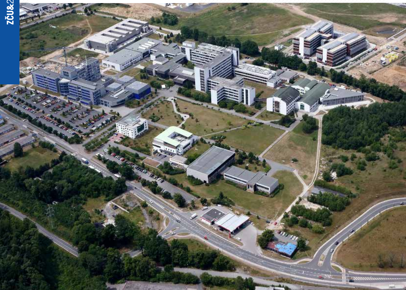
Pohled na univerzitní kampus z roku 2014.