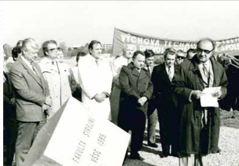
Poklepání základního kamene v roce 1985 – zahájení výstavby nejen strojí fakulty, ale i celého univerzitního kampusu.

Po svém vzniku působila univerzita na řadě míst po celé Plzni. Fakulty sídlily a vyučovaly v mnoha pronajatých i vlastních prostorách a roztržitost výuky byla vnímána jako jednoznačná překážka. Z tohoto důvodu vznikl záměr koncentrovat výuku do právě vznikajícího areálu na Borských polích. Zelený trojúhelník, jak se místo pro univerzitu začalo nazývat, se měl proměnit v univerzitní městečko se všemi fakultami, sídlem rektorátu, univerzitní knihovnou, menzou a další infrastrukturou. Z velké části se tento záměr naplnil. Borská pole se od položení základního kamene v roce 1985 proměnila v univerzitní kampus, kde sídlí pět fakult, tři výzkumná centra, rektorát, menza a univerzitní knihovna. Na atraktivitě celého univerzitního městečka by měla určitě přidat tramvajová linka, jejíž prodloužení z konečné na Borech se plánuje.