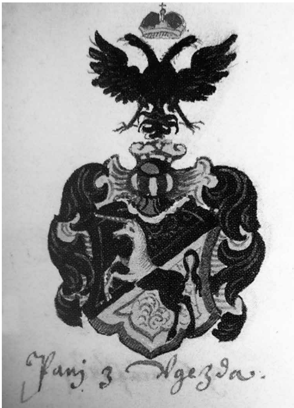
Erb pánů z Újezda