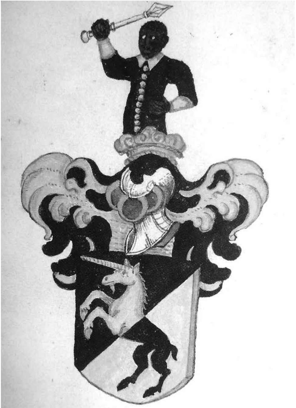
Rytířský erb Jeníšků z Újezda