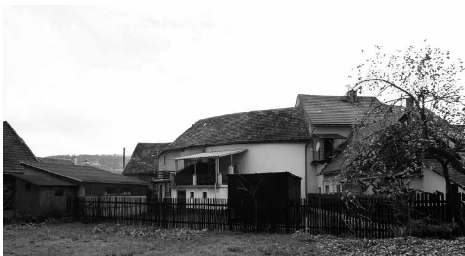
Dnes stojící domy na místě staré svrčovecké tvrže. Stále je patrný půlkruhový půdorys původní stavby.