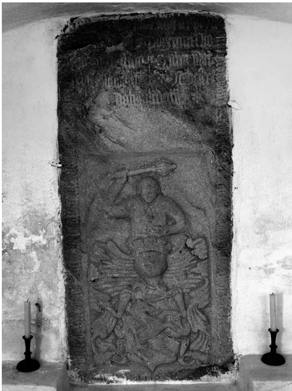
Náhrobek Buriana Jeniška z Újezda v kostele ve Štěpánovicích.