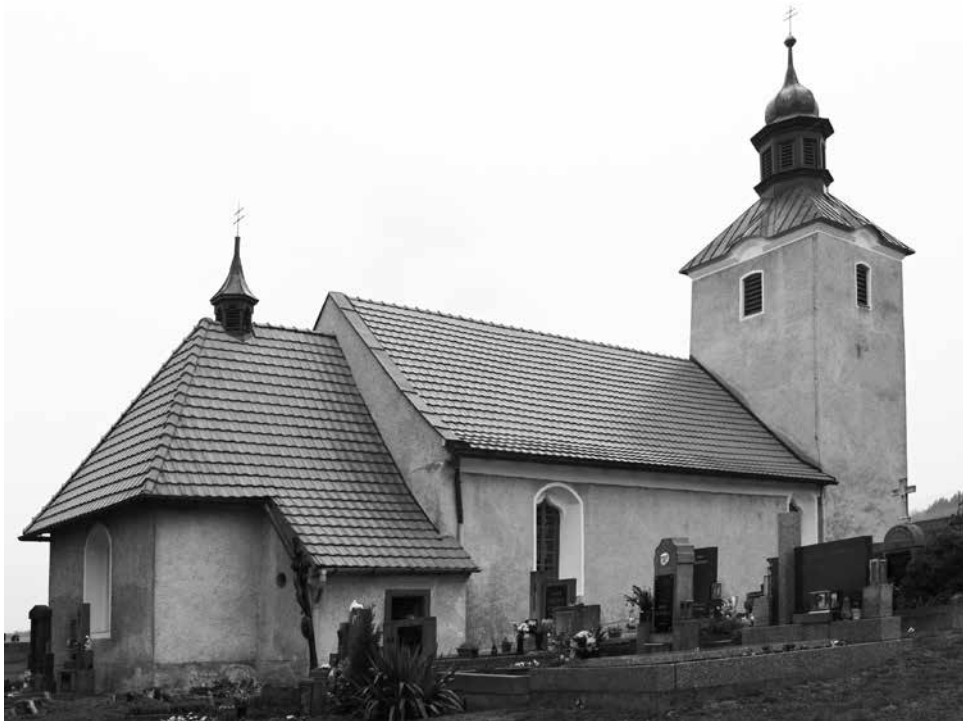
Kostel sv. Archanděla Michaela ve Štěpánovicích.