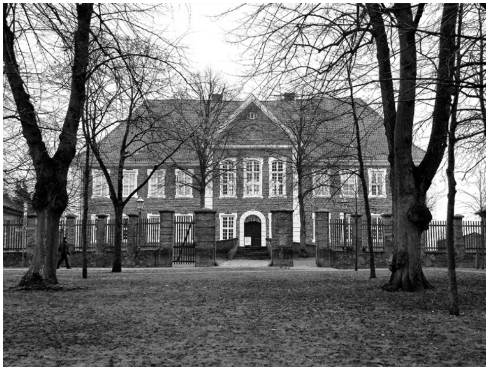
Obr. 6: Rezidence sasko-lauenburských vévodů v Ratzeburgu. Dnes Kreismuseum Herzogtum Lauenburg. Foto Michal Vokurka, 2017.