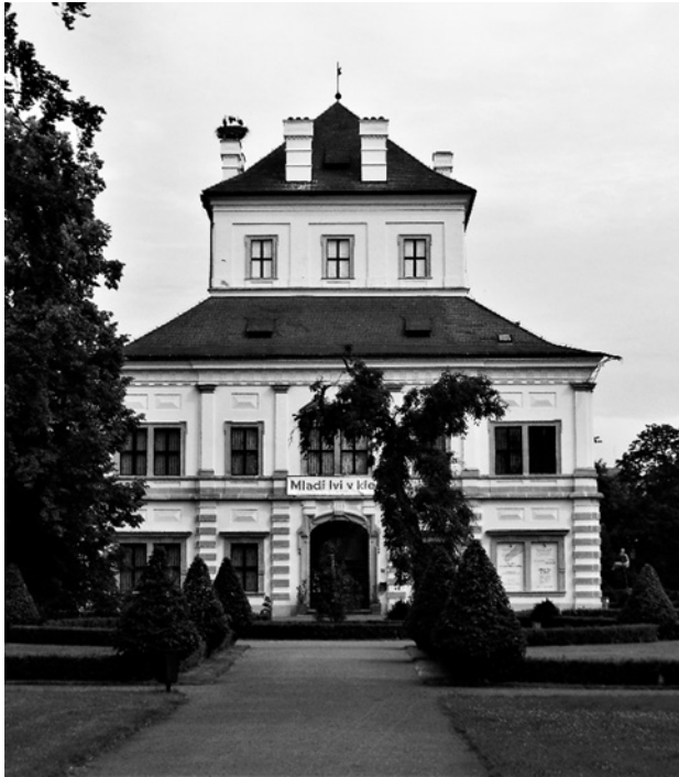
Obr. 4: Ostrovský letohrádek od Abrahama Leutnera z let 1674–1683. Foto Michal Vokurka, 2014.