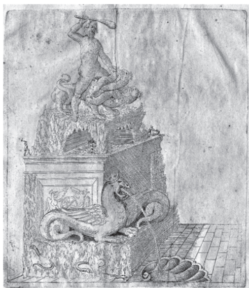
Obr. 2 a 3: Rytniny staveb, soch a fontán Zachariase Lescheho ze 40. let 17. století. Universitätsbibliothek Salzburg, G 431 I.