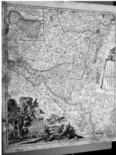
Obr. 5: Mapa vévodství Lauenburg od Johanna Homanna, Norimberk 1729. Kreisarchiv Ratzeburg, Karten & Pläne 1414.