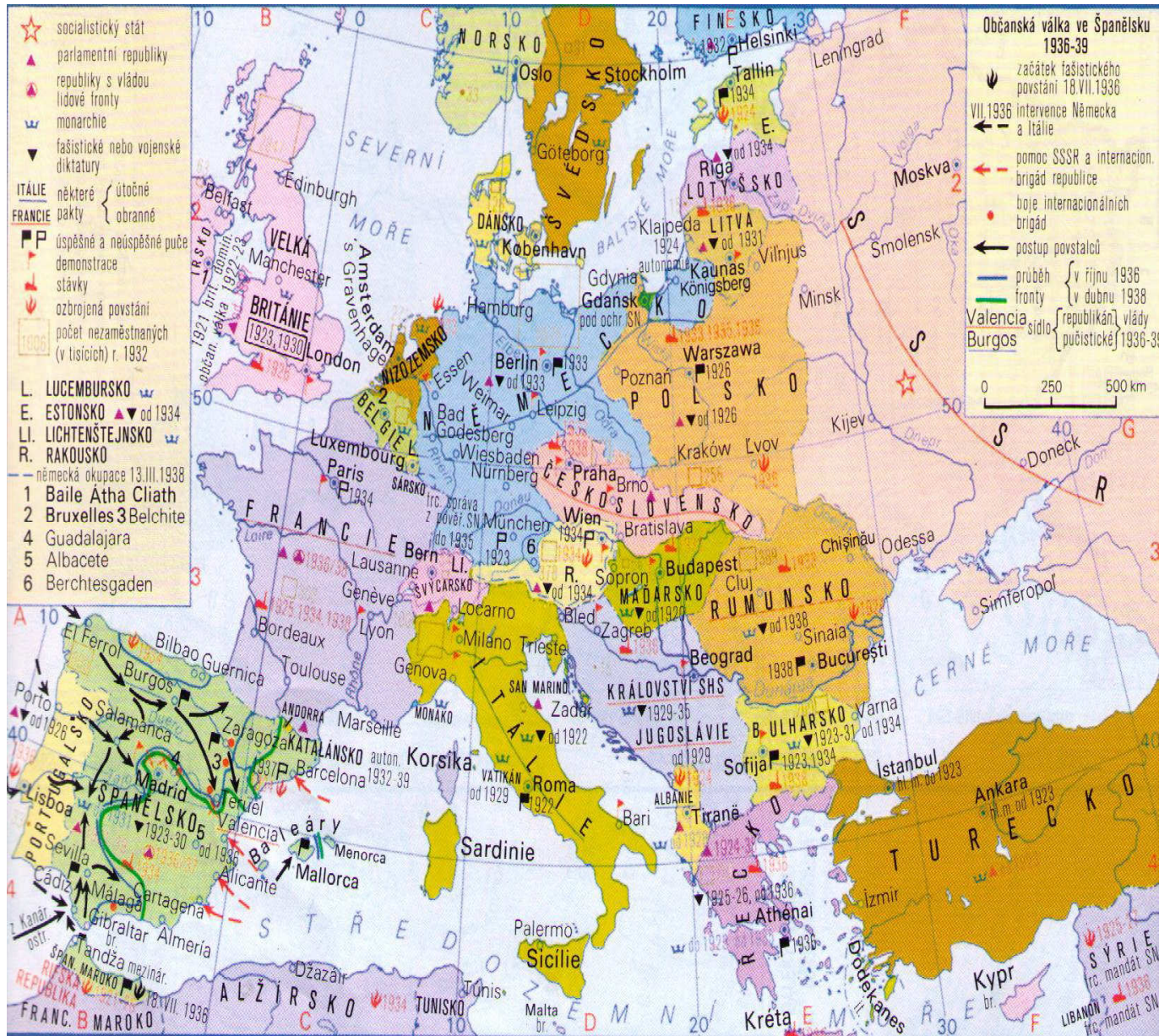
Příloha č. 2: Mapa Evropy mezi první a druhou světovou válkou