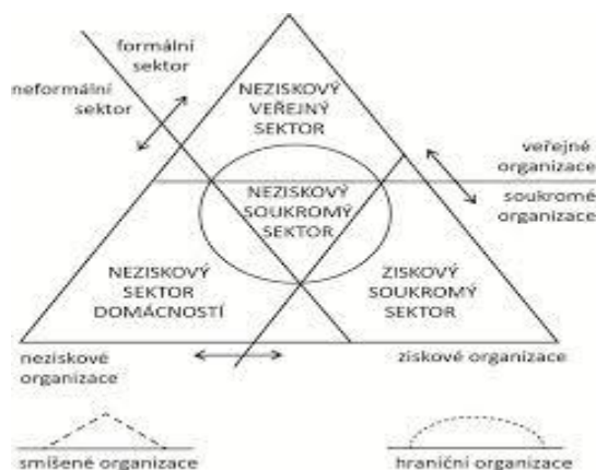
Schéma č. 1: Členění národního hospodářství podle Viktora A. Pestoffena 2

Švédský ekonom Viktor A. Pestoff použil pro znázornění rozdělení národního hospodářství plochu trojúhelníku a rozdělil hospodářství na čtyři sektory podle třech kritérií.