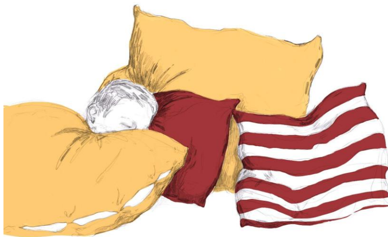
Příloha č. 6