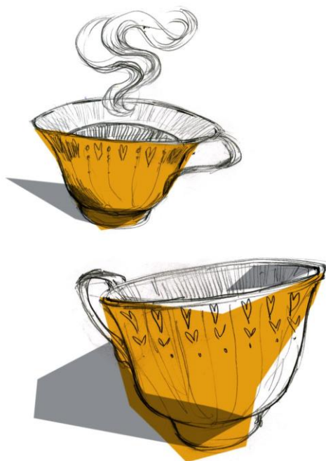
Příloha č. 3

"Z malovaných hrníčků stoupala pára a vzduch kolem voněl po černém čaji.."