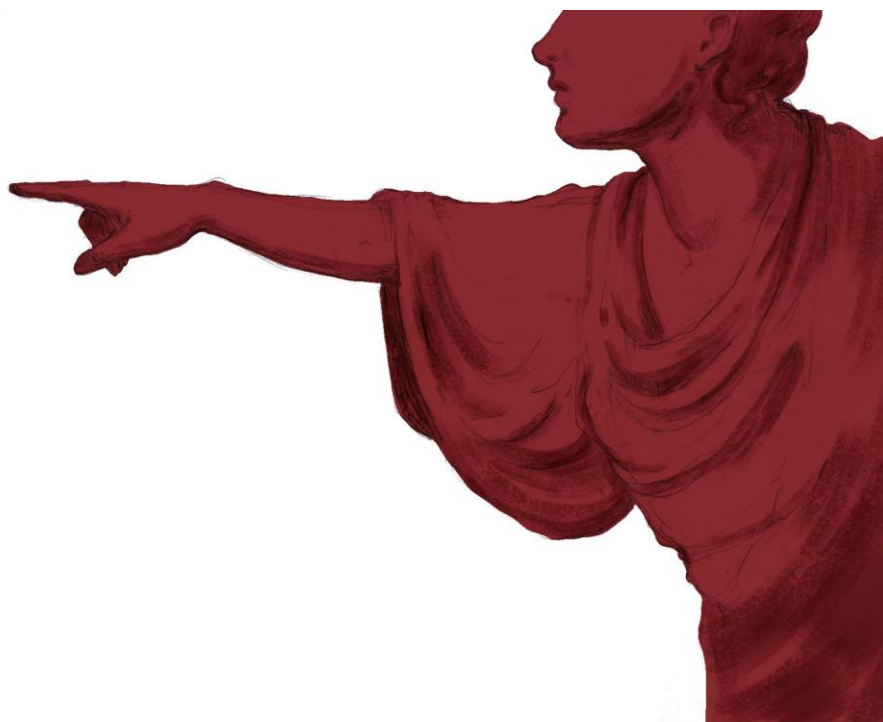
Příloha č. 5