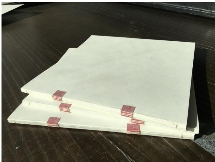
Příloha č. 7