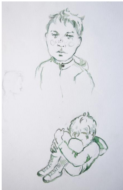
Příloha č. 1