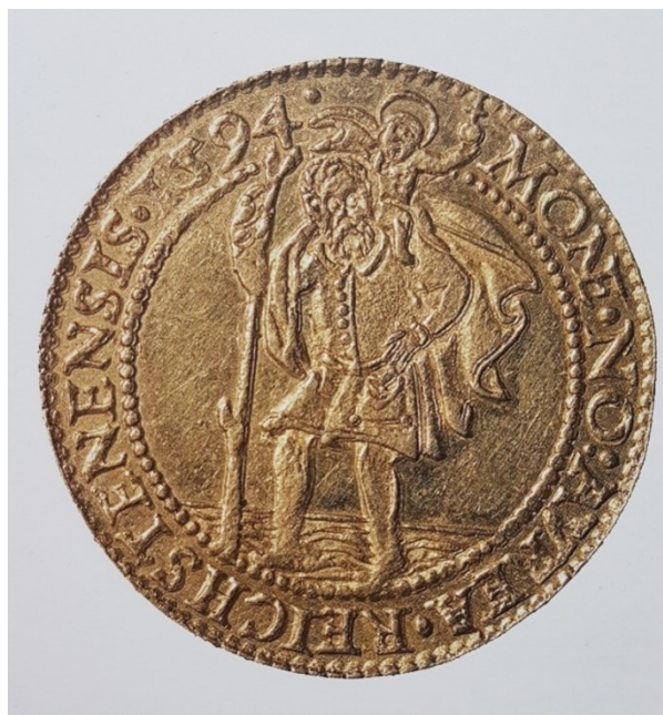
Příloha č. 23. – Dukát Petra Voka. Zdroj: BALOG, Peter a kol. Rožmberkové: rod českých velmožů a jeho cesta dějinami , České Budějovice 2011, s. 161.