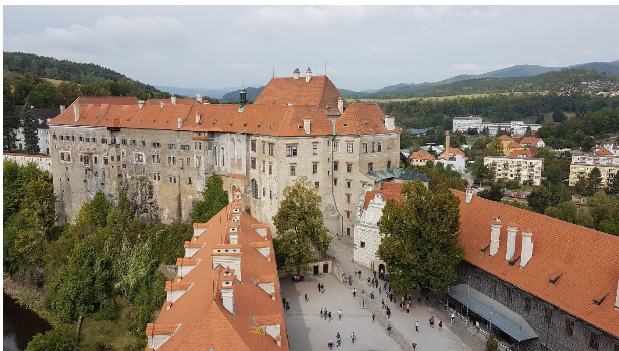
Příloha č. 5. – Hrad a zámek v Českém Krumlově.