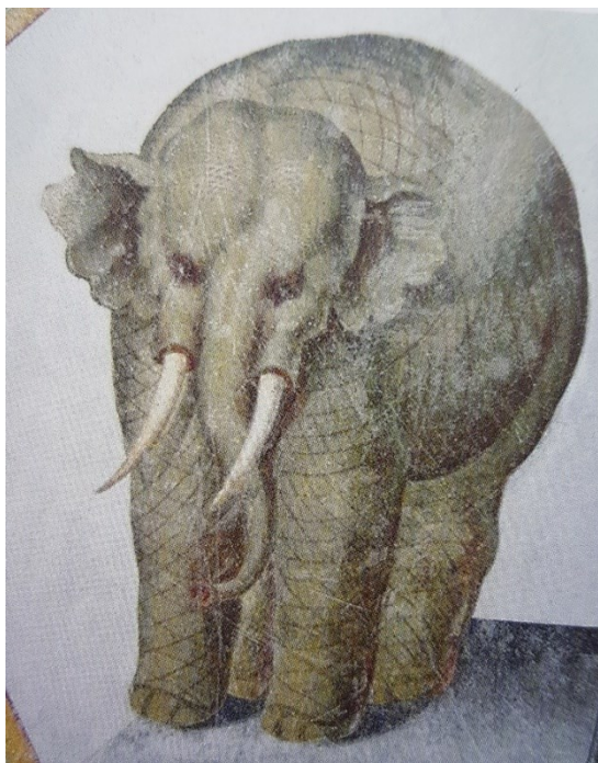
Příloha č. 10. – Malba v Dvořanské světnici, letohrádek Kratochvíle. Zdroj: BALOG, Peter a kol. Rožmberkové: rod českých velmožů a jeho cesta dějinami , České Budějovice 2011, s. 591.