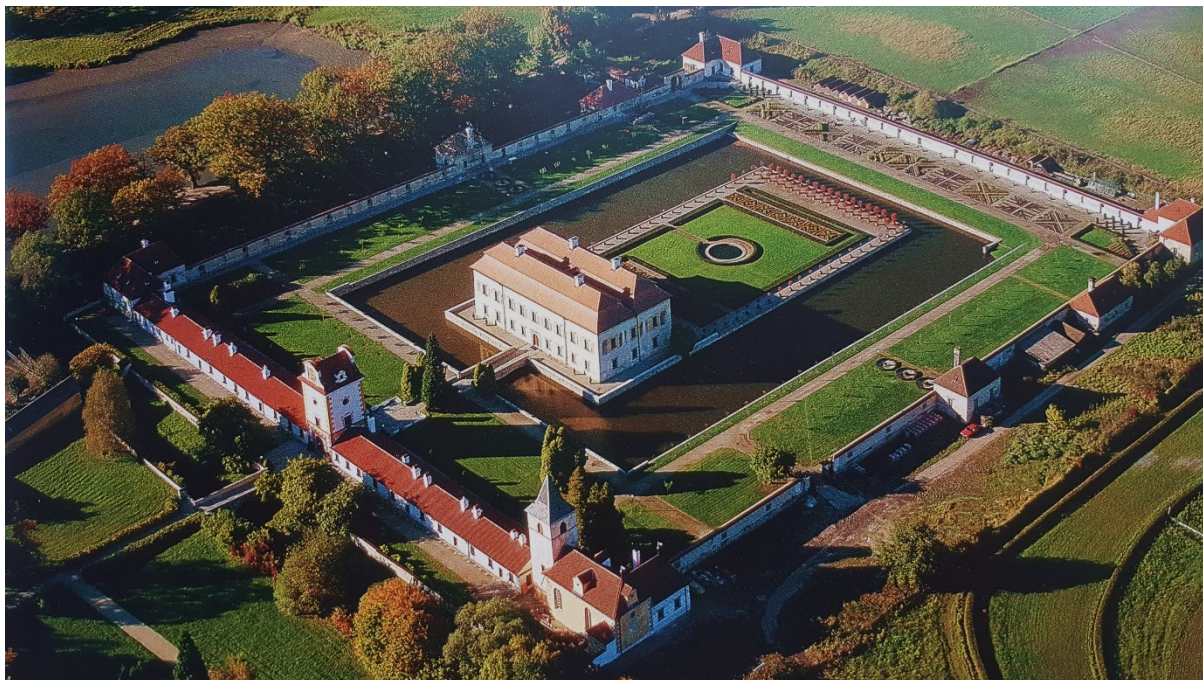
Příloha č. 11. – Letohrádek Kratochvíle. Zdroj: BALOG, Peter a kol. Rožmberkové: rod českých velmožů a jeho cesta dějinami , České Budějovice 2011, s. 339.