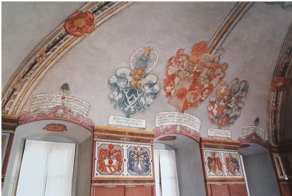
Příloha č. 15. – Erbovní výzdoba Dvořanské světnice, zámek Třeboň. Zdroj: BALOG, Peter a kol. Rožmberkové: rod českých velmožů a jeho cesta dějinami , České Budějovice 2011, s. 218.