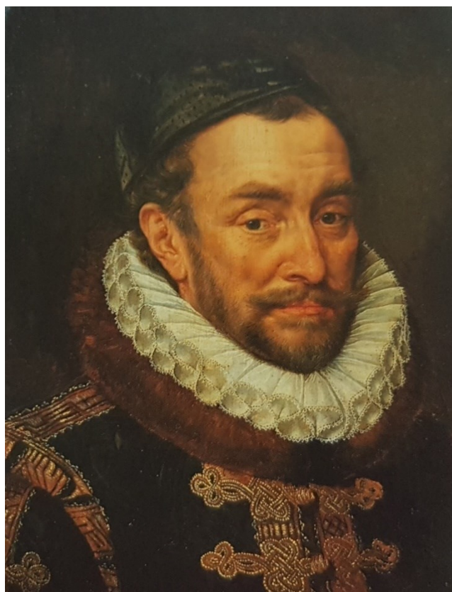
Příloha č. 4. Portrét prince Viléma Oranžského. Zdroj: BŮŽEK, Václav a kol. Světy posledních Rožmberků , Praha 2011, s. 62.