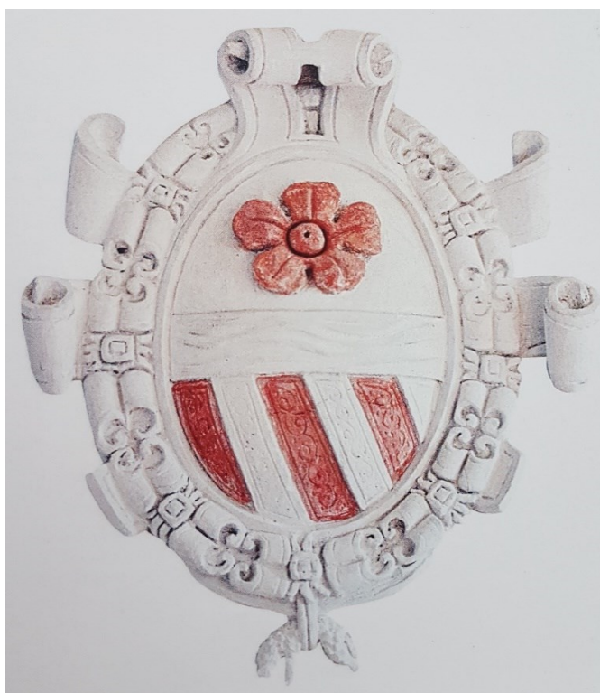
Příloha č. 9. – Rožmberský erb doplněný o znaky Orsiniů, letohrádek Kratochvíle.