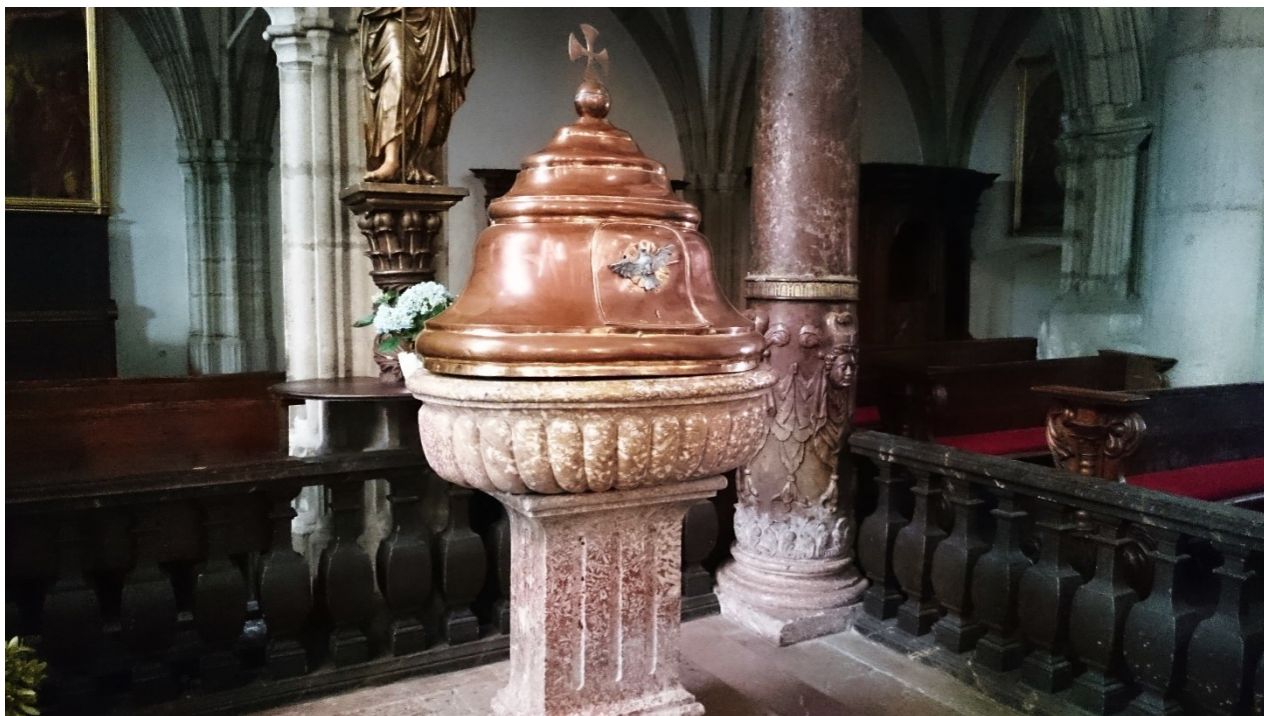
Příloha č. 26. – Pozůstatky rožmberského mauzolea v kostele svatého Víta, Český Krumlov.