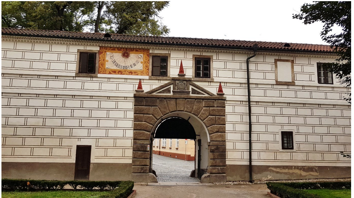
Příloha č. 14. – Vstupní brána do areálu třeboňského zámku zdobena rožmberským erbem.