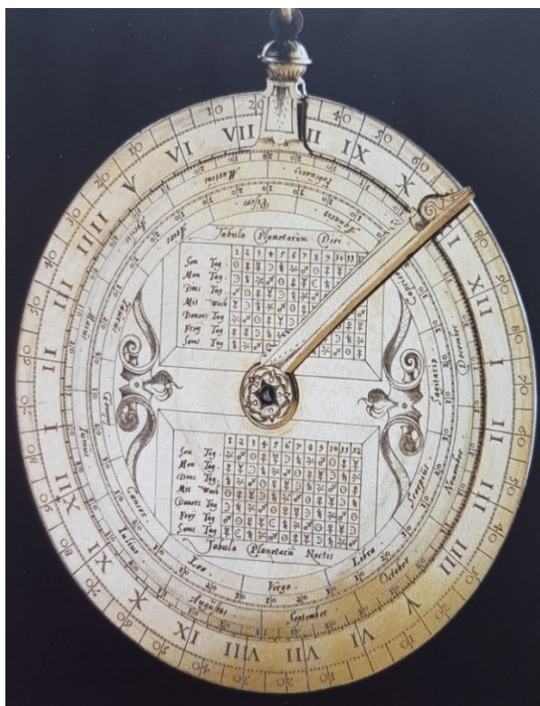
Příloha č. 22. – Sluneční hodiny, autor Erasmus Habermel.