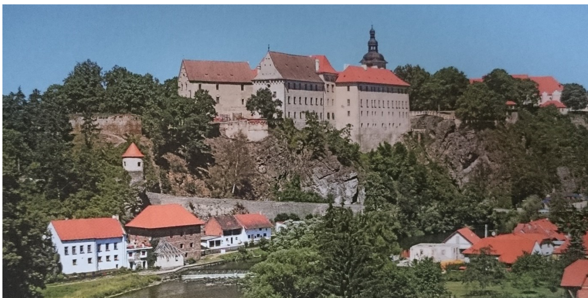
Příloha č. 12. – Zámek Bechyně.