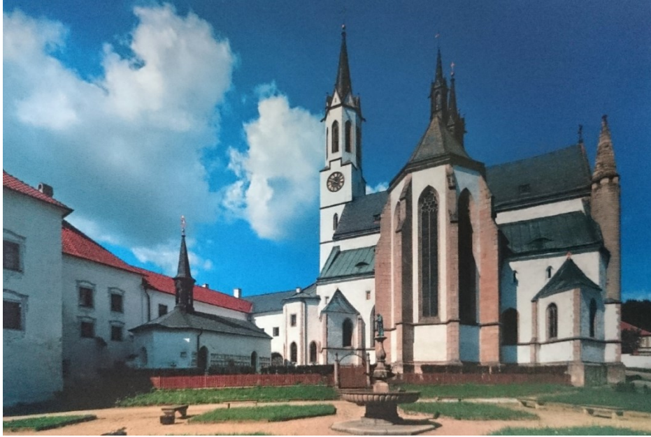
Příloha č. 18. – Klášter ve Vyšším Brodě. Zdroj: BALOG, Peter a kol. Rožmberkové: rod českých velmožů a jeho cesta dějinami , České Budějovice 2011, s. 237.