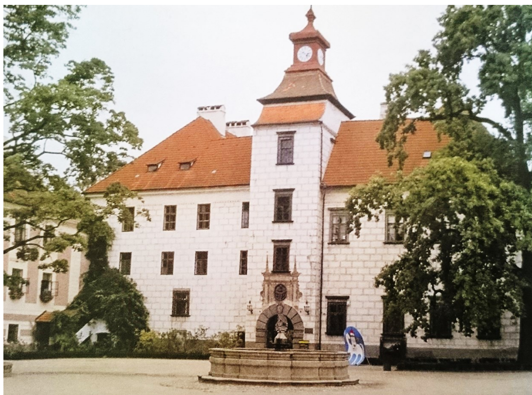
Příloha č. 13. – Zámek Třeboň. Zdroj: BŮŽEK, Václav a kol. Světy posledních Rožmberků , Praha 2011, s. 126.