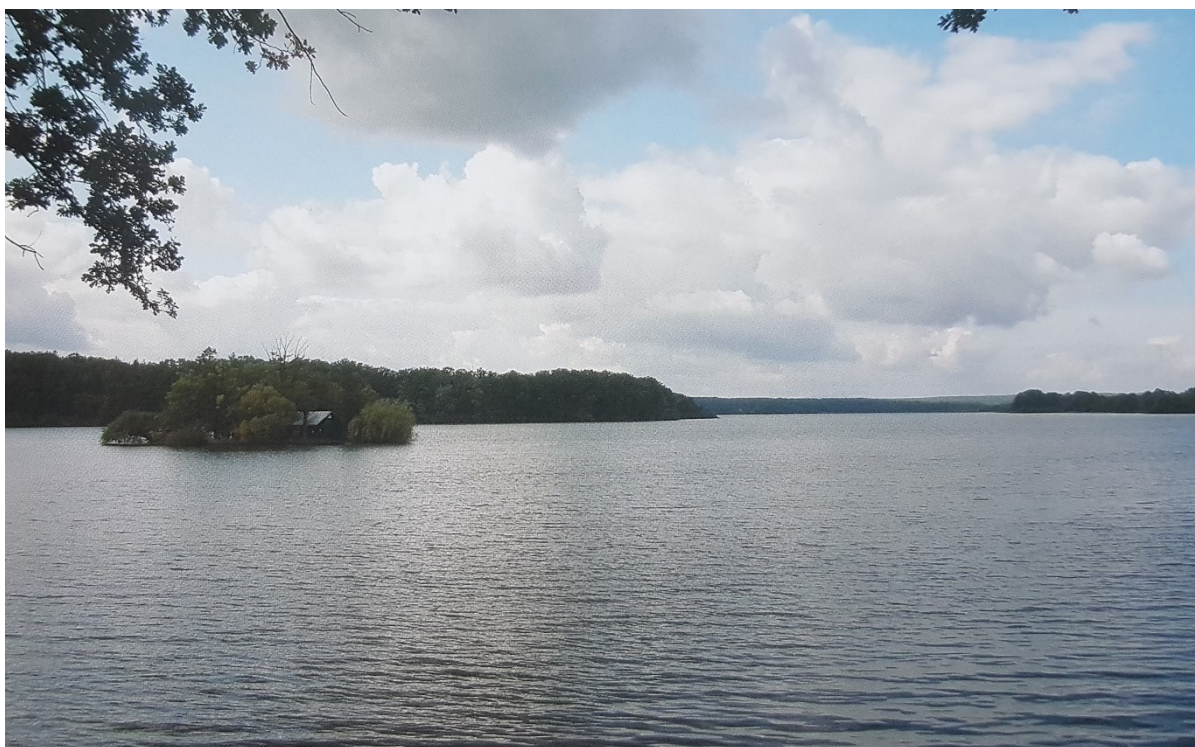
Příloha č. 16. – Rybník Svět.