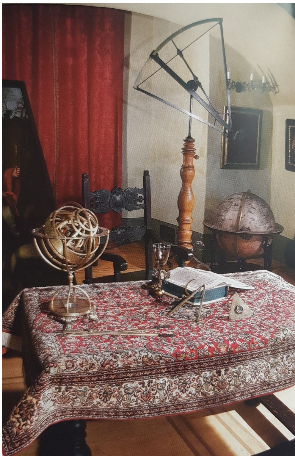
Příloha č. 21. – Kunstkomora Petra Voka na zámku v Třeboni.