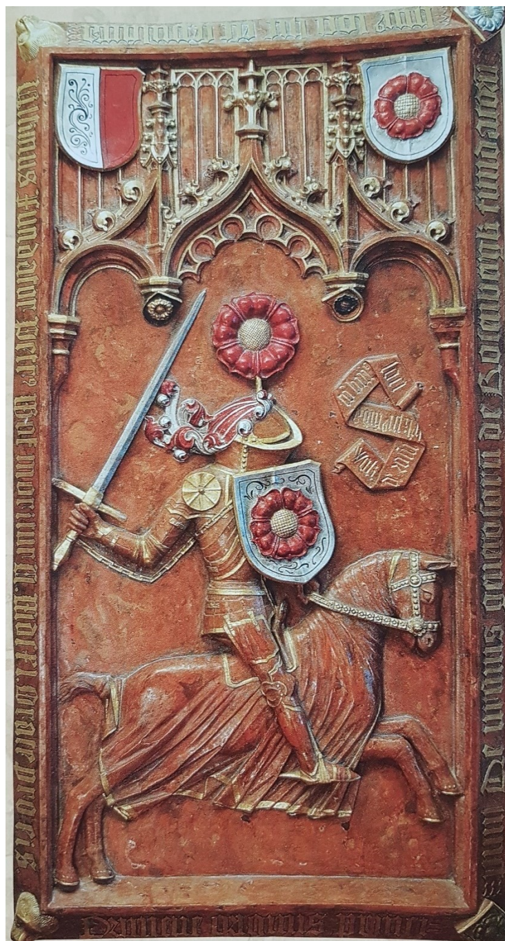
Příloha č. 25. – Rožmberský epitaf v klášteře ve Vyšším Brodě. Zdroj: BALOG, Peter a kol. Rožmberkové: rod českých velmožů a jeho cesta dějinami , České Budějovice 2011, s. 240.