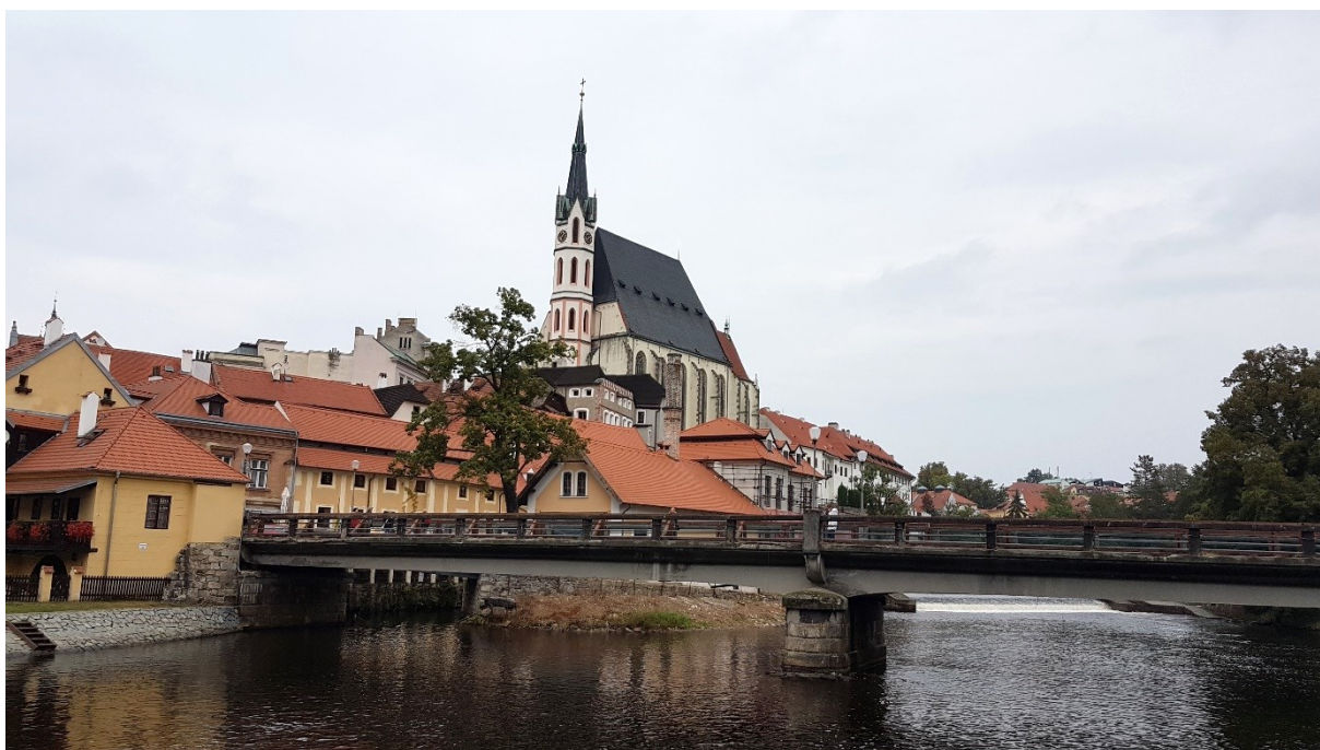
Příloha č. 17. – Kostel svatého Víta, Český Krumlov.