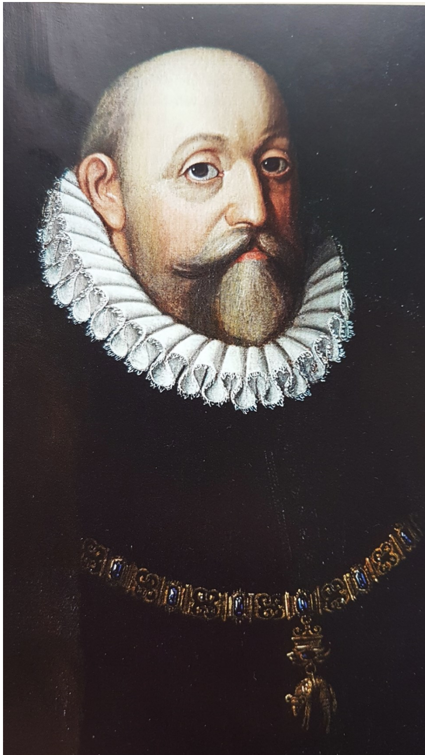
Příloha č. 1. – Portrét Viléma z Rožmberka. Zdroj: BALOG, Peter a kol. Rožmberkové: rod českých velmožů a jeho cesta dějinami , České Budějovice 2011, s. 77.