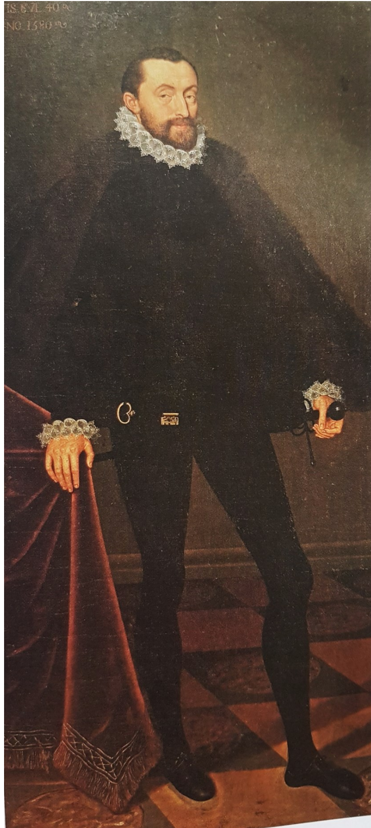
Příloha č. 2. – Portrét Petra Voka z Rožmberka.