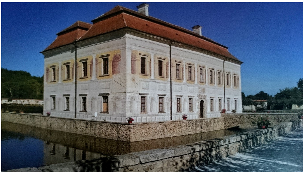
Příloha č. 8. – Letohrádek Kratochvíle. Zdroj: BŮŽEK, Václav a kol. Světy posledních Rožmberků , Praha 2011, s. 236.