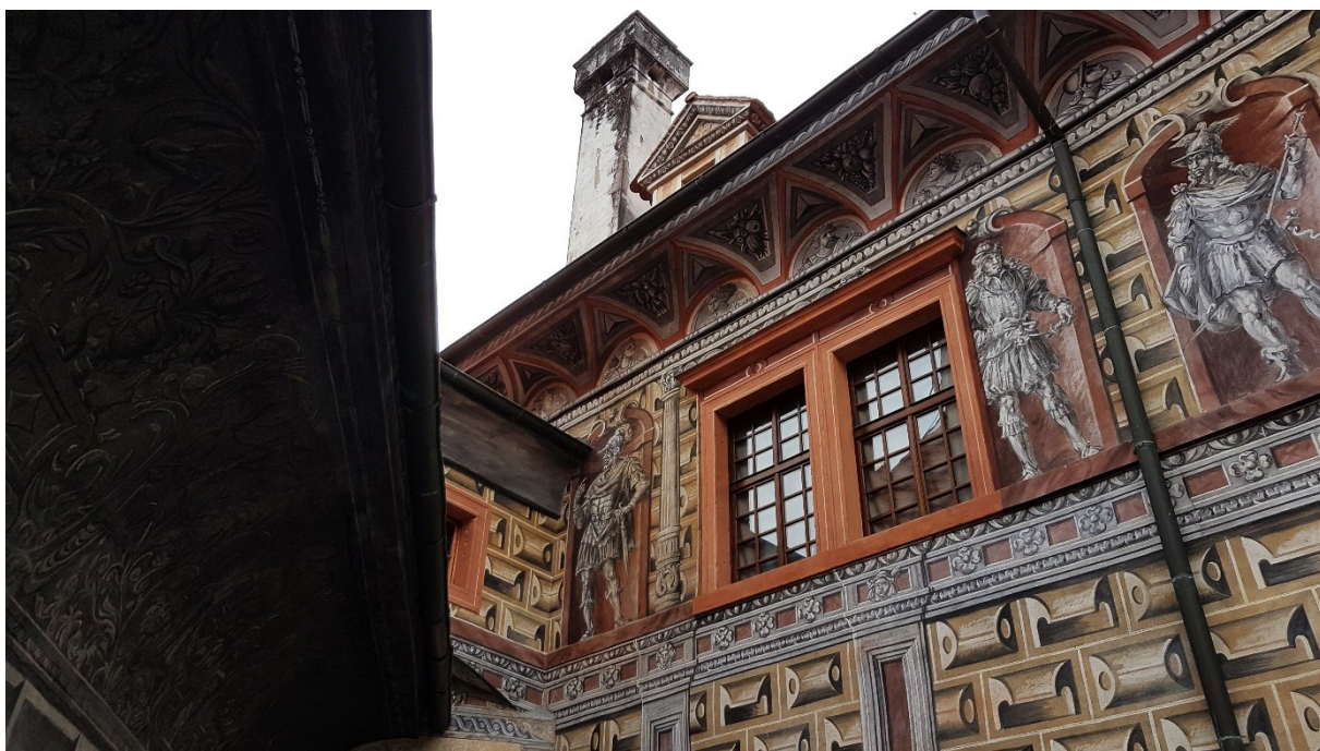
Příloha č. 6. – Výtvarné zpracování zámecké fasády, Český Krumlov.