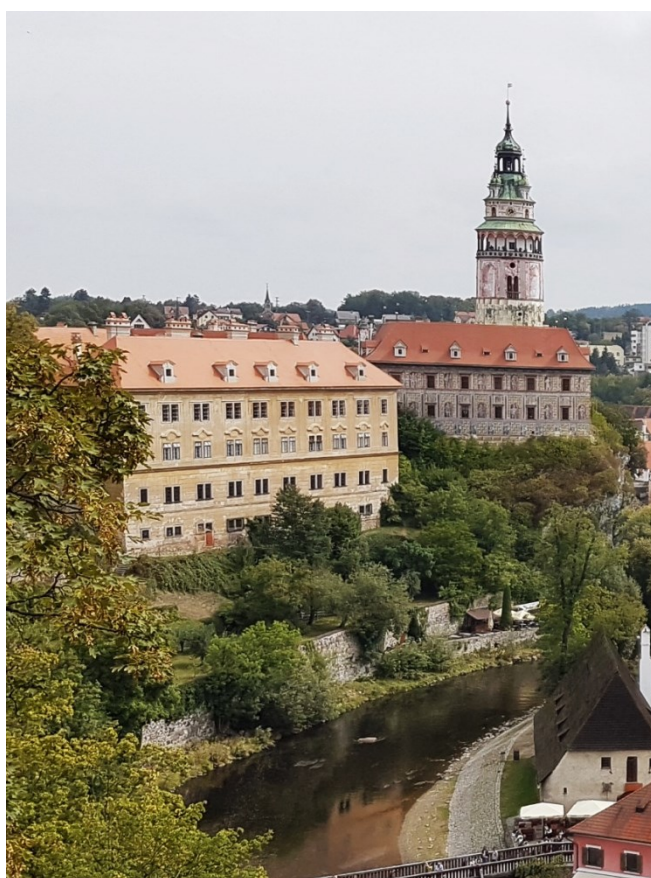
Příloha č. 7. – Zámecká věž, Český Krumlov.