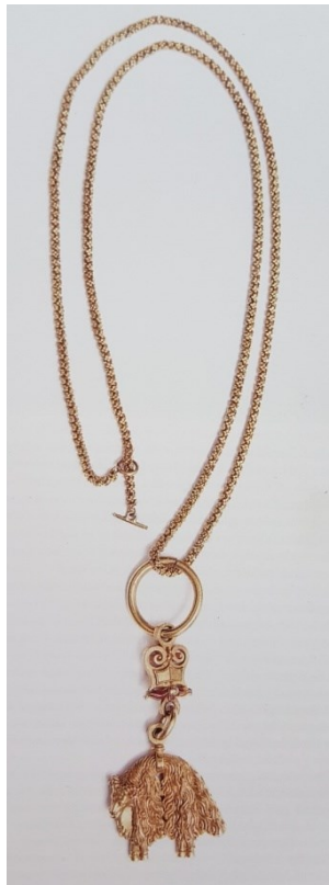
Příloha č. 19. – Řád zlatého rouna.