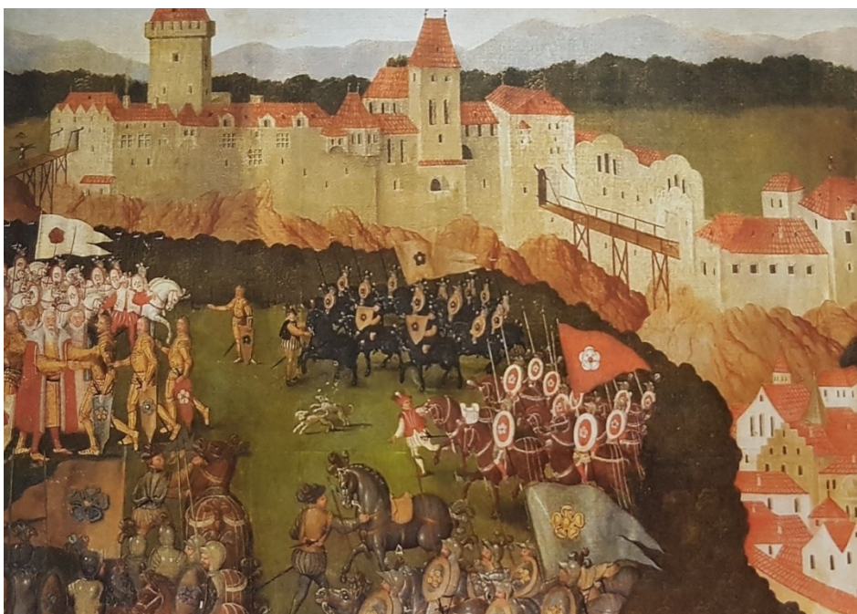
Příloha č. 3. – Obraz s námětem dělení rúží od Jana See.