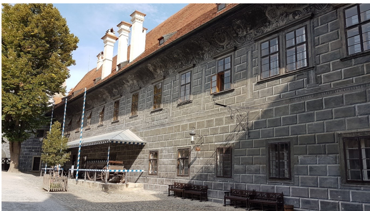
Příloha č. 5. – Nádvoří českokrumlovské rezidence.