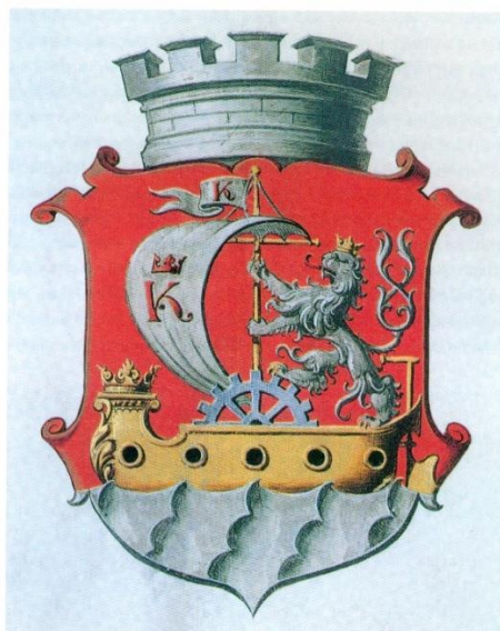
1 Znak města Karlína, schválený při povýšení Karlína na město r. 1903