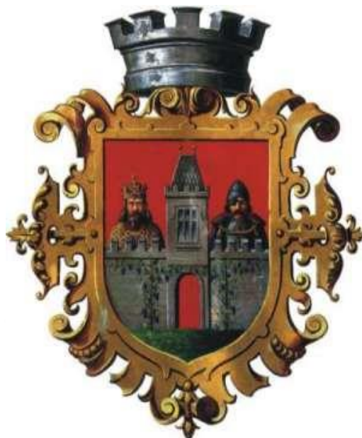
Obrázek č. 3: Znak města Žižkova 63

Do vyhlášení Protektorátu Čechy a Morava nedoznala podoba Karlína výraznějších změn, i nadále si držel svůj průmyslový ráz a byl působištěm mnoha řemeslných a živnostenských společenstev. Připojením k Velké Praze se osvěžil i společenský život, akce místních spolků různorodého zaměření byly doplněny kulturními událostmi na celopražské úrovni a pomalu se stírali dříve výrazné rozdíly. V průmyslové oblasti byla nejvýznamnější v Karlíně sídlící společnost Daňkova strojárna, která se stala roku 1927 součástí koncernu Českomoravská-Kolben-Daněk (ČKD). Urbanistický vývoj mezi světovými válkami stagnoval, poměrně výrazných změn se však dočkaly vltavské ostrovy při karlínském nábřeží.