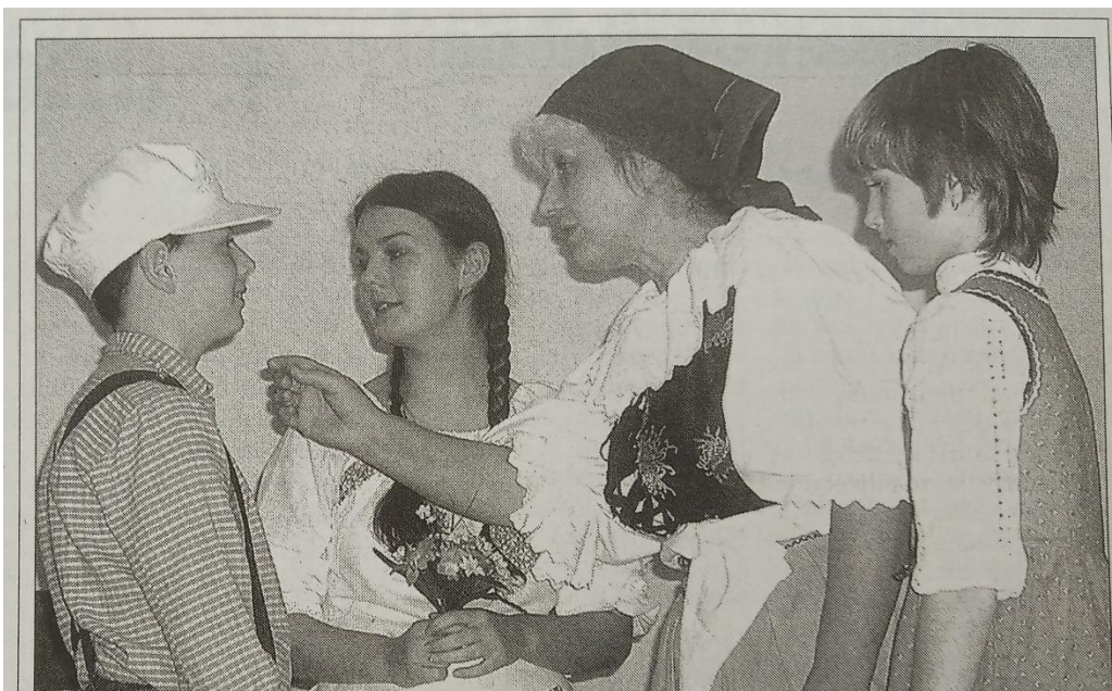
Obrázek č. 4