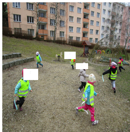
Obrázek 36 – Meluzína B