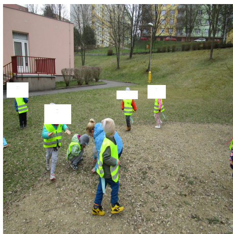
Obrázek 29 – Ocásek A

Reflexe: U dětí jsou podobné honičky, velmi oblíbené a dařila se jim i tato. Pokud kocour ulovil nějaký ocásek, myška mohla běžat dál, ale už bez ocásku.