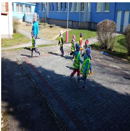
Obrázek 23 – Škatulata A

Reflexe: Děti pochopily pravidla bez problémů. Zvolila jsem variantu, kdy jsem děti rozdělila na dvě skupiny, které se vždy měnily. Děti s mou pomocí zvládly i složitější modifikaci hry.