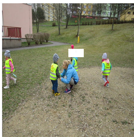
Obrázek 30 – Ocásek B