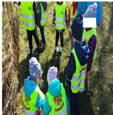
Obrázek 18 – Květiny B