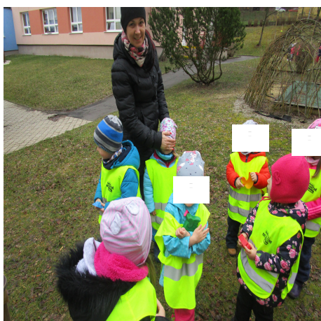
Obrázek 25 – Ano, ne A

Reflexe: Tato hra byla pro děti poněkud těžší, už jsem ji s dětmi zkoušela ve třídě, a poté jsem ze zkušenosti volila slova ano, ne, která jsou pro děti snadněji pochopitelná. Děti ukryté předměty našly. Byly to bábovičky na písek, s kterými následovala hra s korálky. Každý měl odlišnou bábovičku.