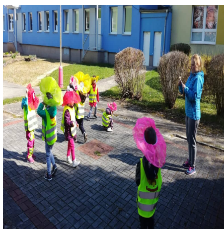
Obrázek 16 – Víly B