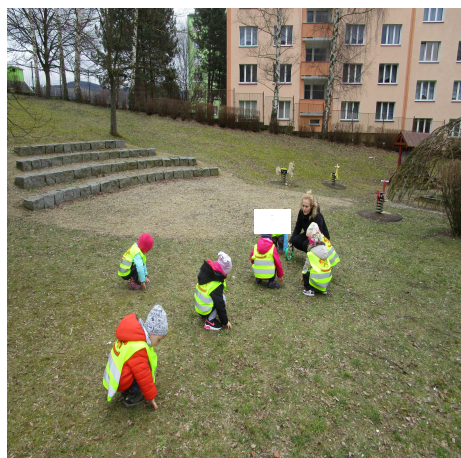
Obrázek 7 – Sochy A

Reflexe: Děti hru bez problémů zvládly. Pochopily pravidla a snažily se napodobit zvíře. Ze začátku jsem nechala spíše na dětech, jak mi zvíře předvedly, a rozvíjela jsem tak jejich vlastní fantazii.