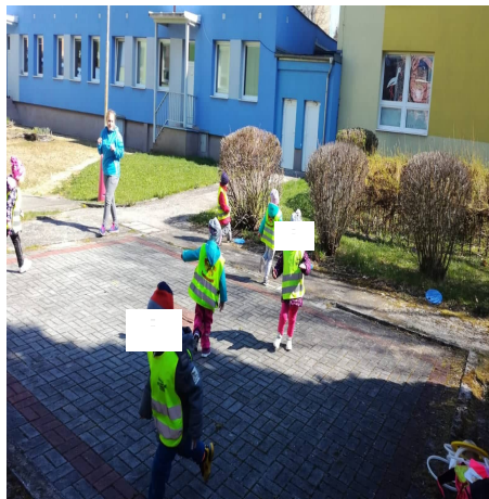
Obrázek 24 – Škatulata B