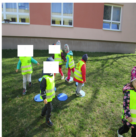
Obrázek 27 – Louže A

Reflexe: Při činnosti jsem děti nechala ať si každý sám zvolí, jakou formou mokřinu překonají. Většina dětí zvolila přeskoky, jiné děti zase hledaly úzké mezery mezi loužemi. Hru jsme několikrát ztížili přidáním několika louží a děti zvládly i těžší verze.