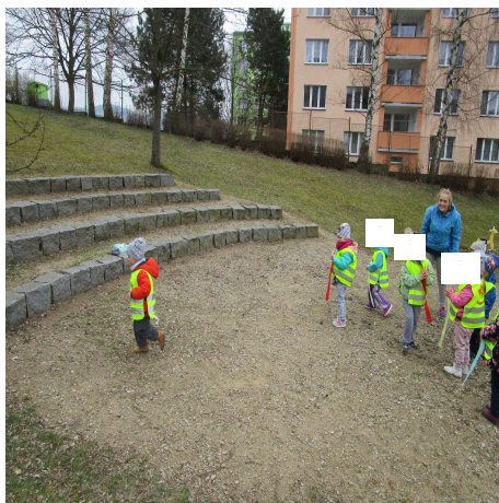
Obrázek 39 – Úkoly A

Reflexe: Snažila jsem se vymýšlet úkoly jednoduché a vhodné k věku dětí. Přidala jsem každému dítěti stužku jiné barvy, abych mohla pracovat s více podněty.