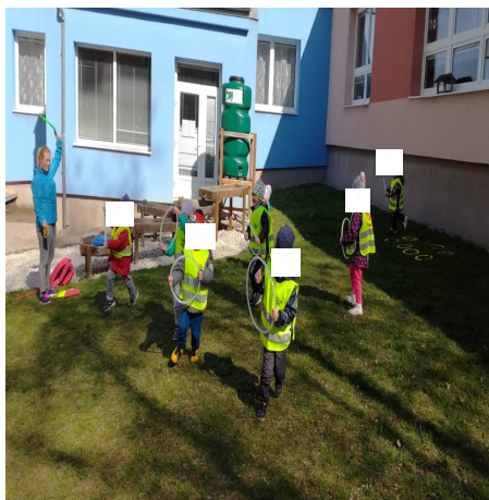
Obrázek 38 – Auta B