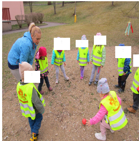
Obrázek 34 – Koulená B