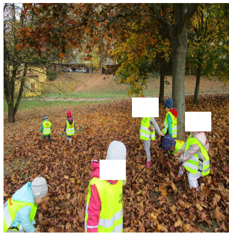
Obrázek 14 – Listí B