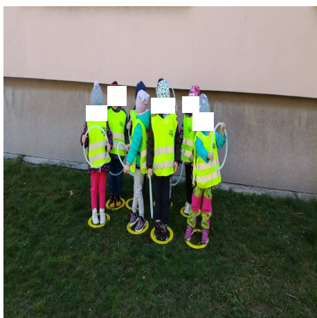
Obrázek 37 – Auta A

Reflexe: Děti všechny úkoly lehce zvládly. Často opakujeme tyto barvy na semaforu i ve třídě. Je to oblíbená hra dětí i za doprovodu tématické písničky. Vždy při zvednutí nějaké barvy jsem počkala až si všechny děti všimnou a splní úkon.