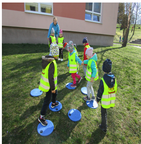
Obrázek 28 – Louže B