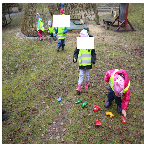
Obrázek 5 – Korálky A

Reflexe: Dětem se tato hra moc líbila a chtěly ji několikrát opakovat. Postupně jsem zkoušela zkracovat čas. Při přípravě hry mi praskla nádoba s korálky a všechny korálky se neplánovaně vysypaly do trávy. Bylo to místo, které jsem si vybrat nechtěla, ale tuto situaci jsem využila k motivaci dětí, které moji rozpačitou reakcí byly dostatečně motivované na sběr korálků v trávě.