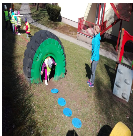
Obrázek 22 - Dráha B