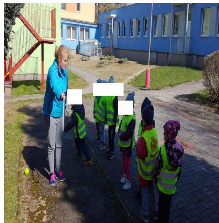
Obrázek 20 – Hod B