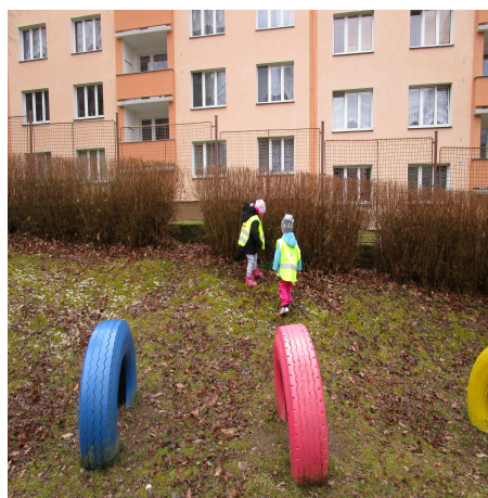
Obrázek 26 – Ano, ne B