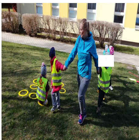
Obrázek 31 -Včelky A

Reflexe: Děti při činnosti měly stále tendenci se rozdělovat. Řekla jsem jim tedy, jak je důležité, aby všechny včely držely pohromadě, protože všechny včely bydlí v jednom velkém úlu a musí společně všechny z kytiček dorazit do úlu. S dětmi jsem zkusila i modifikaci hry, která se jim také dobře dařila.