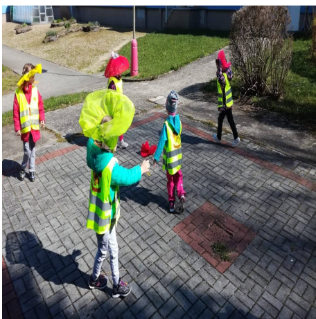
Obrázek 15 – Víly A

Reflexe: Vybrala jsem prostředí u mateřské školy. Dětem se většinou líbily více víly. Hry se sukýnkami již znaly, protože je hodně používáme v mateřské škole a jsou u dětí velmi oblíbené. Děti se spíše chtěly pohybovat než hrát na hudební nástroje, ale nechala jsem všechny, ať si vyzkouší obě dvě aktivity. Pomáhala jsem jim i s tancem, protože většina dětí si ještě nedokáže vymyslet vlastní. Tento fakt jsem si neuvědomila. Začala jsem vymýšlet různé lehké taneční kreace, které děti po mě opakovaly.