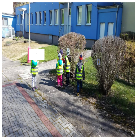
Obrázek 4 – Přilep se B