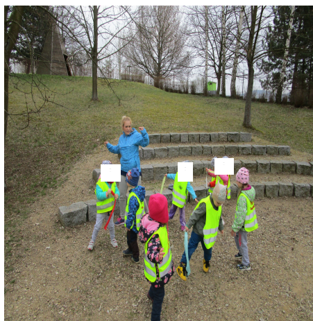
Obrázek 40 – Úkoly B