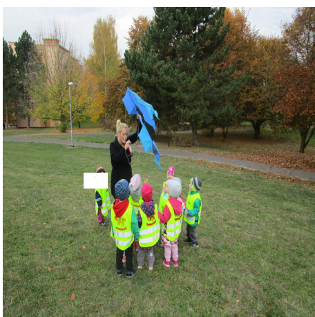
Obrázek 9 – Drak A

Reflexe: Děti běhaly za mnou a měly radost z létajícího draka. Společně jsme ho pozorovali a zazpívali písničku. Některé děti začaly běhat z radosti kolem, nechala jsem jim umožněný volný pohyb, ale určila jsem pravidla, v jakém prostoru se mohou pohybovat.