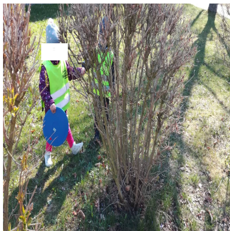
Obrázek 17 – Květiny A

Reflexe: Hru jsme hráli při příchodu jara, kdy je možné pozorovat první květiny. Dětem jsem nejdříve ukázala květinu, kterou jsem našla já, aby měly představu, co hledat. Květiny v květináčích jsme postavili na místo, kde jsme si řekli, jak se ke květinám chováme, a jak o ně pečujeme. Všechny děti našly každý jednu květinu a pokud někdo nemohl najít, pomohl některý z kamarádů.