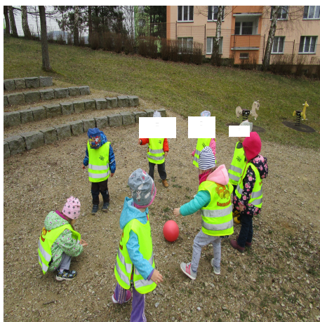
Obrázek 33 – Koulená A

Reflexe: Při realizaci této hry si děti vedly velmi dobře. Hru jsem hrála s kolektivem, který se už lépe zná. Děti zvládly nasměrovat míč správným směrem. Zkusili jsme si zahrát hru i s jinými míči, a nejvíce se dětem hra líbila s měkkým míčem. S malými míčky děti manipulovaly hůře.