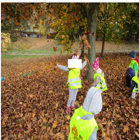
Obrázek 13 – Listí A

Reflexe: S dětmi jsme činnost realizovali blízko mateřské školy. Vybrala jsem záměrně prostředí, které bylo co nejvíce bezpečné. Děti se v listí pohybovaly a poslouchaly i šustění listí. Při činnosti jsme si zazpívali několik podzimních písní a listí bylo pro děti velmi lákavé. Šlo vidět, že se děti stále držely v naší blízkosti, což bylo známkou správného vysvětlení a pochopení pravidel.