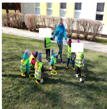
Obrázky 32 – Včelky B