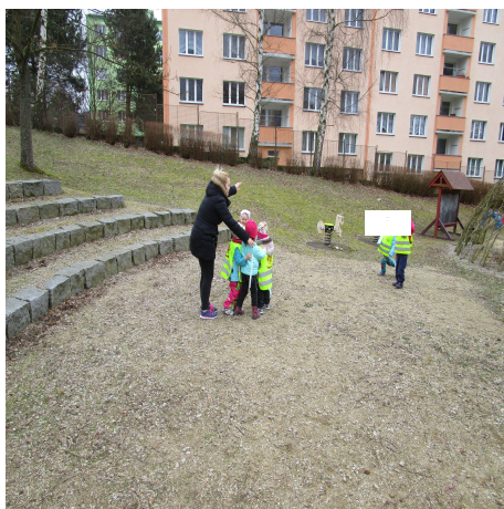
Obrázek 35 – Meluzína A

Reflexe: Děti hru hned pochopily a zvládly dodržovat bez problémů pravidla. Šlo vidět, že se některé děti nechávají chytat schválně, aby se také mohly stát meluzínou. Při hře, kdy děti měly k dispozici domeček, jsem musela hru více slovně korigovat a děti pobízet, aby opět vyběhly z domečku.