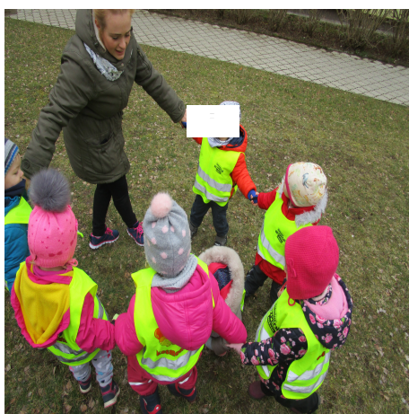
Obrázek 1 - Zajíček A

Reflexe: Dětem jsem vysvětlila pravidla hry, které pochopily dobře. Při první hře jsem narazila na úskalí, že některé děti nezvládly vybrat kamaráda, který stojí naproti. Udělala jsem tedy změnu. Byla to pro mě nečekaná situace a děti, které nezvládly původní pravidlo si mohly vybrat kamaráda, kterého chtěly. Často se děti nemohly rozhodnout, tak jsem hru musela více slovně vést. U druhé varianty, některé děti nechtěly mít zavřené oči. Obě dvě varianty se dětem líbily a zvládly je.