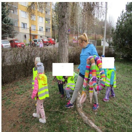
Obrázek 11 – Zahrada A

Reflexe: Dětem se prohlídka zahrady velice líbila, zvládly i chůzi do kopce a z kopce. Poslouchaly, k čemu pomůcky slouží a vyzkoušely si i klouzačku. Některé děti chtěly stále chodit za ruku. Podívali jsme se i na ostatní pavilony školky a zkusila jsem se dětí zeptat, v které budově máme třídu my.