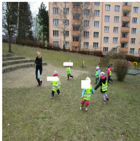
Obrázek 8 – Sochy B