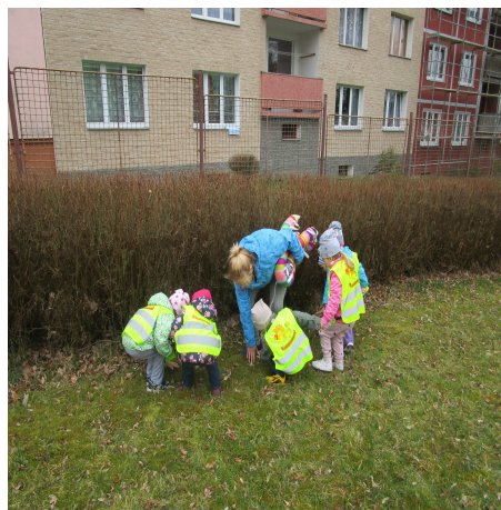
Obrázek 12 – Zahrada B