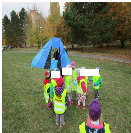
Obrázek 10 – Drak B