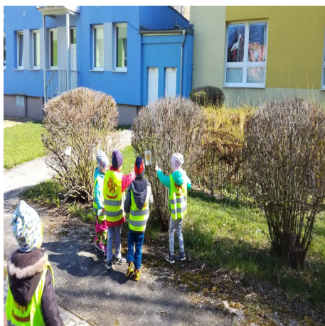
Obrázek 3 – Přilep se A

Reflexe: S dětmi jsme spíše praktikovali i modifikaci s hádáním a lépe se tak soustředily. Naopak s vyprávěním příběhu u dětí soustředění klesalo. Když se děti pohybovaly po prostoru, vyťukávala jsem rytmus do klacíků, a podle rytmu běhaly. Hra proběhla v pořádku, ale je dobré si dát pozor na vybírání prostoru, aby se hra nerozpadla kvůli obrázku k nepovšimnutí. Volíme spíše prostor přirozeně ohraničený.