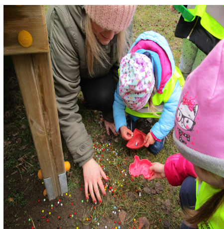
Obrázek 6 – Korálky B