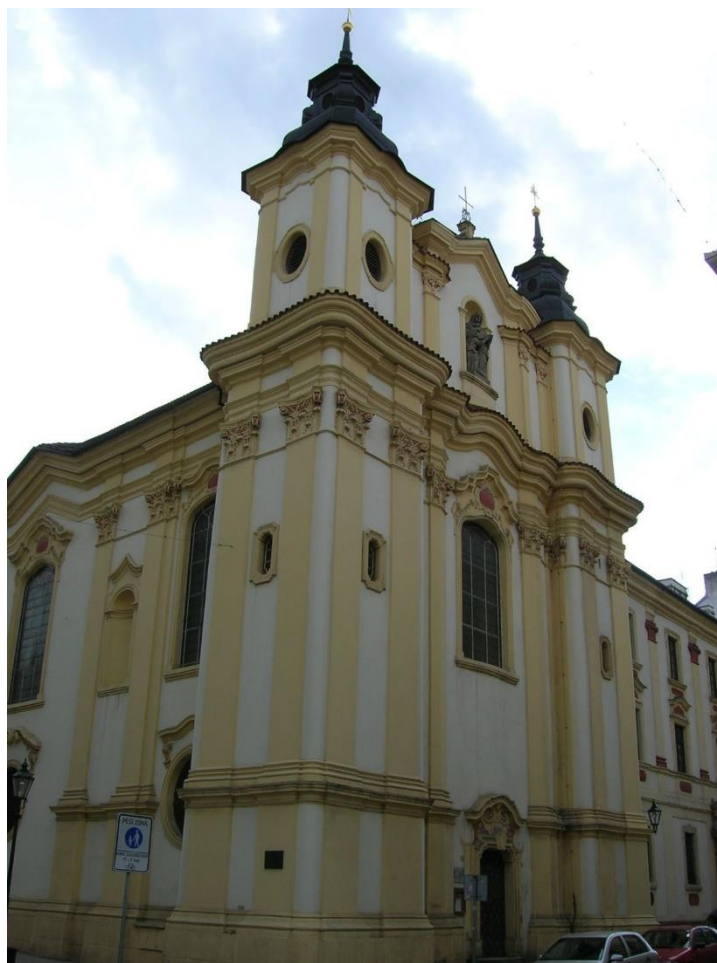
Příloha č. 4 191