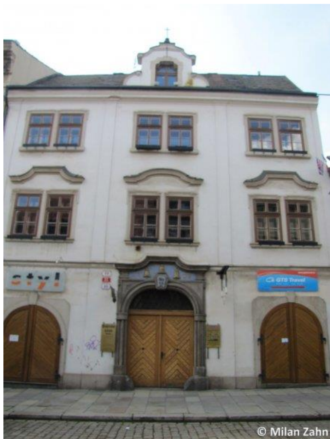
Příloha č. 6 193