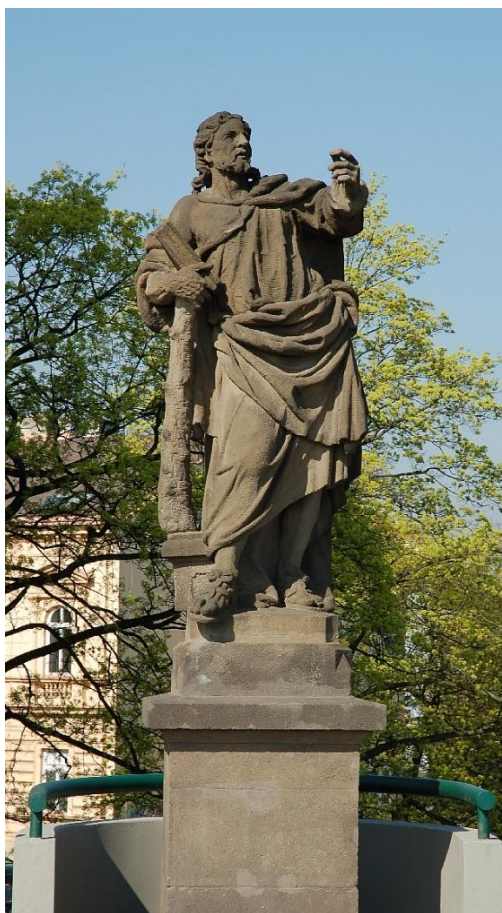
Příloha č. 14 201