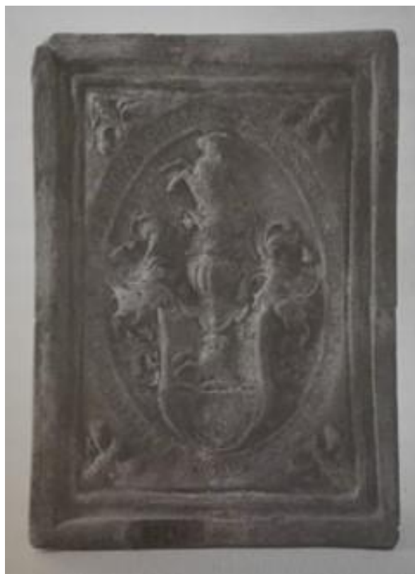
Příloha č. 10 197