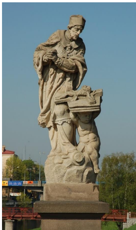
Příloha č. 12 199