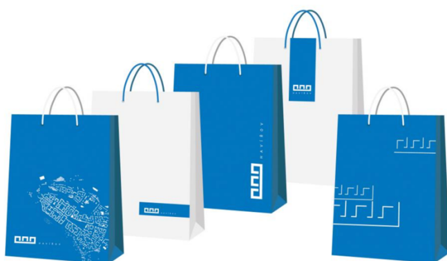
Příloha č. 5: Ukázka současného vizuálního stylu

http://www.adamguzdek.cz/design/corporate-design/jednotny-vizualni-styl-statutarniho-mesta-havirova/