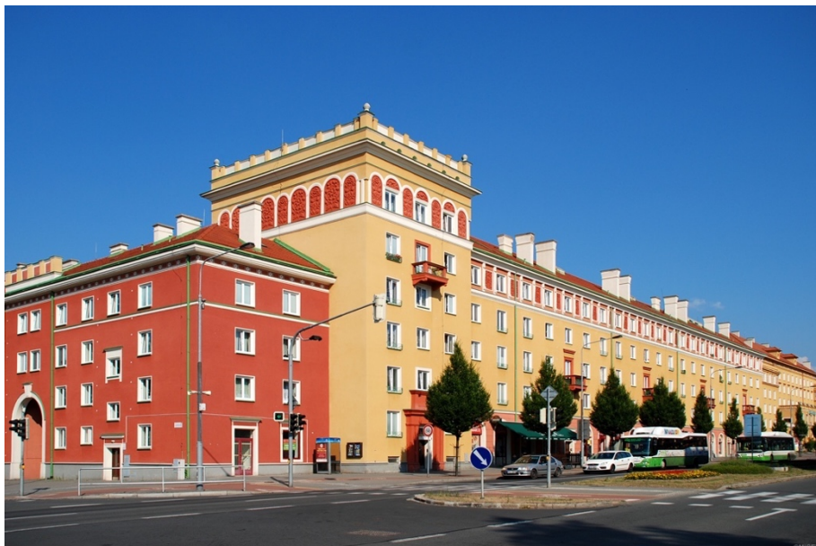
Příloha č. 1: Budovy na hlavní třídě ve stylu sorely

https://www.flickr.com/photos/61257905@N03/20561144472