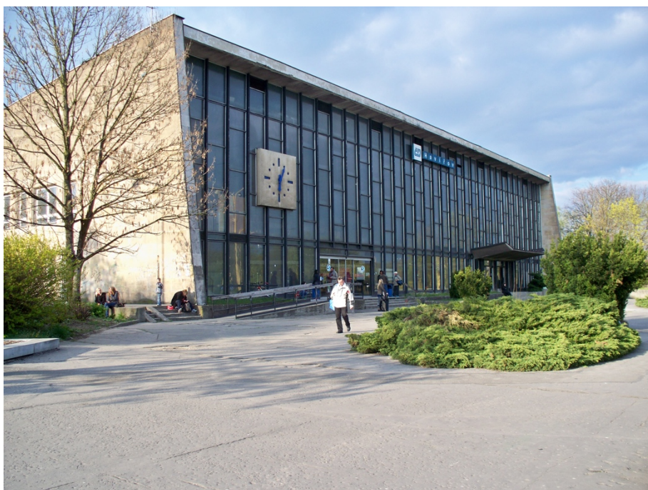
Příloha č. 2: Budova vlakového nádraží v bruselském stylu

https://www.flickr.com/photos/61257905@N03/20561144472