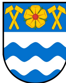
Příloha č. 4: Znak města Havířov