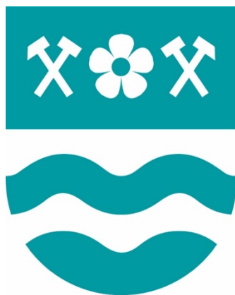
Příloha č. 12: Nový znak města Havířov