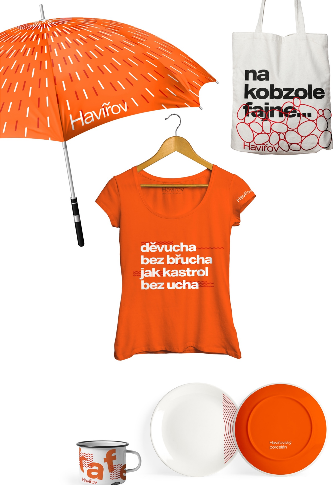
Příloha č. 19: Propagační materiály