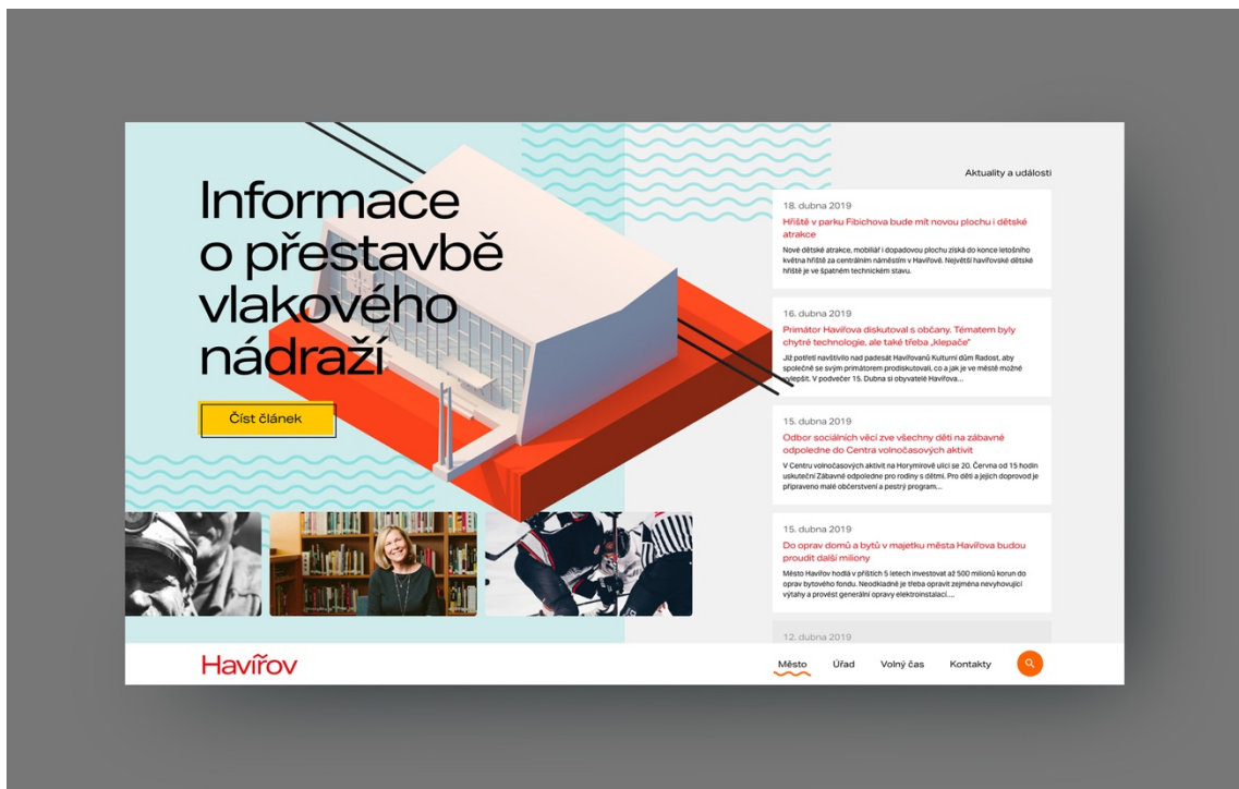
Příloha č. 18: Webové stránky – úvodní strana