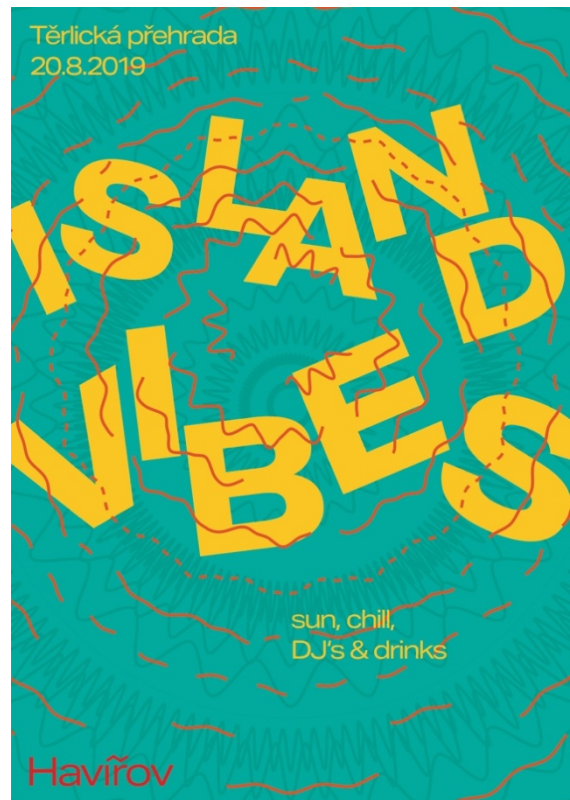
Příloha č. 15: Plakáty