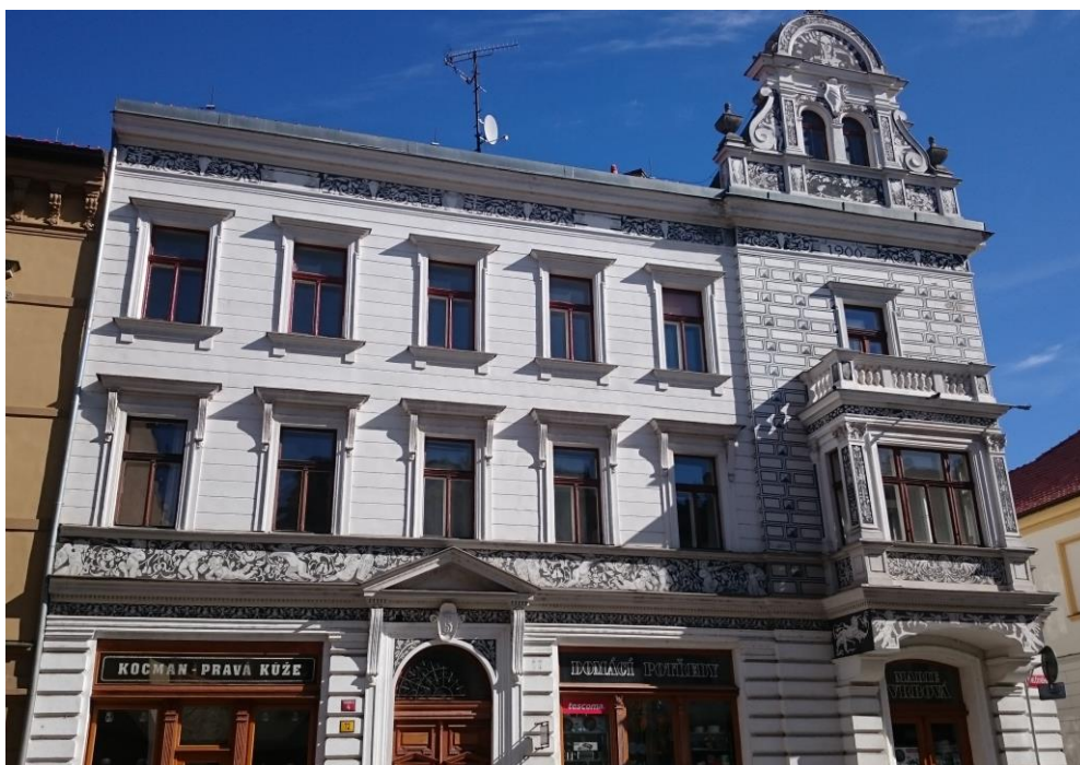
Obrázek 5: Dům v Chelčického ulici č.p. 72