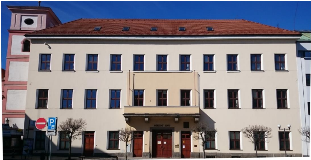
Obrázek 2 : Nová budova Okresního soudu v Písku