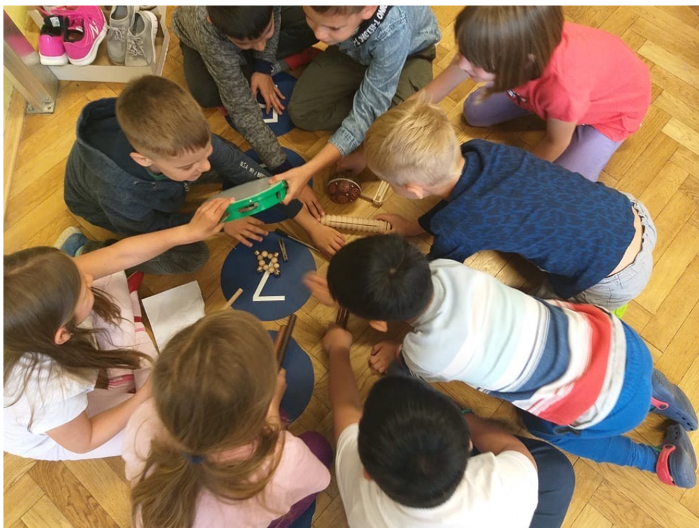
Obrázek 5 - Děti se seznamují s vybraným hudebními nástroji