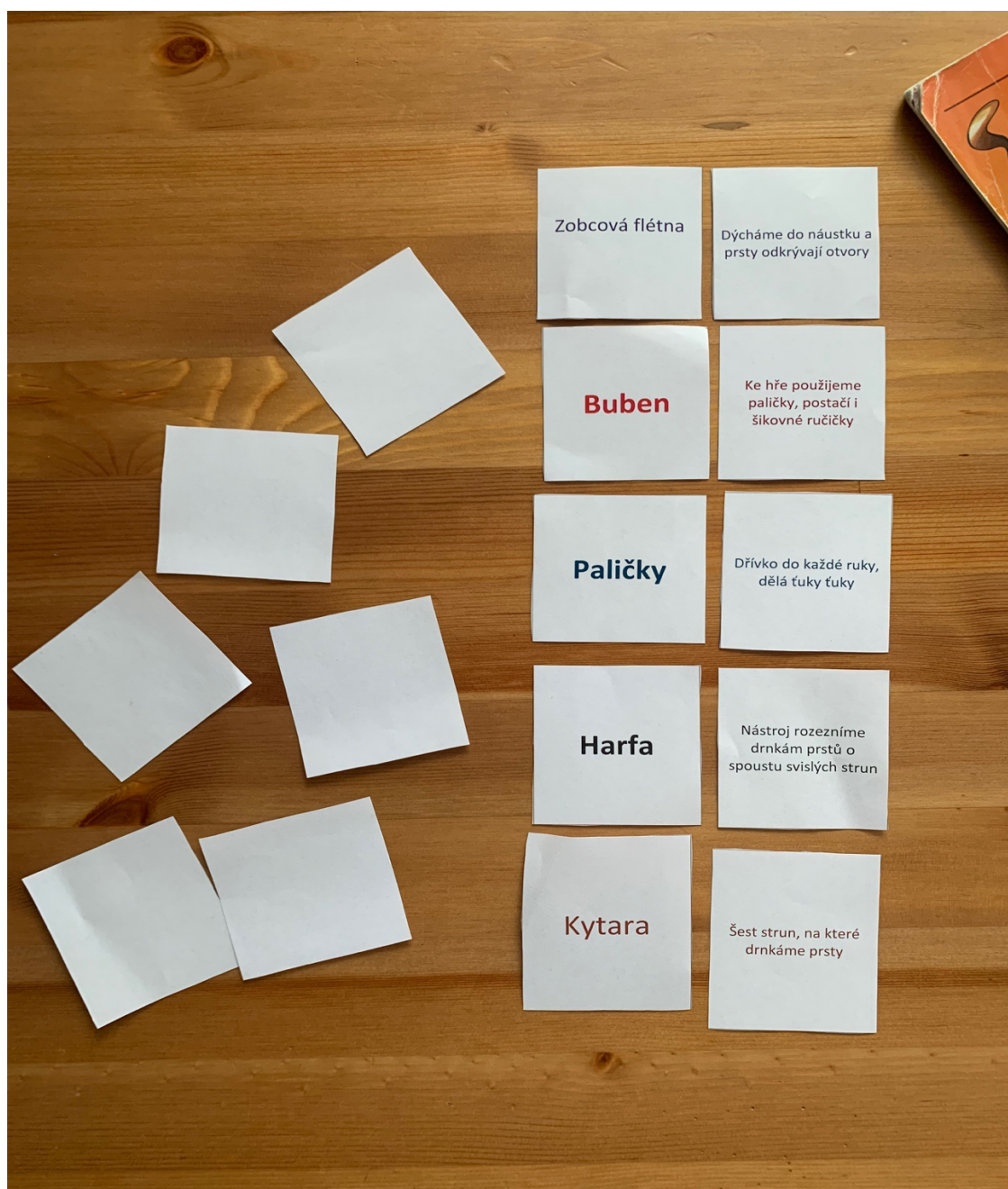
Obrázek 7 - Hudební pexeso jako aktivita na závěr hodiny hudební výchovy (autor: Tereza Moulisová)