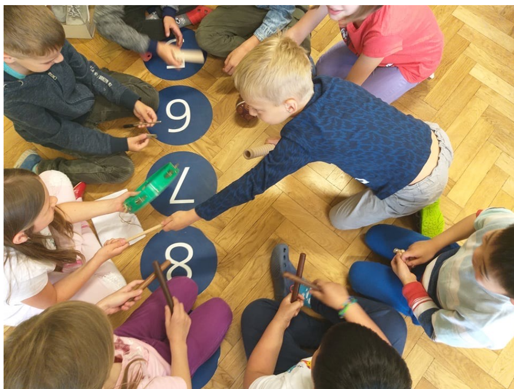
Obrázek 6 - Děti se seznamují s vybranými hudebními nástroji