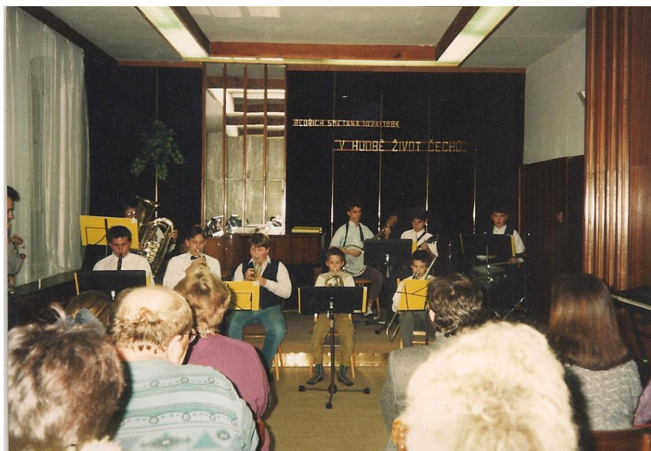
Obrázek 3 Koncert v ZUŠ Planá, jaro 1995