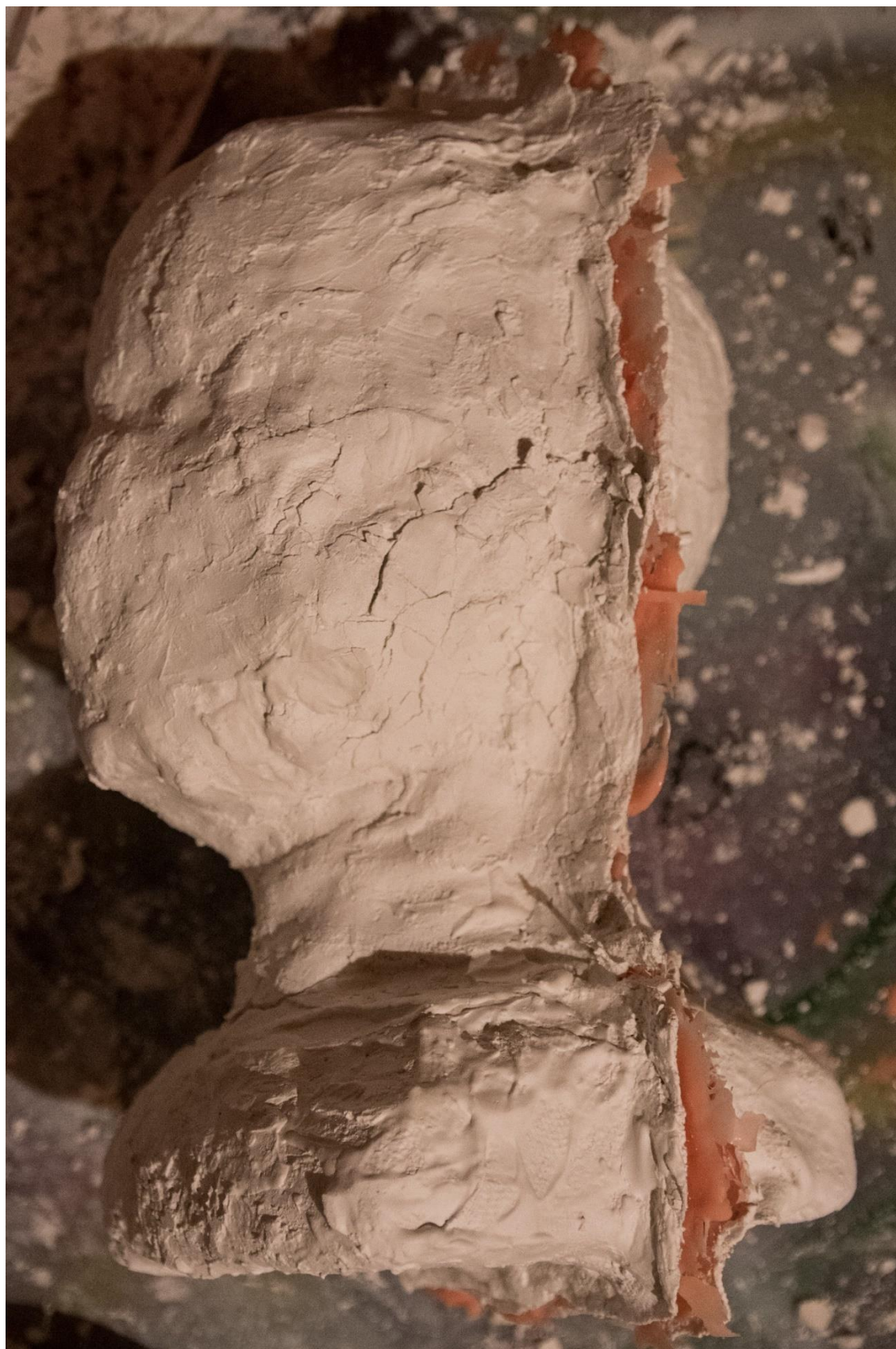
Kadlub ze sádry