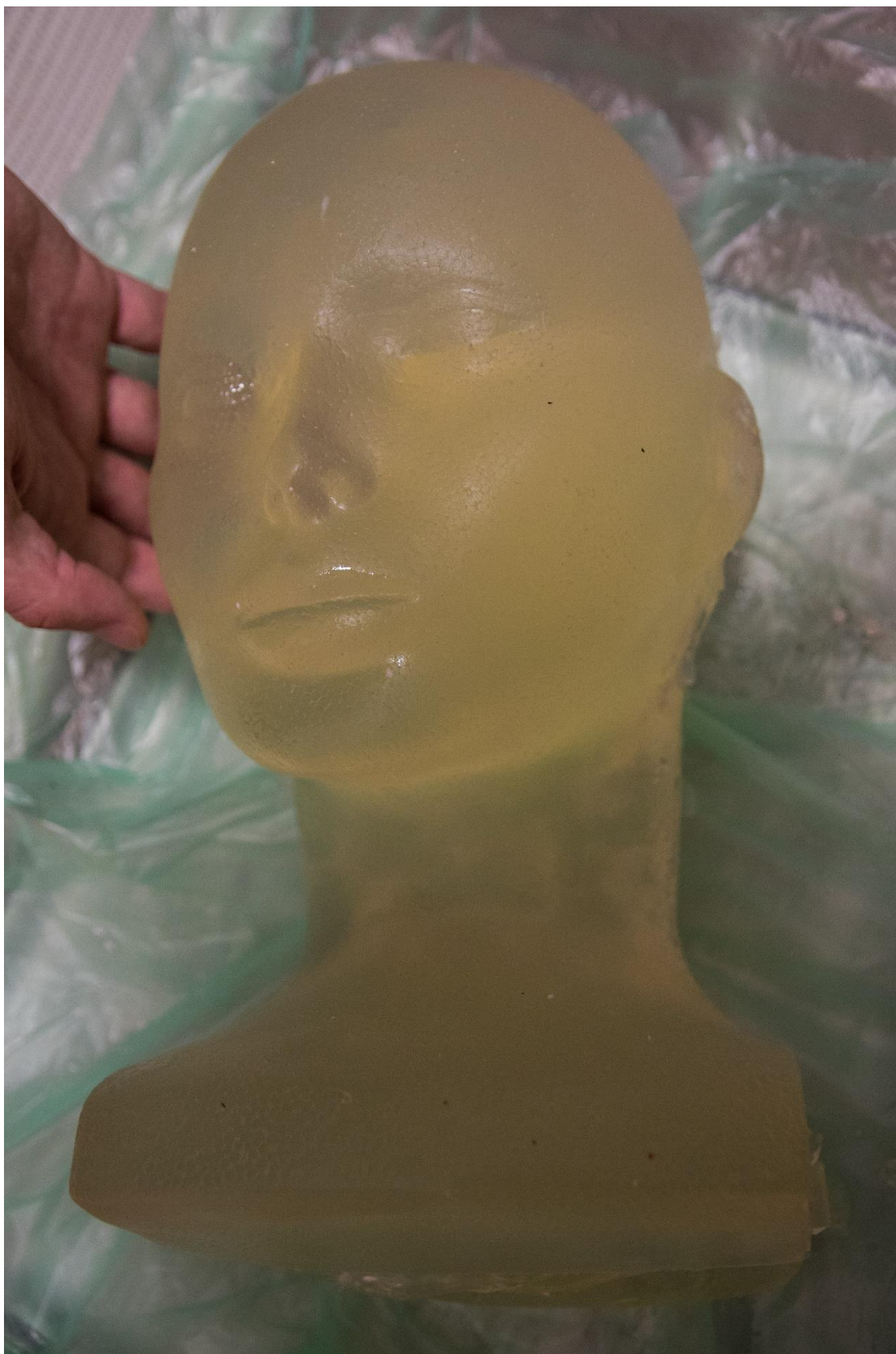
Želatinová hlava z vepřové želatiny