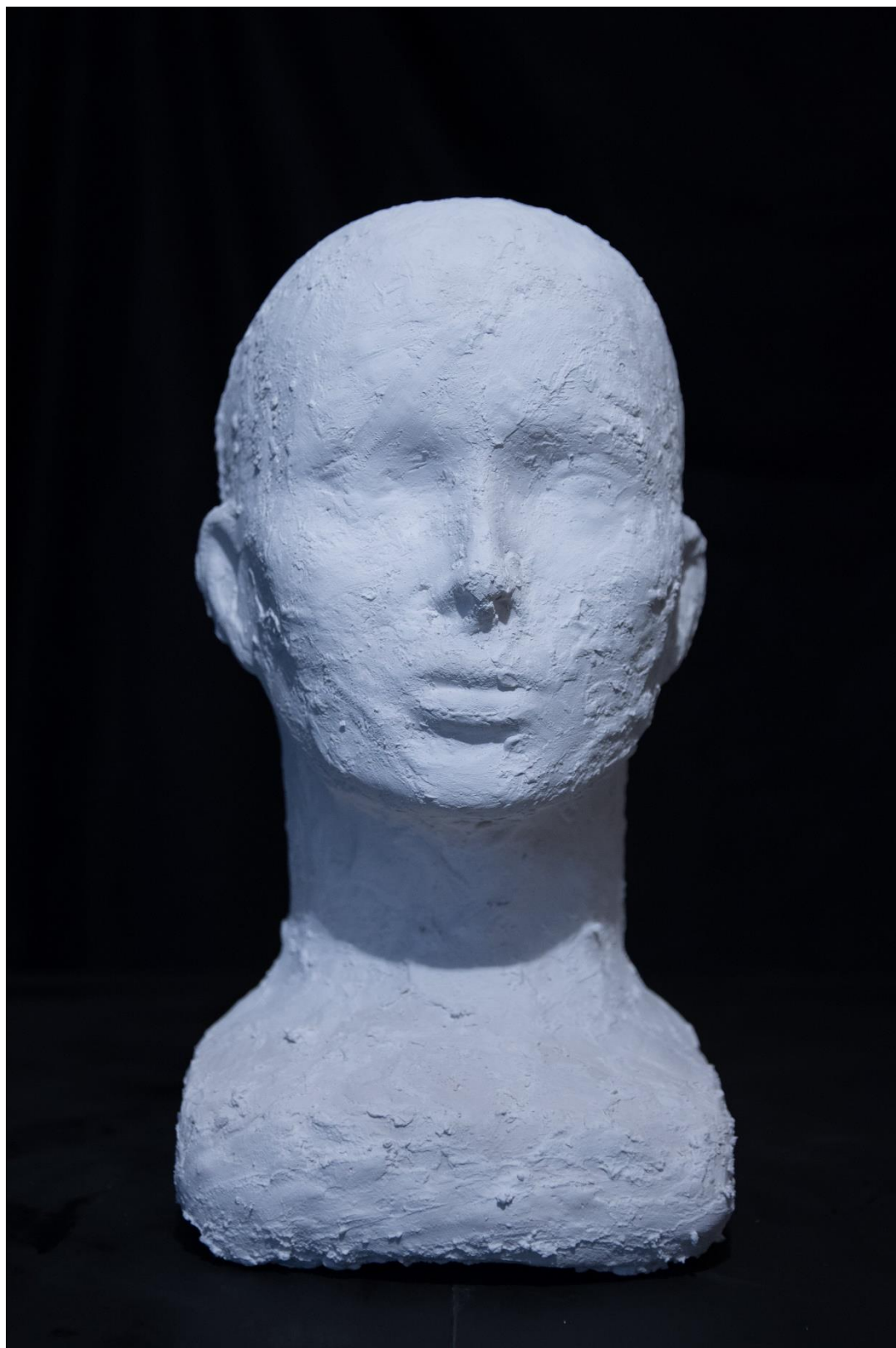
Sádrová hlava s přidanou texturou