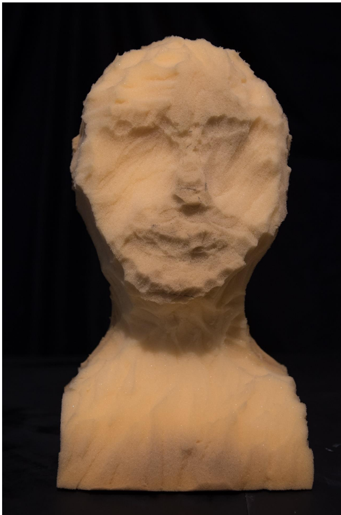
Molitanová hlava