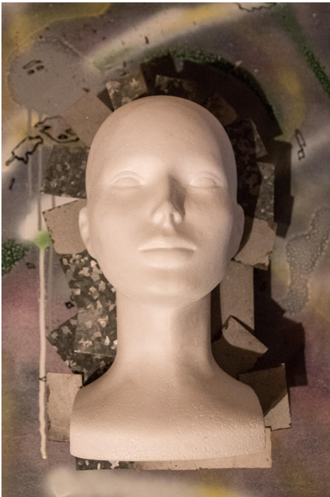
Polystyrenová hlava s plechovými pláty po obvodu