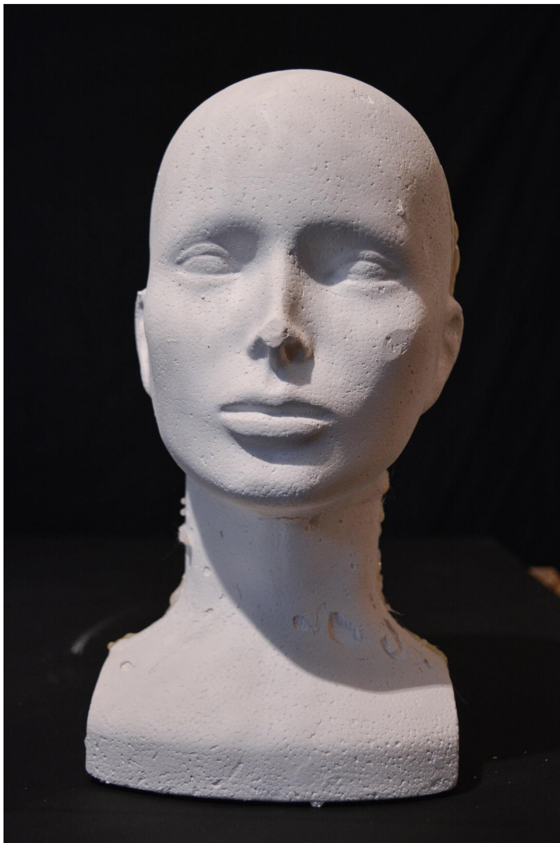
Sádrová hlava