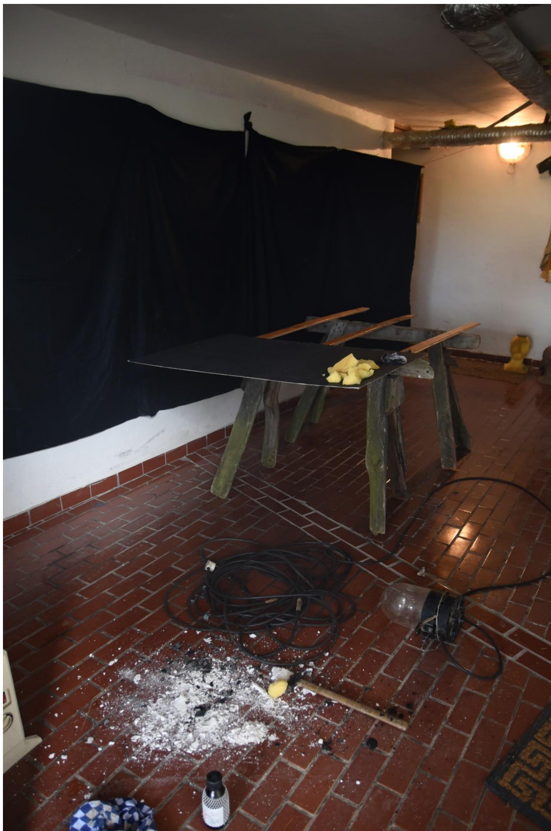
Garáž 2