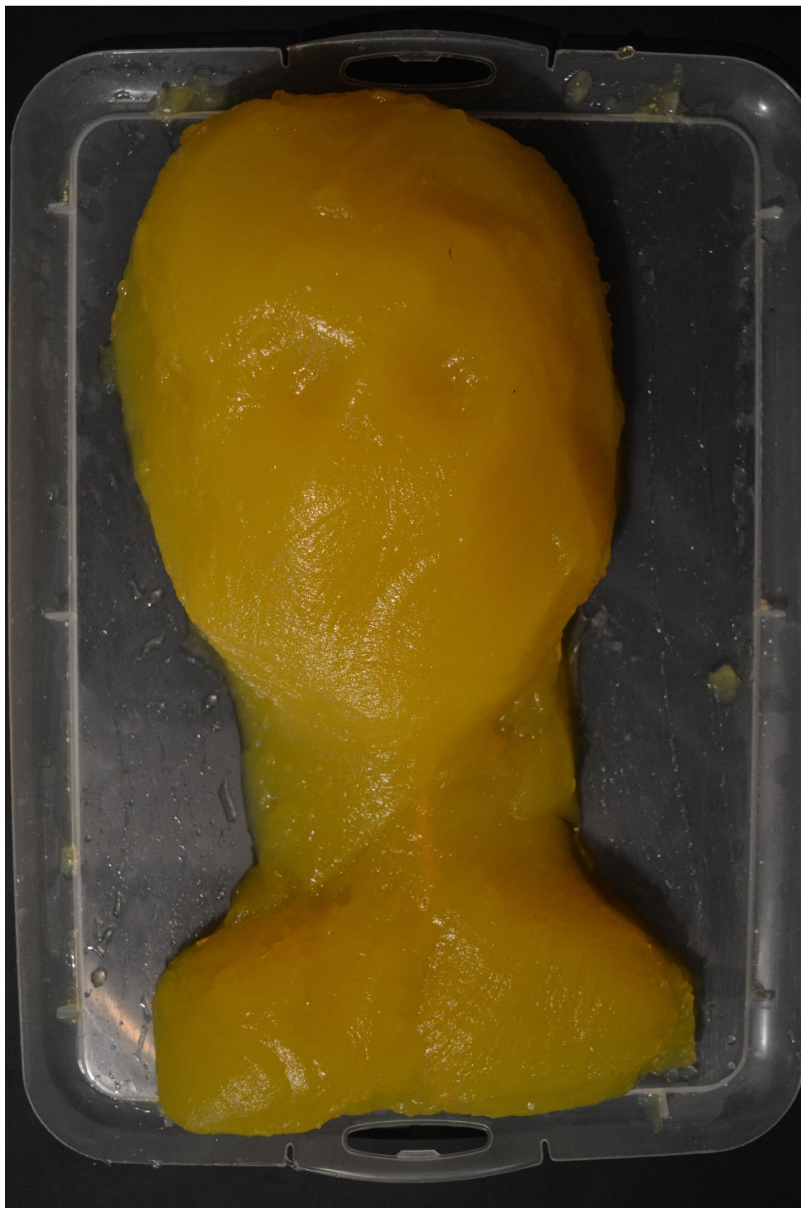
Želatinová hlava z cukrářské želatiny