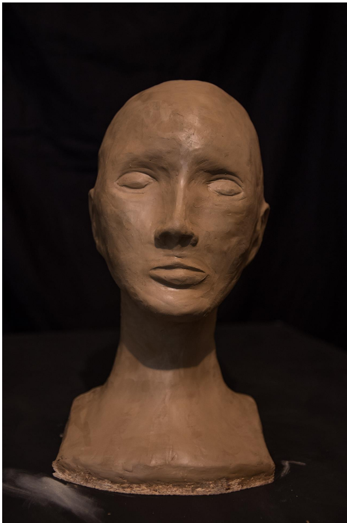
Hlava z hlíny