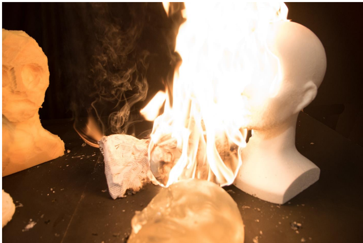
Hořící hlavy