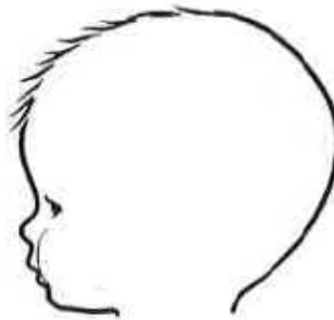
Obr. 2: Baby schéma

Odpověď na baby schéma má důležitou funkci v lidském vnímání, protože implikuje pečovatelský sklon i interakci mezi dítětem a matkou. To ostatně prokázali Glockerová a spol. (2009) prostřednictvím výzkumu vlivu baby schématu na vnímání roztomilosti a s tím spojené motivace k péči. Upravením fotografií dětských obličejů vytvořili široký a kulatý obličej s vysokým čelem, tedy obličej s vysokým baby schématem, a obličej opačný, s nízkým baby schématem, s úzkým obličejem a nízkým čelem. Probandi určovali roztomilost těchto obličejů i míru motivace k péči o ně. Výsledek ukázal jednoznačnou roztomilost obličeje s vysokým baby schématem a vysokou míru motivace k péči (Glocker a spol. 2009: 257-258). Podobným výzkumem vlivu dětských obličejových rysů na roztomilost se zabývaly Hildebrandtová a Fitzgeraldová (1979). Zjistily, že děti s více dětskými rysy jsou hodnoceny jako více roztomilé, přičemž jako roztomilejší byly v jejich výzkumu hodnoceny dívky než chlapci. Obecně byly jako více roztomilé hodnoceny starší děti, konkrétně dívky ve věku devíti měsíců a chlapci ve věku jedenácti měsíců. Autorky usuzují, že jedním z aspektů roztomilosti je úroveň vývoje, tzv. relativní stadium zralosti, přičemž dívky vrcholu vývoje dosahují dříve než chlapci. Nicméně autorky dodávají, že obecně je rozdíl mezi pohlavími spíše minimální a rozdíly v rysech roztomilosti mezi dívkami a chlapci v podstatě nejsou (Hildebrandt a Fitzgerald 1979: 332-333, 337).