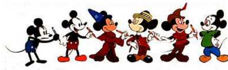
Obr. 3: Vývoj kreslené postavičky Mickey Mouse od roku 1928 do roku 1990

nebývala zprvu tak roztomilá, jak ji známe dnes. Ve svém vývoji šel Mickey totiž opačným směrem, od dospělého vzhledu k dětskému (obr. 3). Jeho konečná, dětská, podoba je přitažlivější a tím i prodejnější (Genosko 2009: 1; Eibl-Eibesfeldt 1989: 61-62).