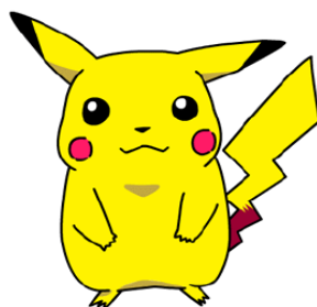
obr. 4: Pokémon Pikachu

Obdobným příkladem může být japonská kultura a její odpověď americkému Mickey Mouseovi v podobě Pokémona Pikachu (obr. 4), který se stal fenoménem také hlavně proto, že je roztomilý. Pro Japonce znamená roztomilost jakési emocionální připoutání. Dle nich se pojí s takovými pozitivními vlastnostmi a hodnotami jako je vřelost, bezpečí či příjemnost. Spojují ji převážně s dívkami, ovšem neberou ji jako vyloženě ženský rys, protože i muži mohou být roztomilí, např. když mužský obličej vypadá zženštile (Allison 2004: 38).