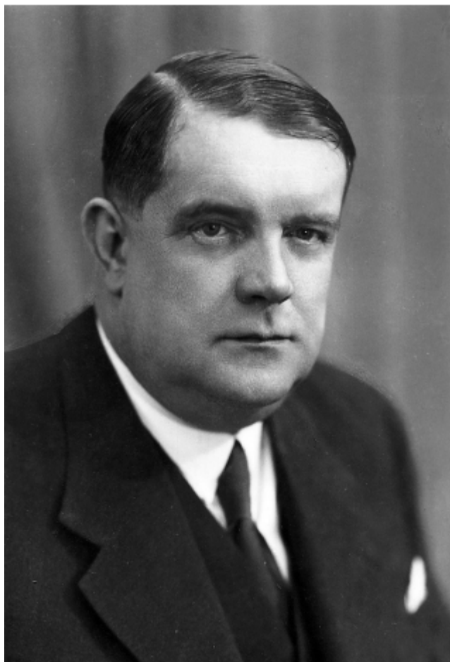
Příloha č. 4