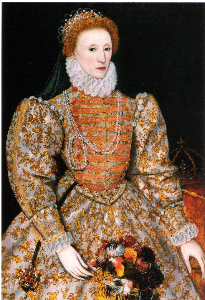
Anglická královna Alžběta I. In: National Portrait Gallery London [online]. [cit. 2020-24-07]. Dostupné z https://www.npg.org.uk/whatson/event-root/november/portrait-of-the-day-02112019