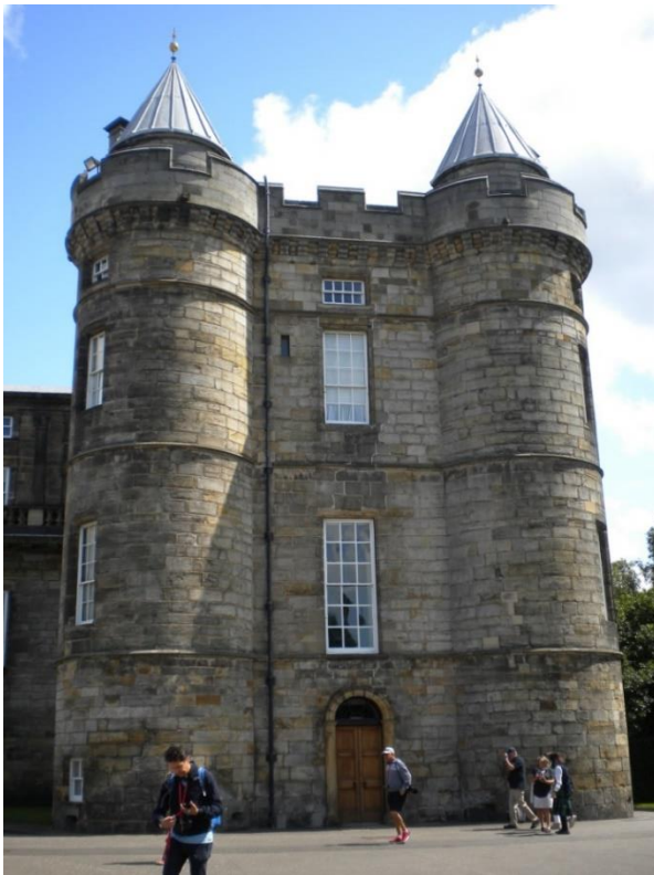
Holyrood, královské sídlo v Edinburghu. Autorka: Veronika De Monte.