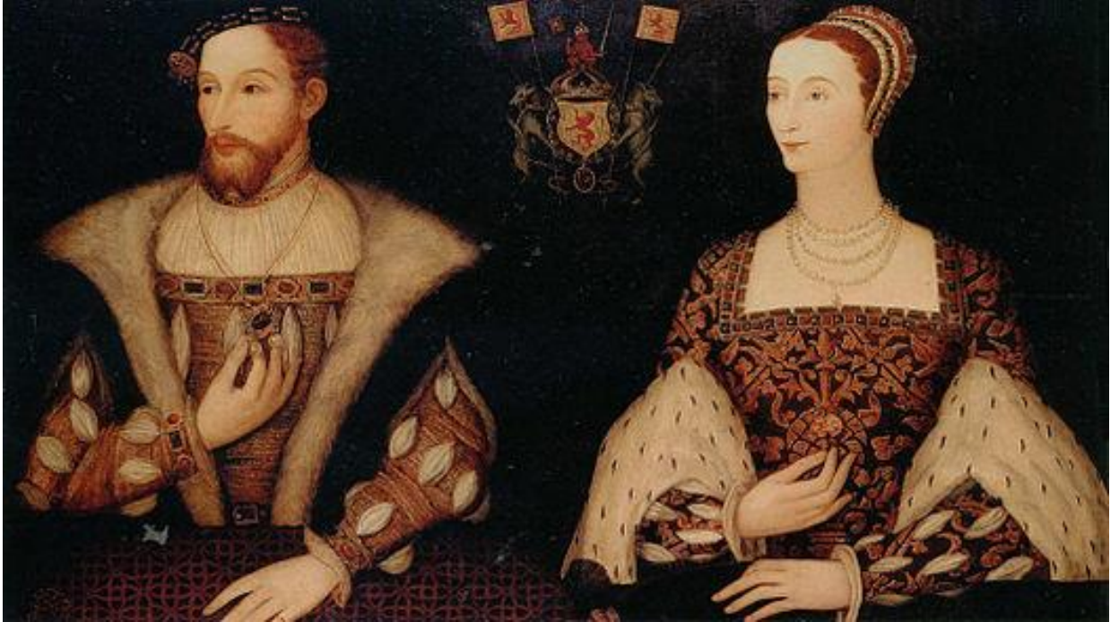
Rodiče Marie Stuartovny, Skotský král Jakub V. a Marie de Guise.