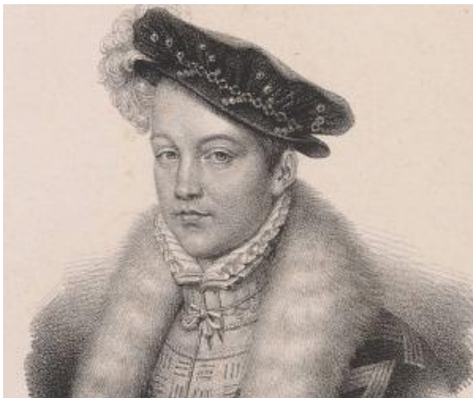
František II., francouzský král a první manžel Marie Stuartovny. In: The famous people [online]. [cit. 2020-24-07]. Dostupné z https://www.thefamouspeople.com/profiles/francis-ii-of-france-37625.php