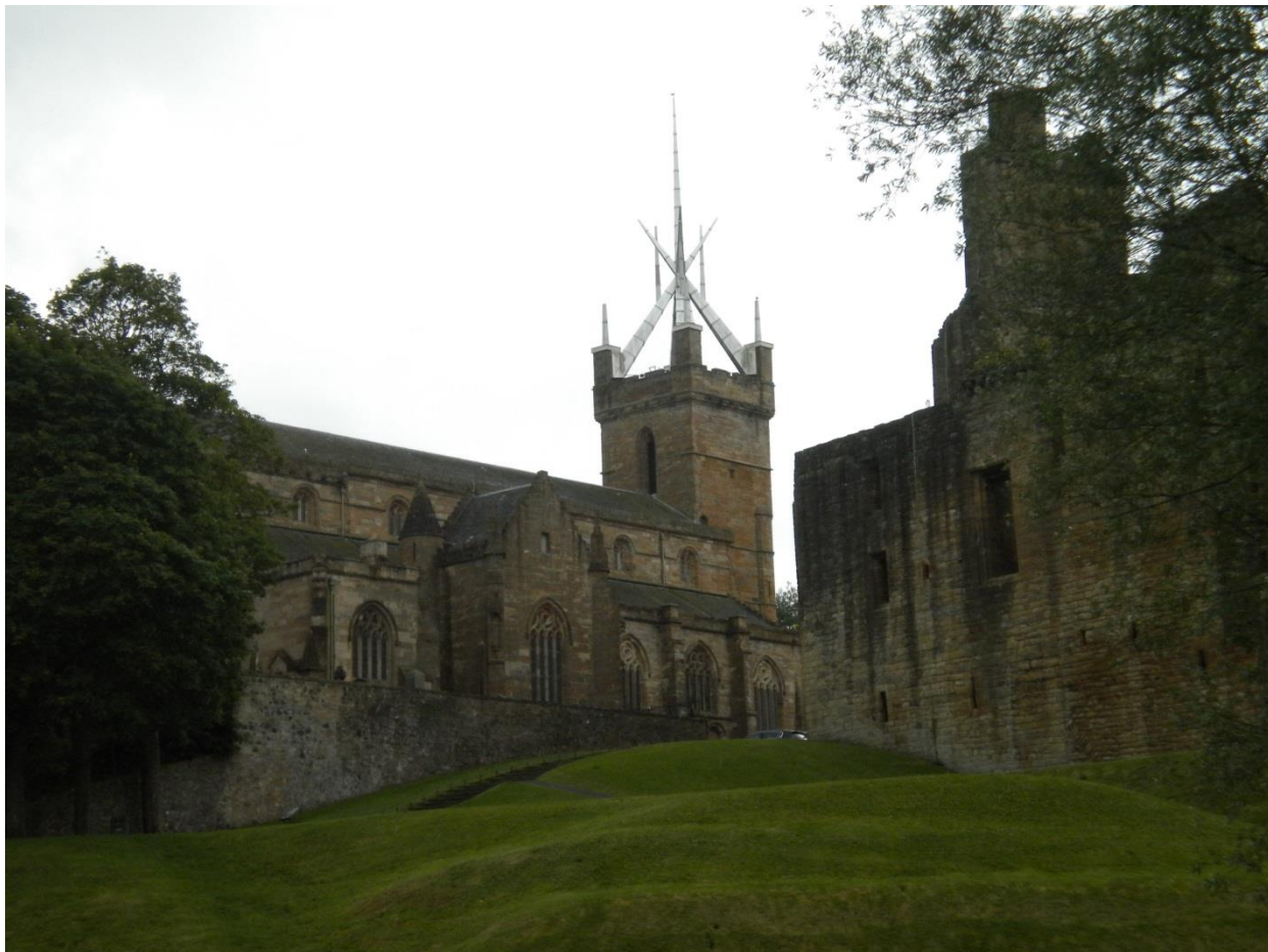
Palác Linlithgow.