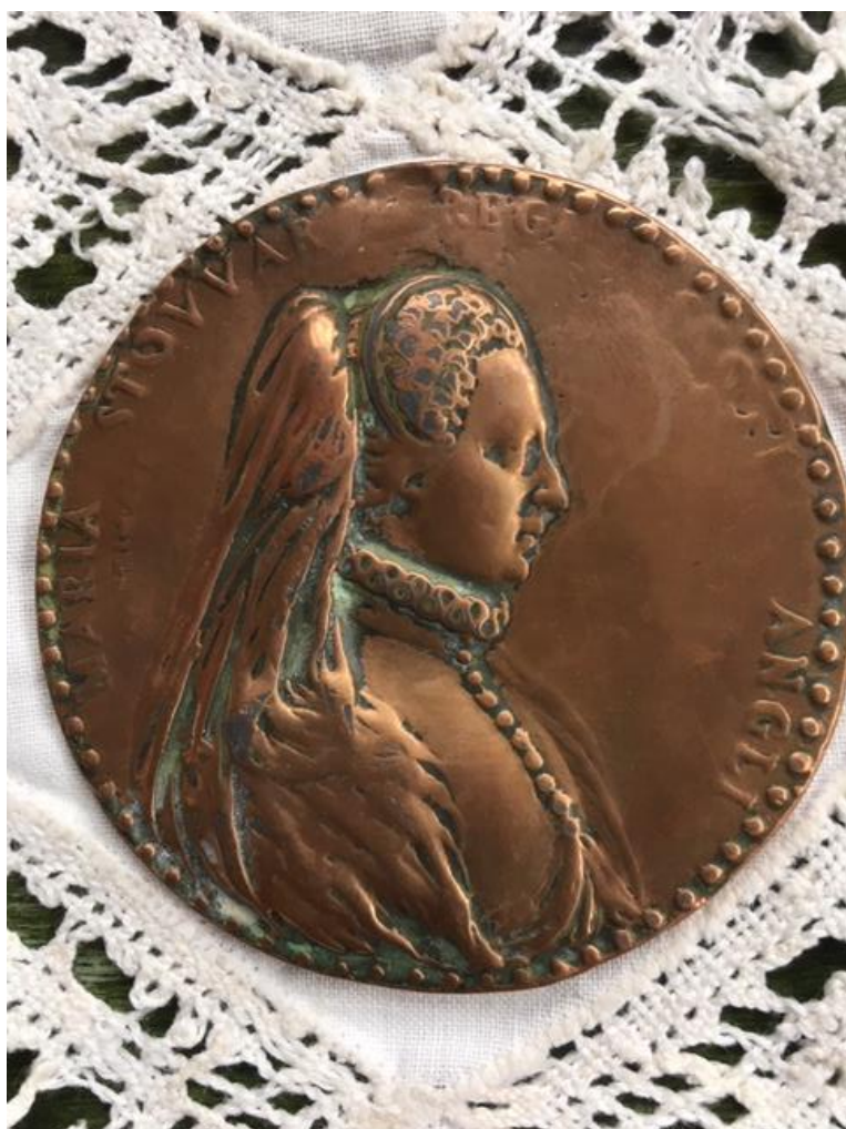
Marie, galvanotyp z roku 1572 podle Jacopa Primavery. In: National Portrait Gallery [online]. [cit. 2020-24-07]. Dostupné z https://www.npg.org.uk/collections/search/portrait/mw04274/Mary-Queen-of-Scots?LinkID=mp02996&role=sit&rNo=2