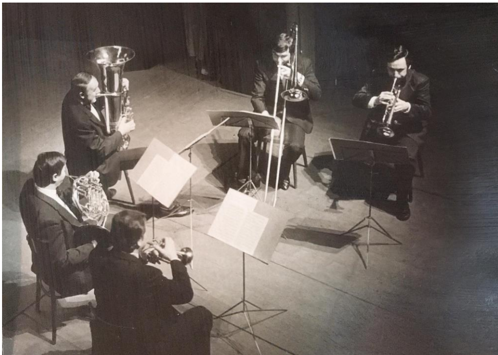
Příloha č. 24: Koncert žesťového kvintetu složený z učitelů ZUŠ Josefa Kličky a členů Vojenské hudby Klatovy v klatovském divadle, rok 1984.