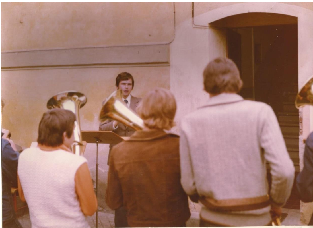
Příloha č. 1: Jeden z prvních koncertů Dechového orchestru mladých (DOM) před domovem důchodců (nynější Segafredo), Klatovy, 1978.