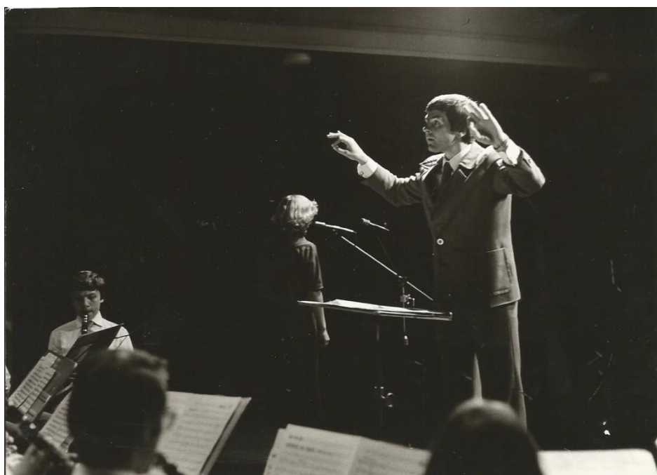
Příloha č. 2: Slavnostní koncert DOM v klatovském divadle, rok 1982.