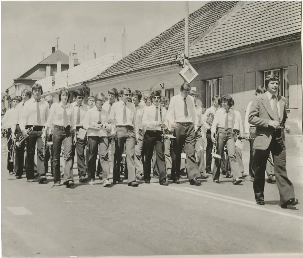
Příloha č. 5: DOM na festivalu Švihovské hudební léto , rok 1979.