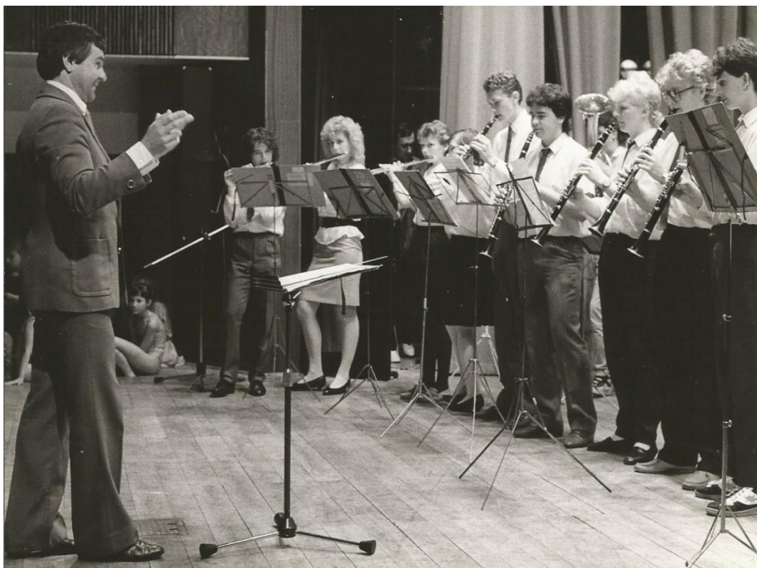
Příloha č. 4: Prezentace souborů klatovské ZUŠ Josefa Klíčky v kulturním domě Klatovy, rok 1984.