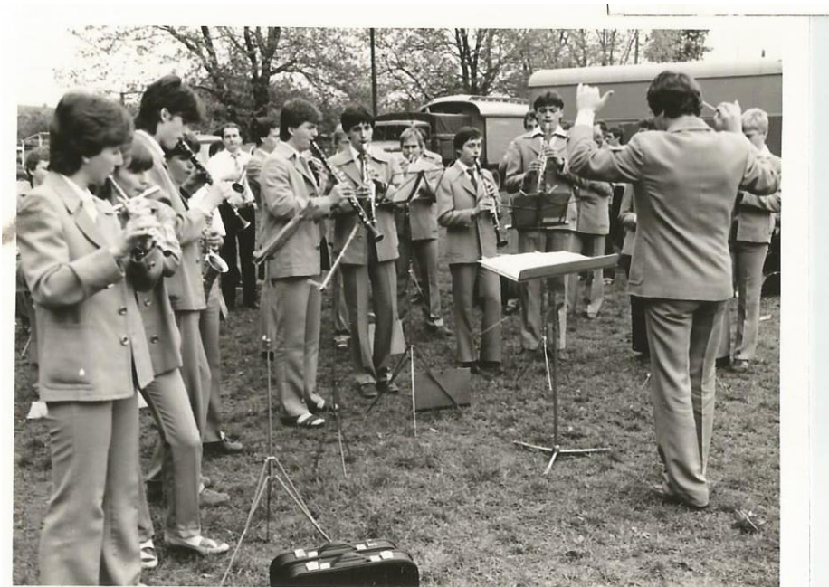
Příloha č. 6: Jeden z četných zájezdů DOM do NDR, rok 1980.