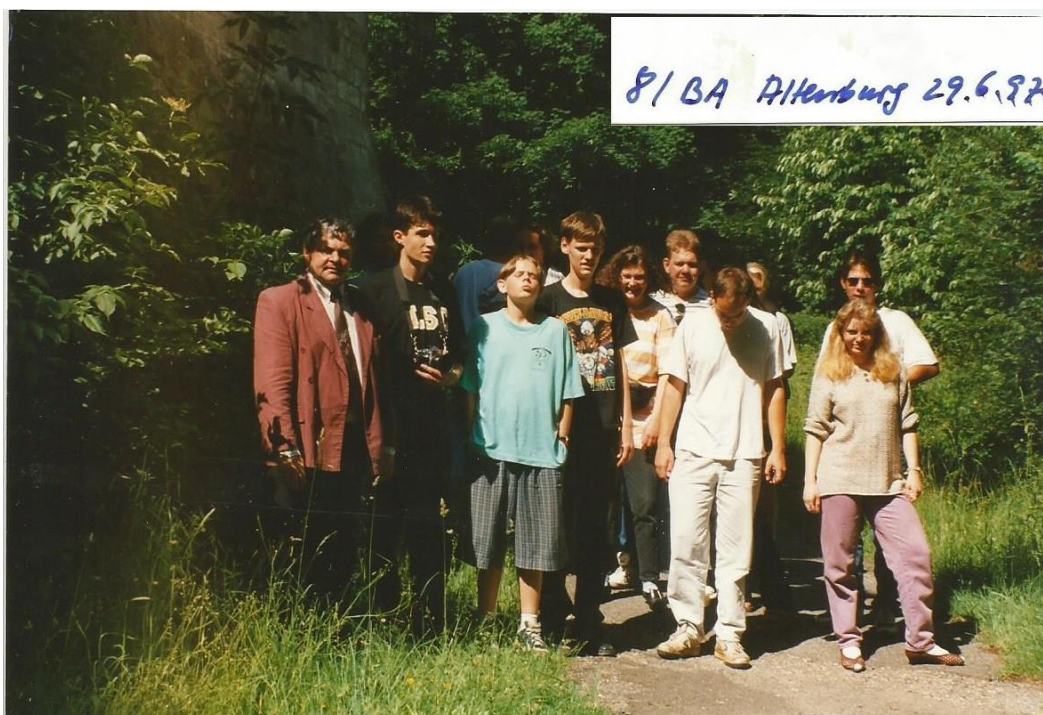
Příloha č. 7: Zájezd DOM do německého Altenburgu, dne 29. 6. 1997.