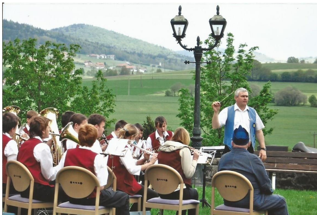
Příloha č. 11: Koncert DOM v Neukirchenu, kousek od českých hranic, rok 2003.