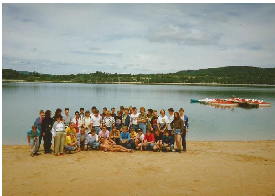
Příloha č. 8: Zájezd DOM do francouzského města Poligny, rok 1995.