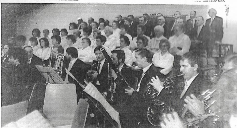
Einen Musikgenuß besonderer Art boten das Symphonische Orchester der Musikschule Klattau (Vordergrund) und die Chorgemeinschaft Wörth/Roding. Die 100 Zuhörer belohnten das zweistündige Konzert mit langanhaltendem Beifall.