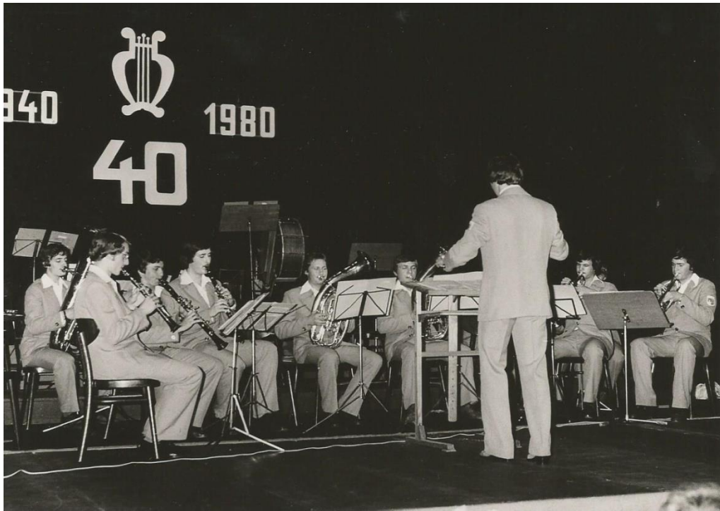
Příloha č. 3: Malá dechovka při výročním koncertu založení ZUŠ Josefa Klíčky v Klatovech, rok 1980.