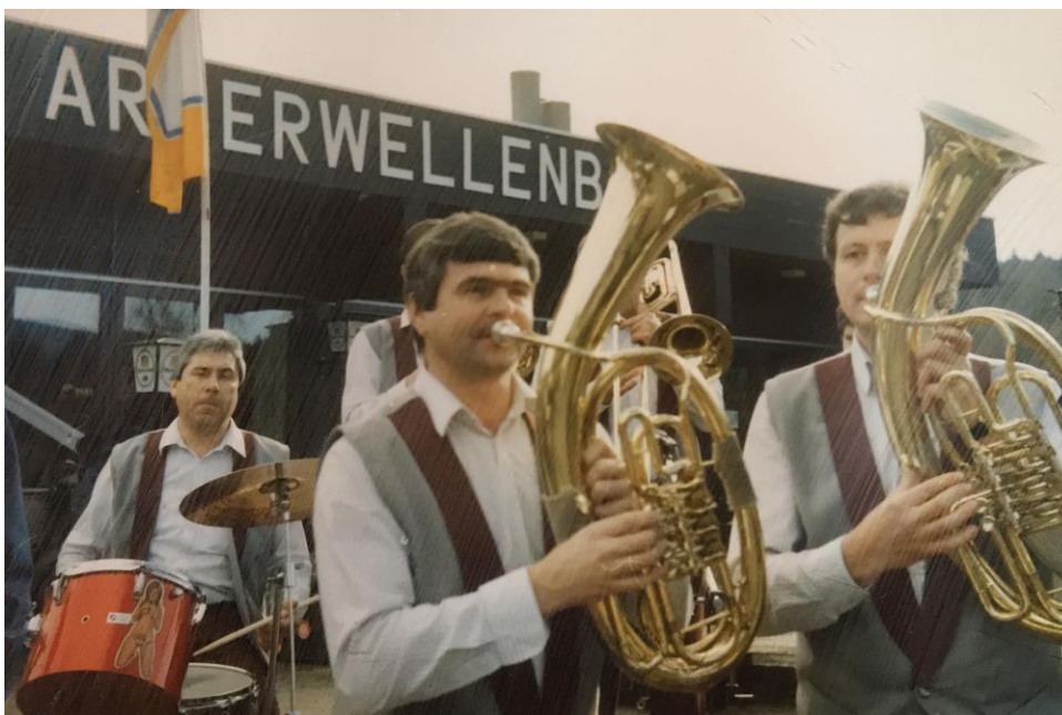
Příloha č. 27: Koncert Borovanky k otevření hranic v Bavorské Rudě, rok 1990.