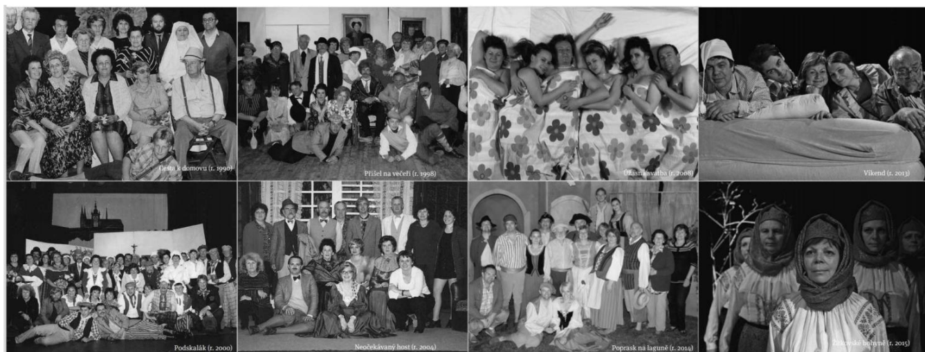
Obrázek 24: Fotografie z různých divadelních her spolku Tyjatr. (Zdroj: Almanach divadelního souboru Tyjatr ke 170. výročí jeho založení.)