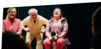
Obrázek 21: Program k uvedené hře divadelního spolku Tyl z Hartmanic – 3. část.

Premiéra: DK Hartmanice 2.3.2018 v 19:30