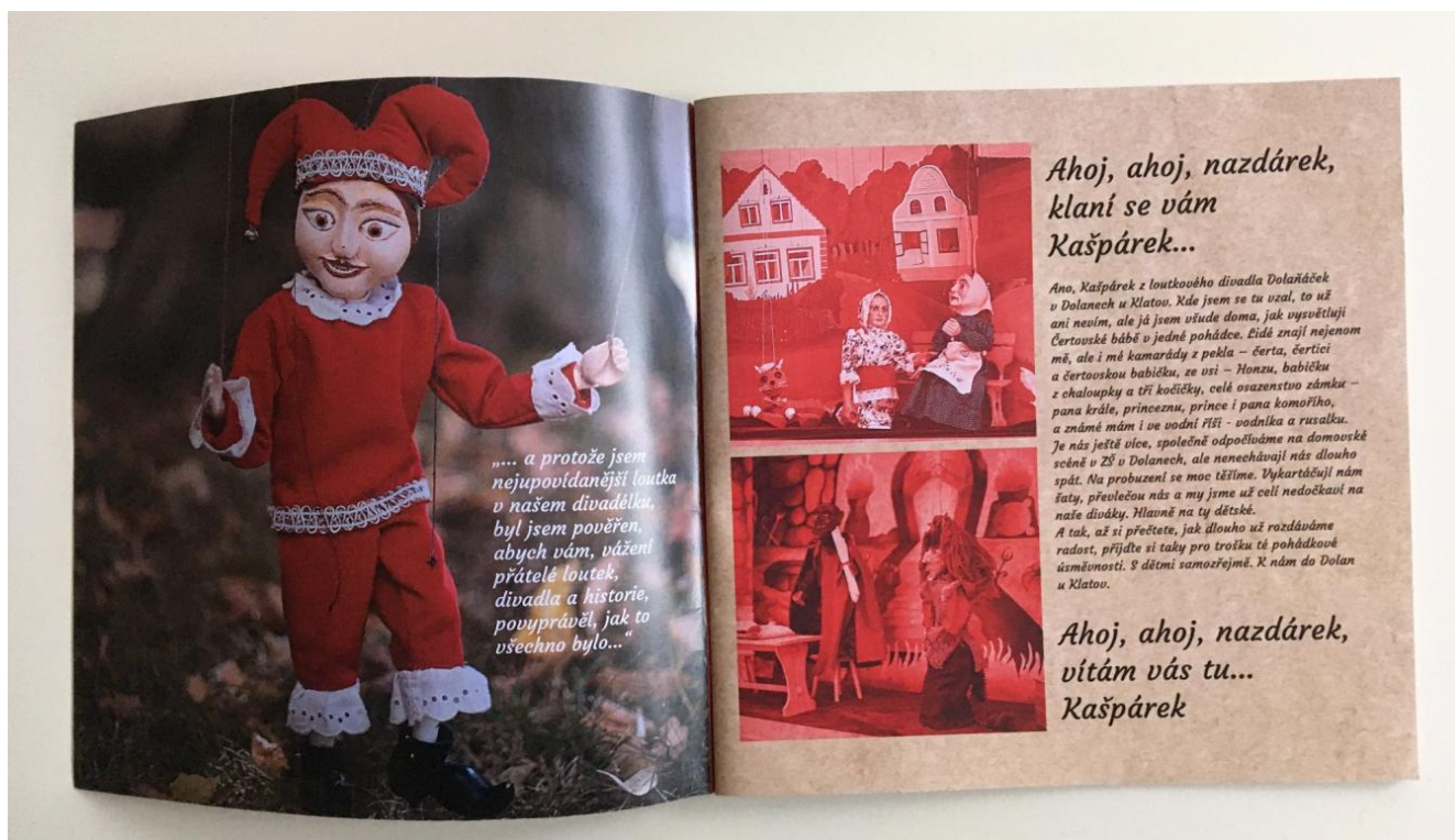
Obrázek 43: Ukázka z Almanachu loutkohereckého souboru Dolaňáček.