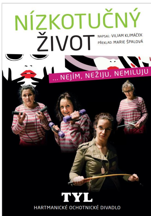
Obrázek 19: Program k uvedené hře divadelního spolku Tyl z Hartmanic – 1. část.