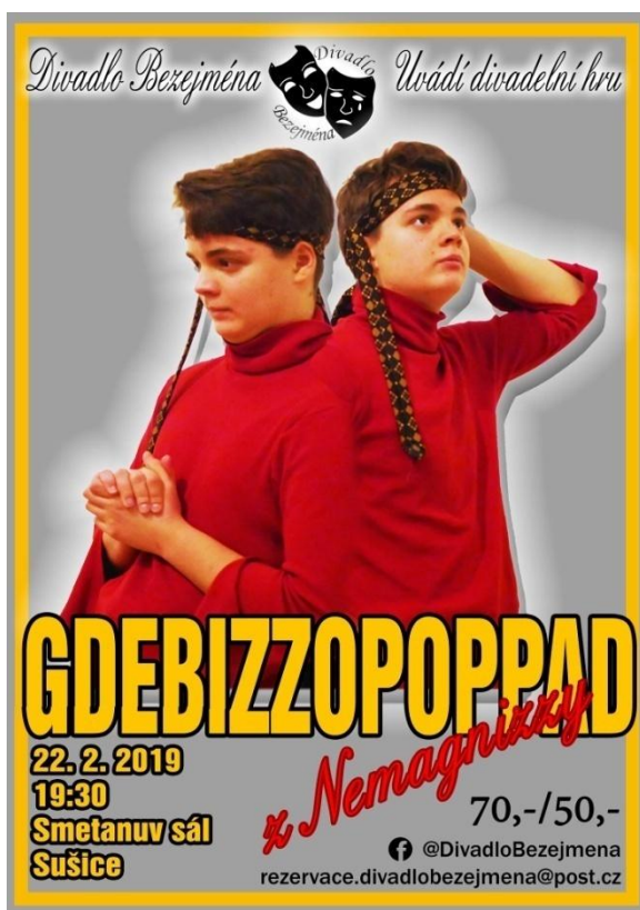
Obrázek 5: Plakát Divadla Bezejména.