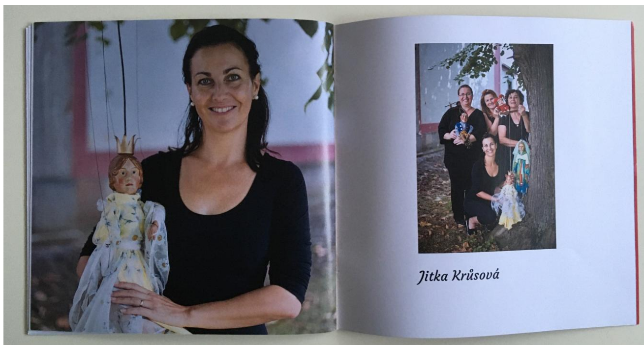
Obrázek 45: Členky loutkohereckého souboru Dolaňáček.