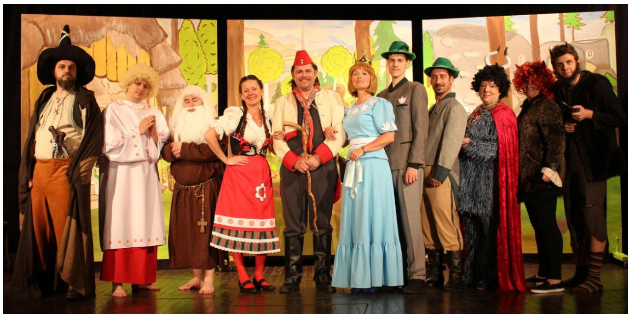
Obrázek 8: Hrátka s čertem – divadlo Schody.