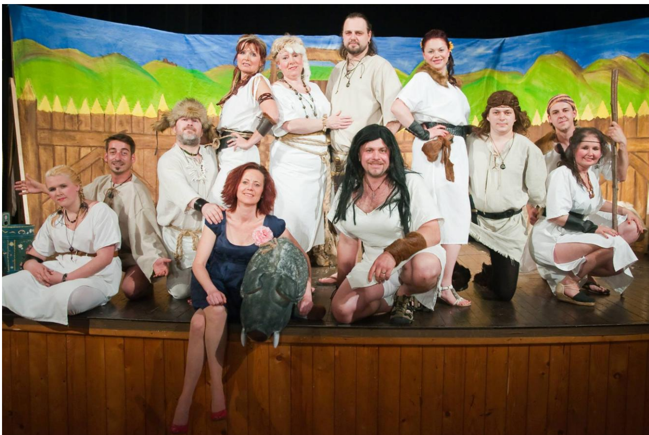
Obrázek 9: Dívčí válka – divadlo Schody.