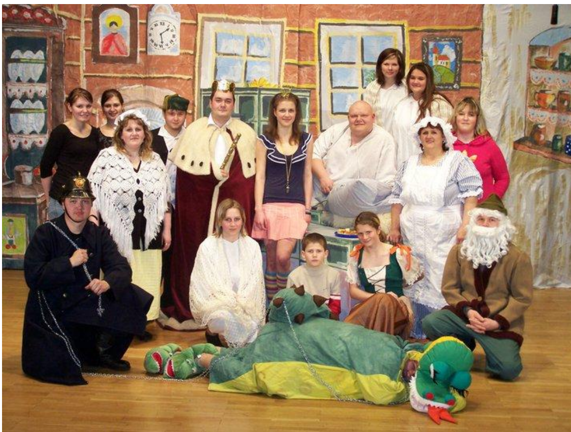
Obrázek 41: Spolek Úhlavan.