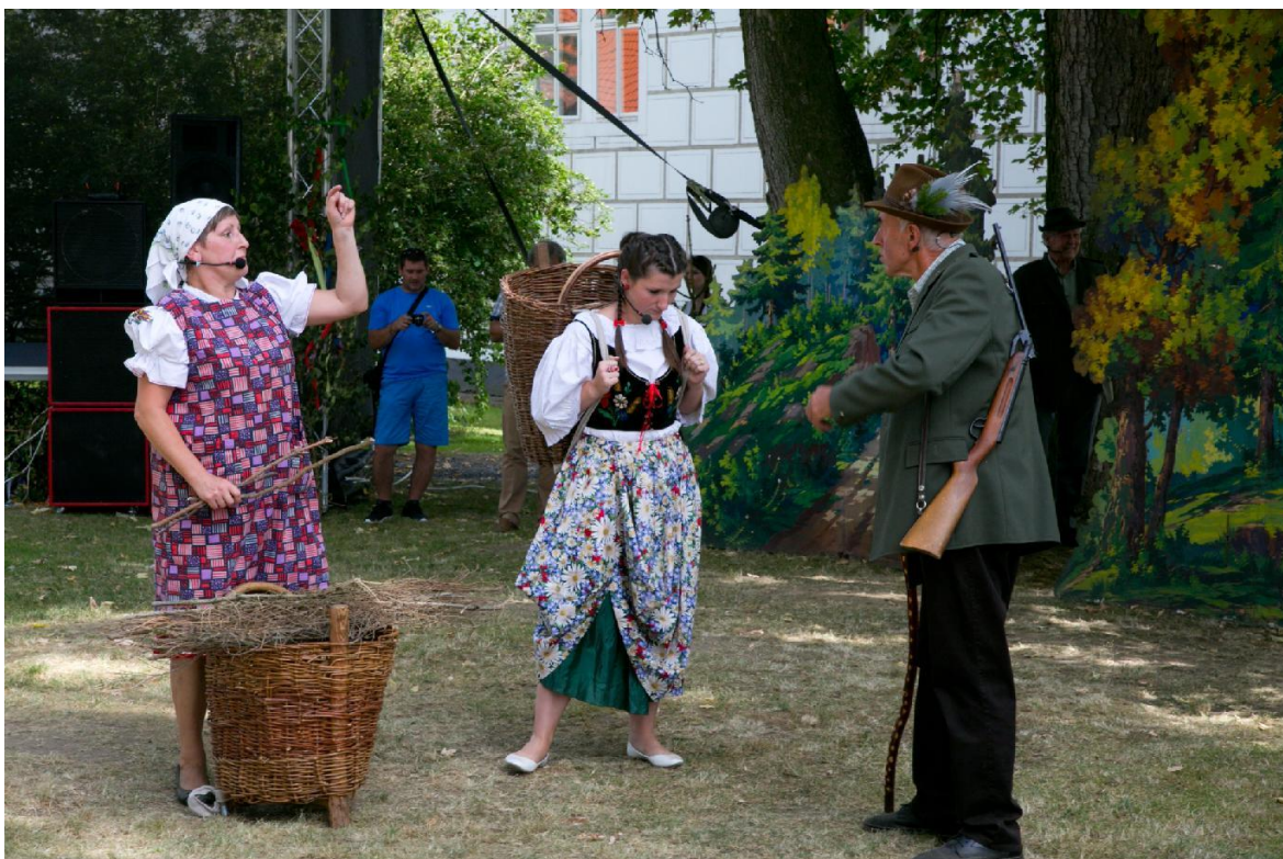
Obrázek 14: Divadelní představení Otavěnek.