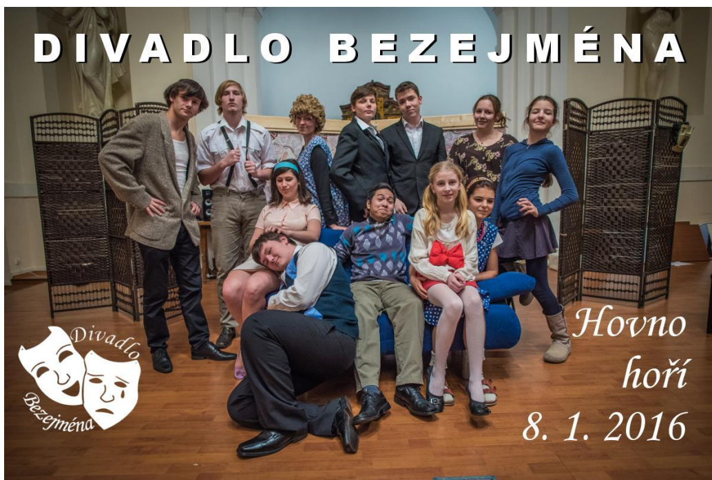
Obrázek 6: Společná fotka při představení Divadla Bezejména.