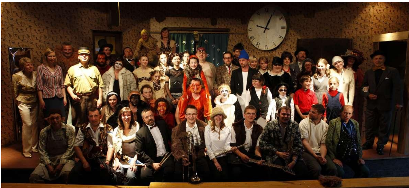
Obrázek 35: Fotografie z představení Malá opice.