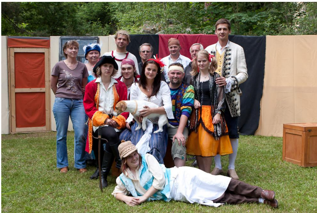
Obrázek 29: Břežanští ochotníci při hře Sluha dvou pánů.