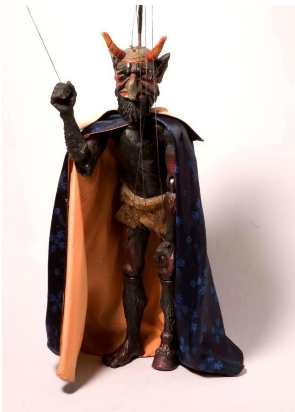
Obrázek 26: Ukázka horažďovických loutek – Lucifer. (Zdroj: Tyjáter Horažďovice: Dřevění členové. Tyjáter Horažďovice [online]. [cit. 2021-04-20]. Dostupné z: http://www.tyjatr.cz/dreveni-clenove.html )