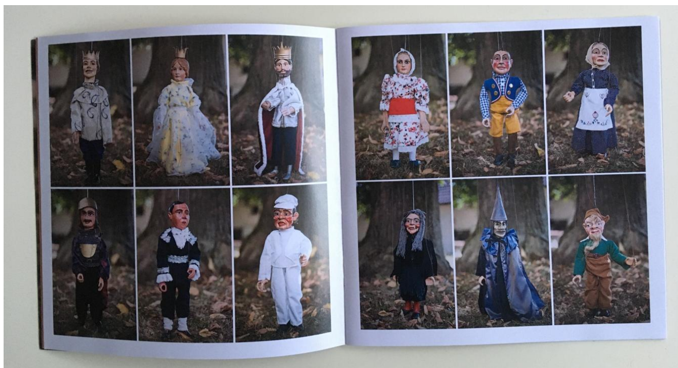
Obrázek 44: Ukázka loutek loutkohereckého souboru Dolaňáček.