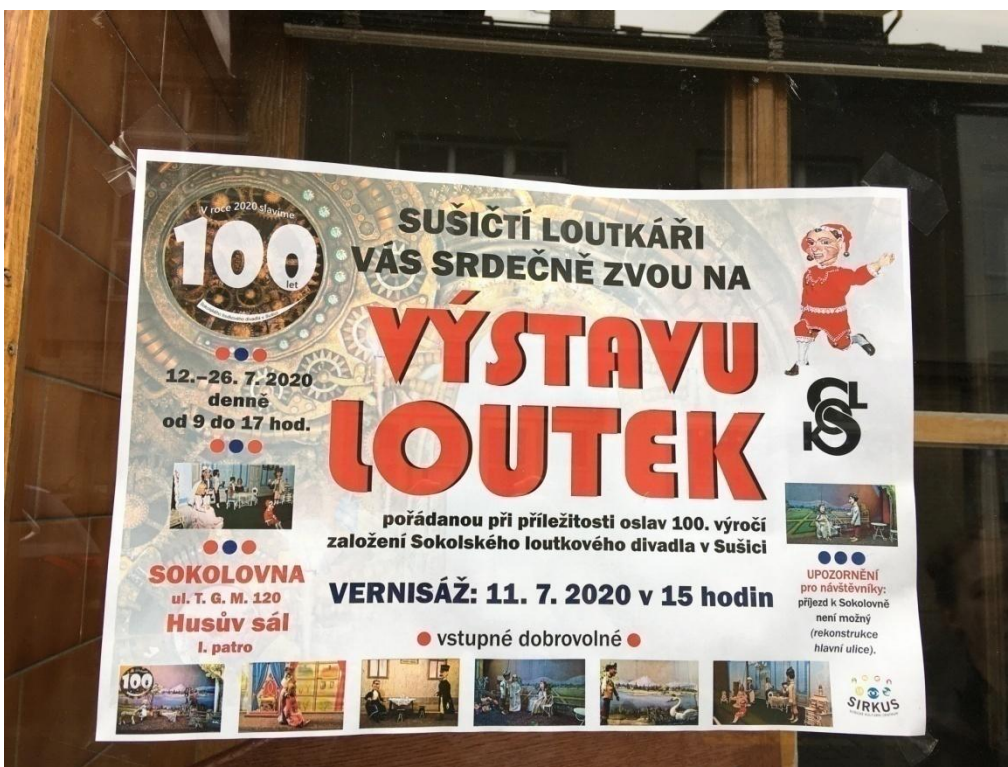
Obrázek 2: Plakát k příležitosti oslav 100 let loutkového divadla v Sušici.