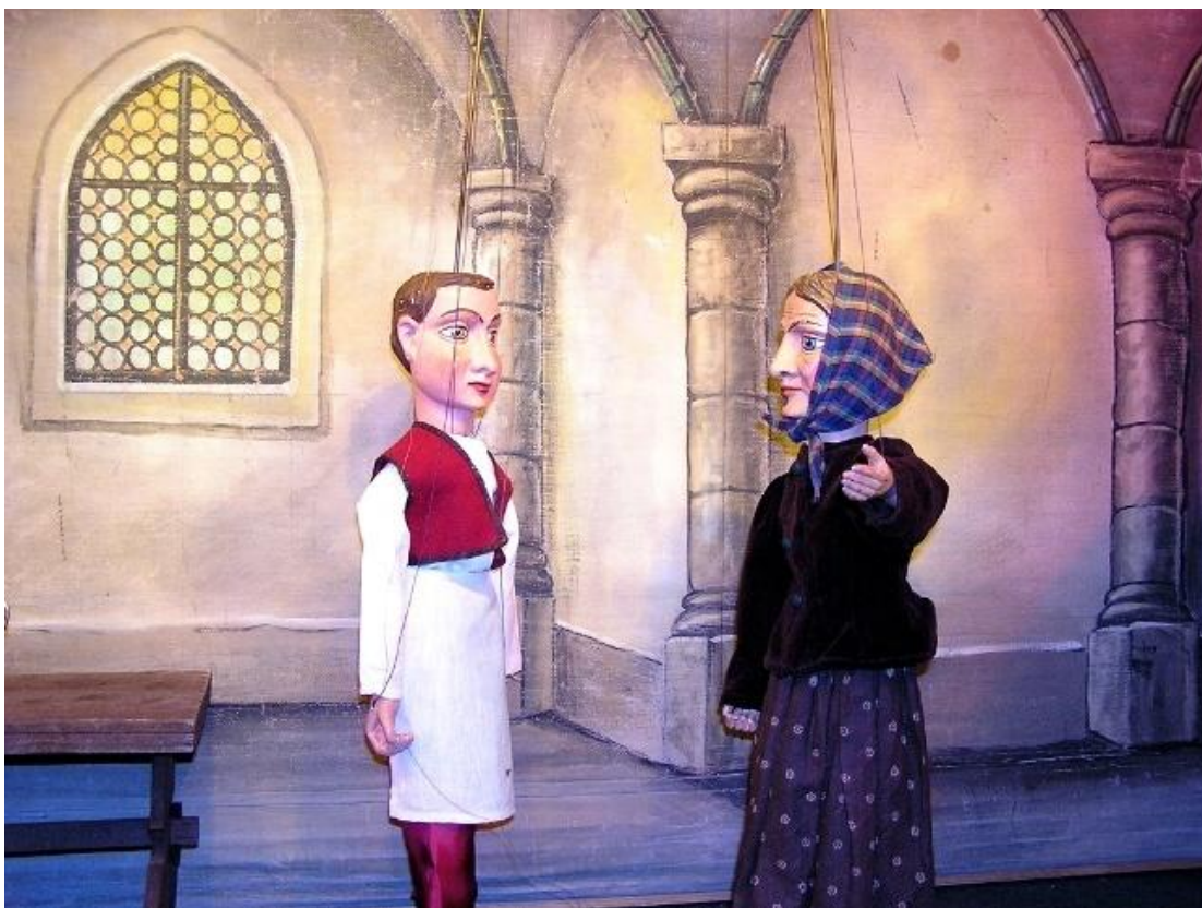
Obrázek 3: Ukázka loutek souboru Sokol Sušice.