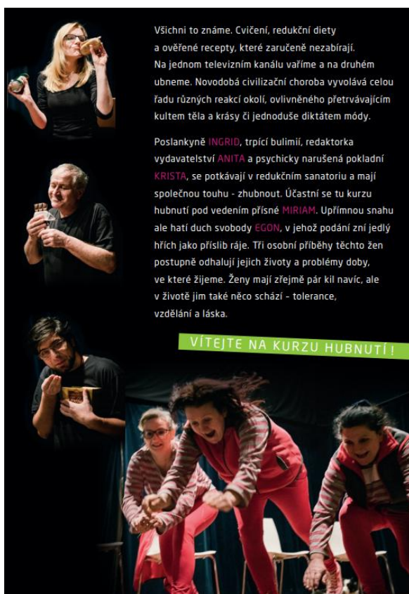
Obrázek 20: Program k uvedené hře divadelního spolku Tyl z Hartmanic – 2. část.