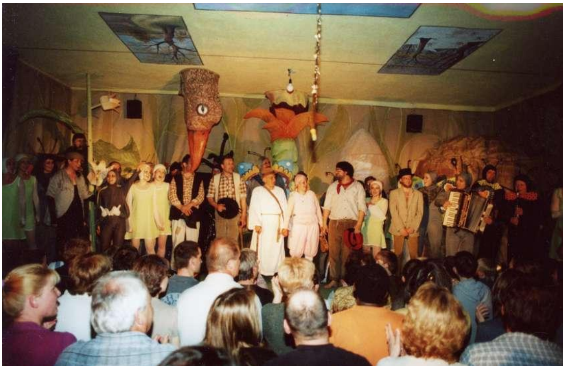
Obrázek 33: Fotografie z prvního představení obnoveného ochotnického spolku v Těchonících.