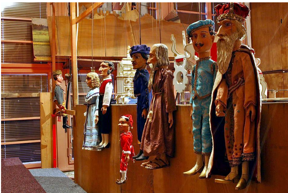
Obrázek 4: Ukázka loutek souboru Sokol Sušice.