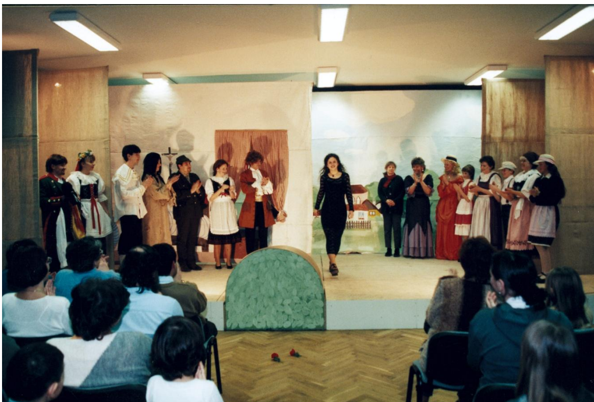
Obrázek 37: Fotografie z premiéry hry Babička po obnovení divadelní tradice v Plánici v roce 2003.