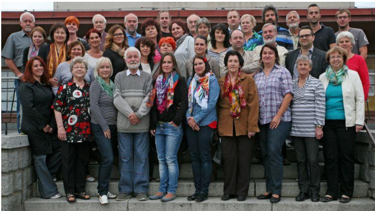
Obrázek 23: Společná fotografie všech členů horažďovického spolku Tyjatr.