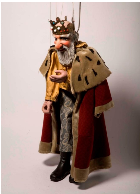
Obrázek 25: Ukázka horažďovických loutek – Král. (Zdroj: Tyjáter Horažďovice: Dřevění členové. Tyjáter Horažďovice [online]. [cit. 2021-04-20]. Dostupné z: http://www.tyjatr.cz/dreveni-clenove.html )