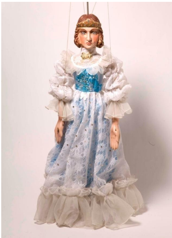
Obrázek 27: Ukázka horažďovických loutek – Princezna.