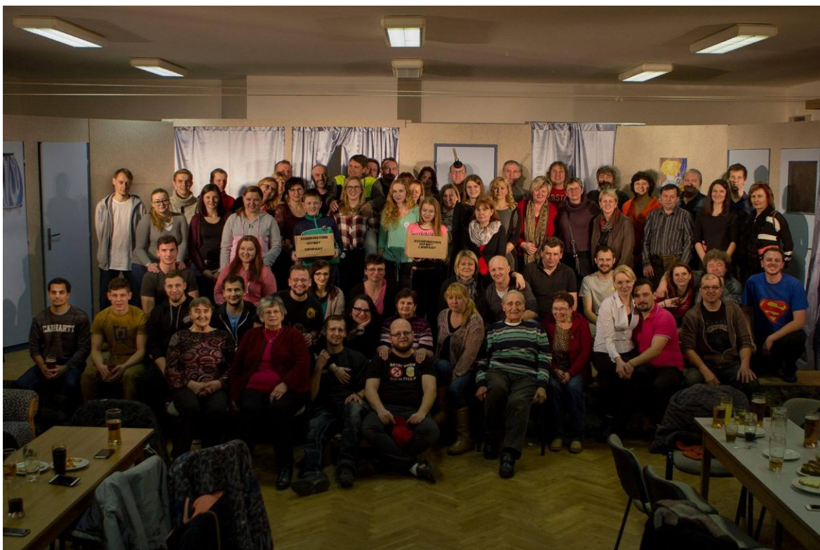
Obrázek 39: Členové Divadelního spolku Plánice se svými fanoušky.