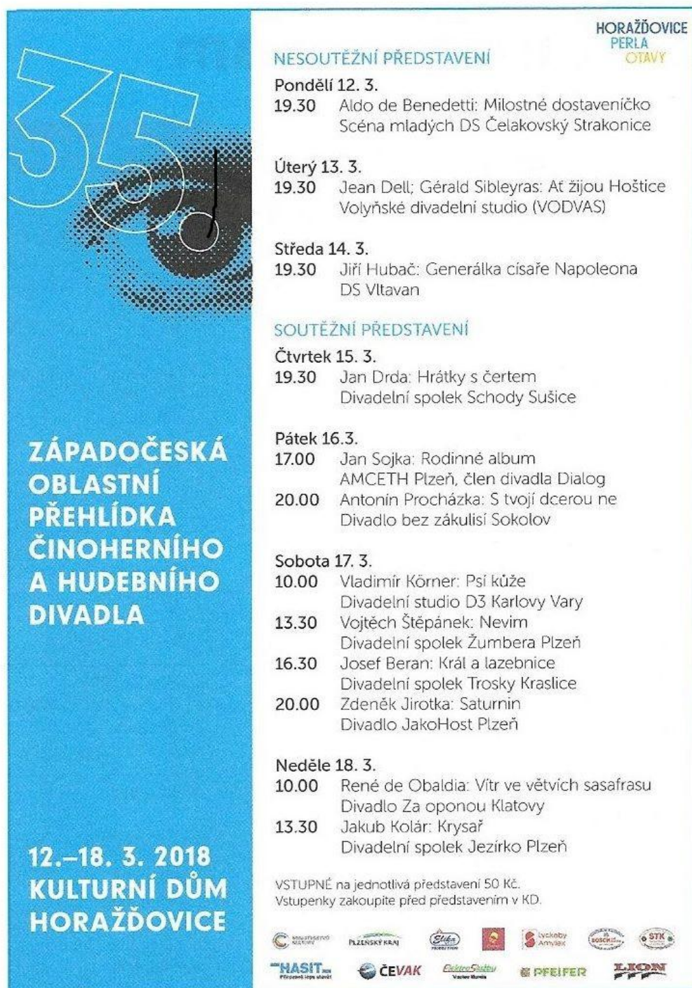
Obrázek 47: Scan programu západočeské přehlídky z roku 2018.