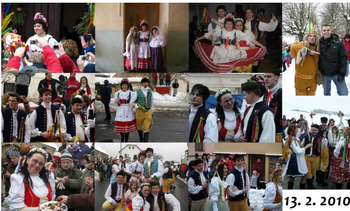
Obrázek 40: Staročeská svatba v Plánici.