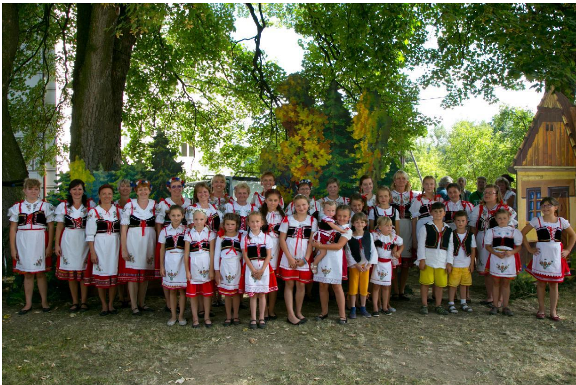
Obrázek 13: Otavěnký Žichovice.