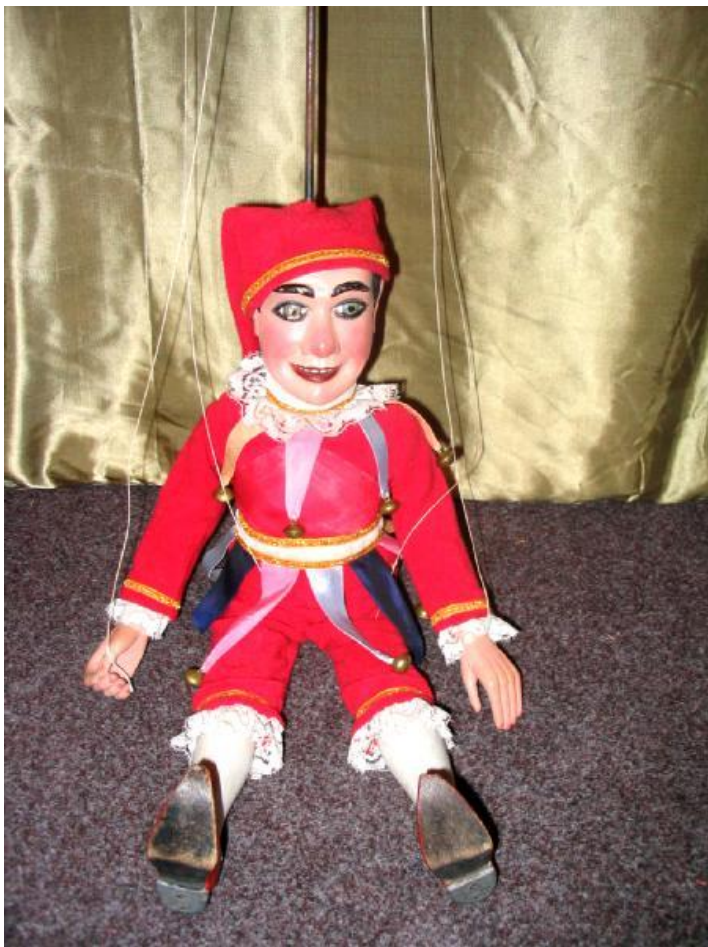
Obrázek 17: Ukázka žichovické loutky.