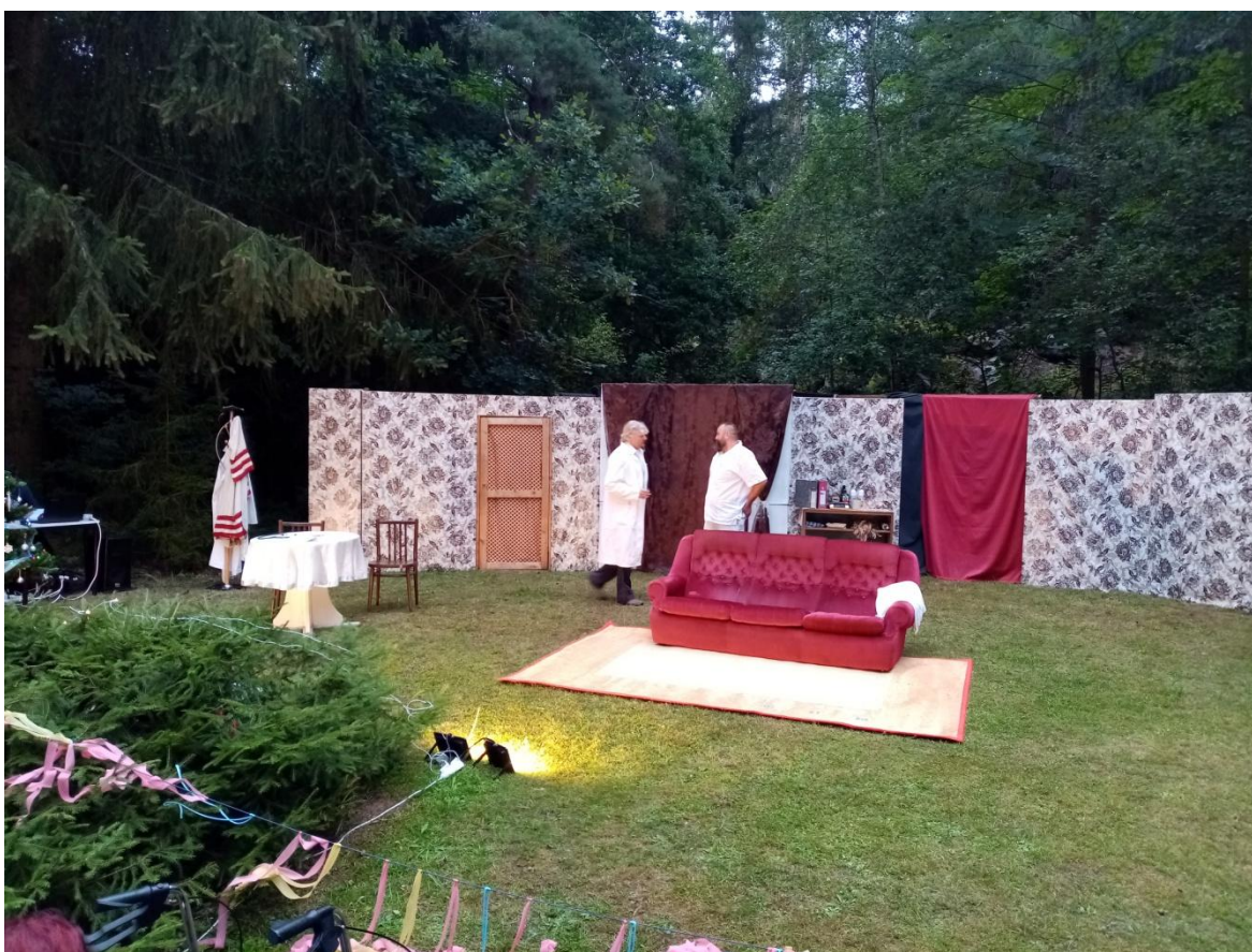
Obrázek 30: Pohled na kulisy a prostředí venkovního jeviště U Skály v Břežanech.