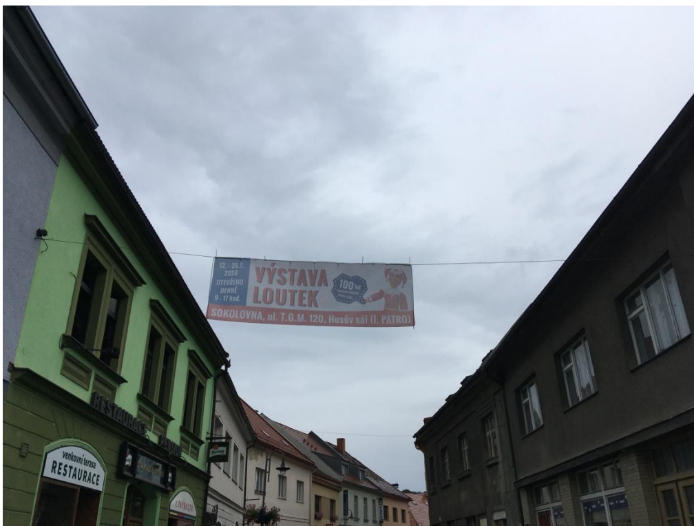
Obrázek 1: Transparent k příležitosti oslav 100 let loutkového divadla v Sušici.