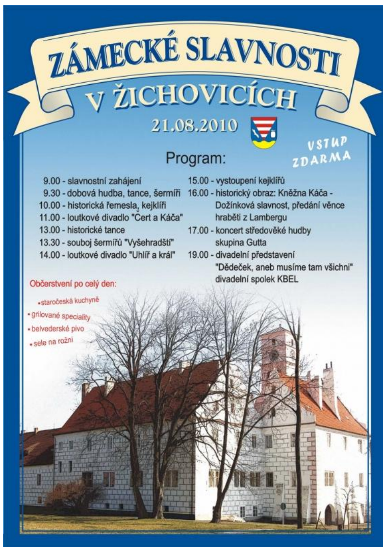
Obrázek 15: Plakát k prvním uspořádaným Zámeckým slavnostem.