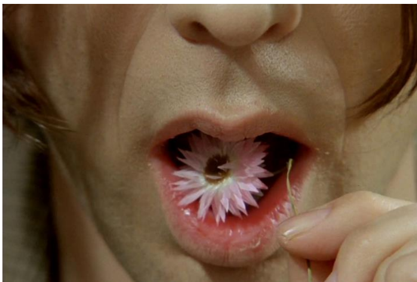
Obr. 1 Jídlo