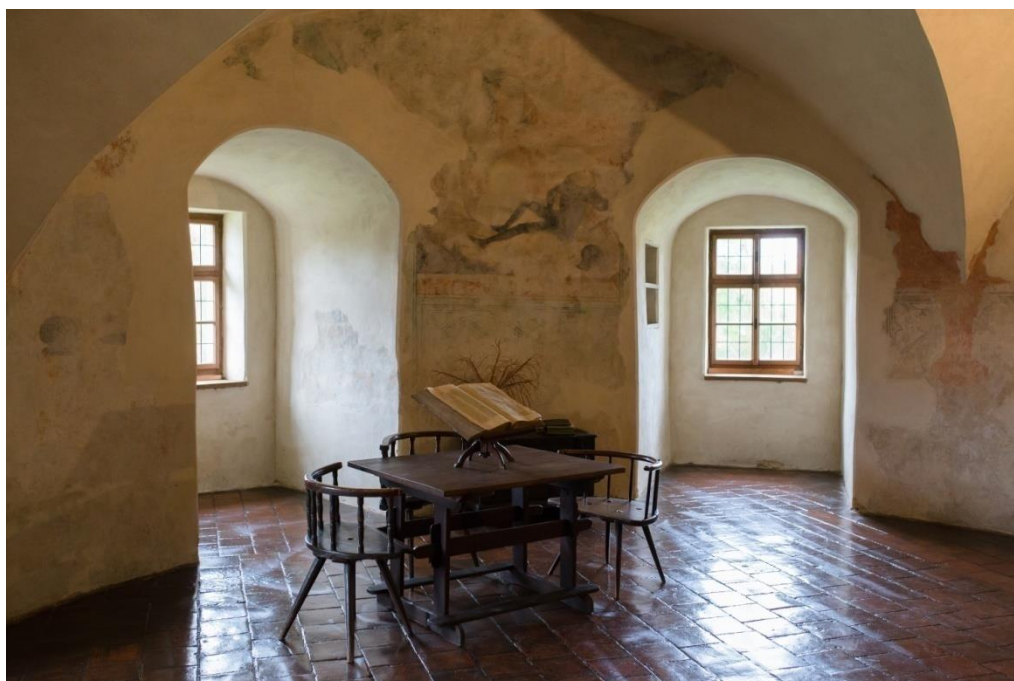
Obrázek č. 20: Červená bašta [online].