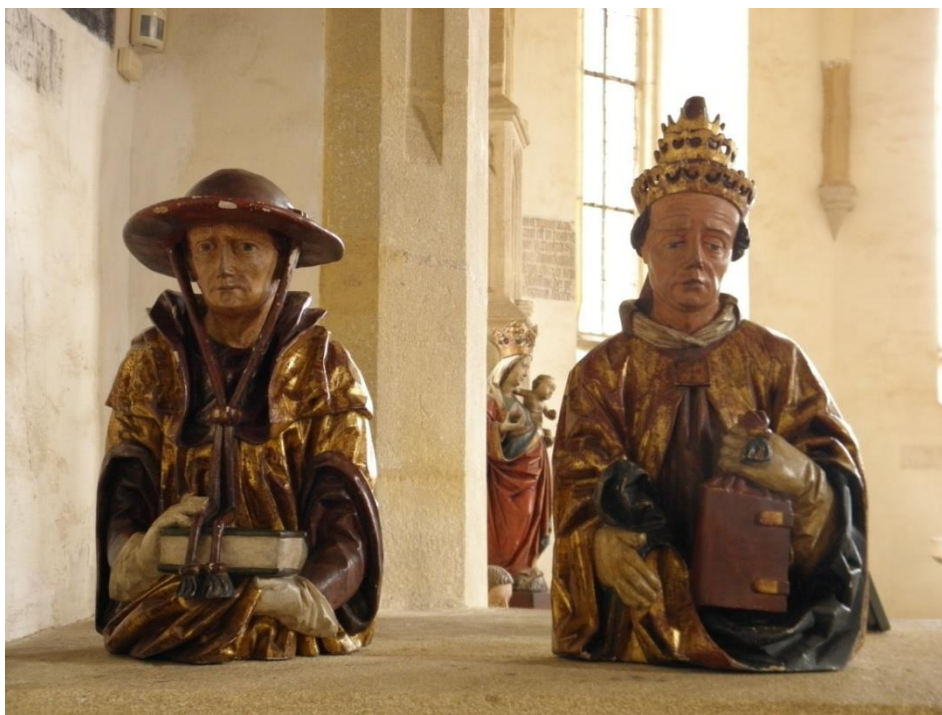
Obrázek č. 19: Církevní otcové v hradní kapli. Vzadu lze vidět Pannu Marii s Ježíškem [online].