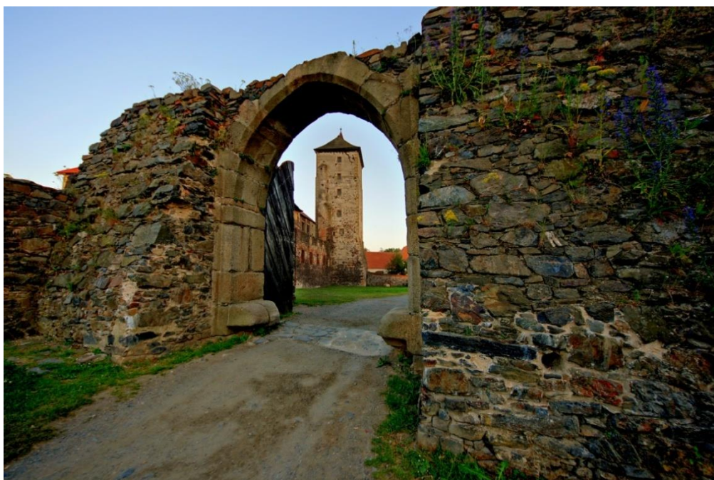
Obrázek č. 14: Vstupní brána [online].