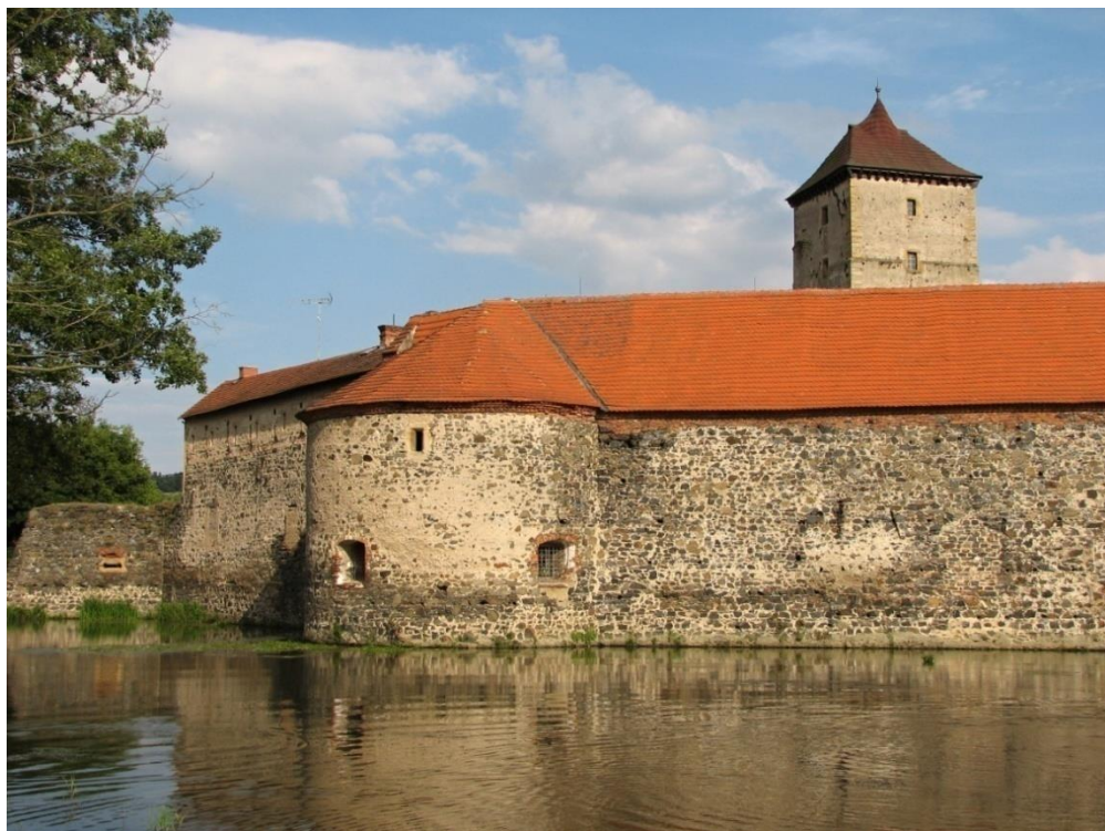
Obrázek č. 13: Vodní příkop [online].