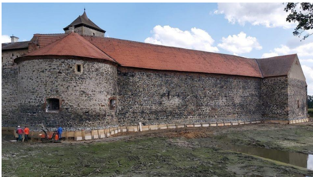
Obrázek č. 29: Vypuštěný vodní příkop [online].