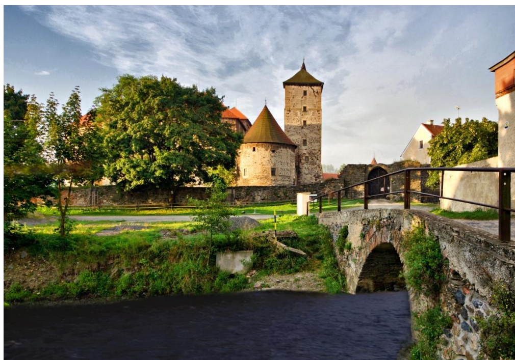
Obrázek č. 12: Příchod k hradu přes lávku [online].