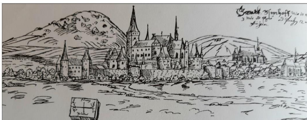
Obrázek č. 7: Švihov. Hrad na počátku 17. století na kresbě Jana Willenberka. Zdroj: DURDÍK, Tomáš. Ilustrovaná encyklopedie českých hradů , s. 546.