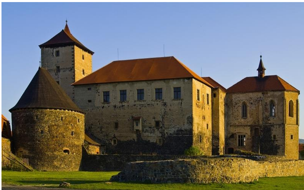
Obrázek č. 11: Hrad Švihov z pohledu od jihovýchodu. Hradní kaple [online].