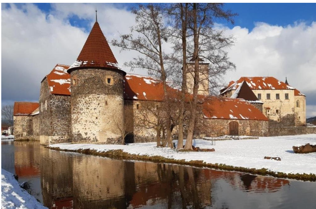
Obrázek č. 21: Věž Kašperka.