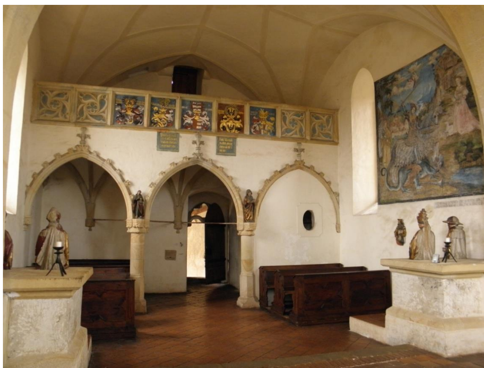
Obrázek č. 18: Hradní kaple Panny Marie. Nástěnná malba v hradní kapli je na fotografii zobrazená vpravo [online].