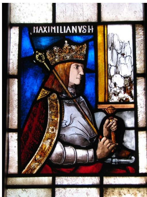
Obrázek č. 25: Vitráž na schodišti [online].