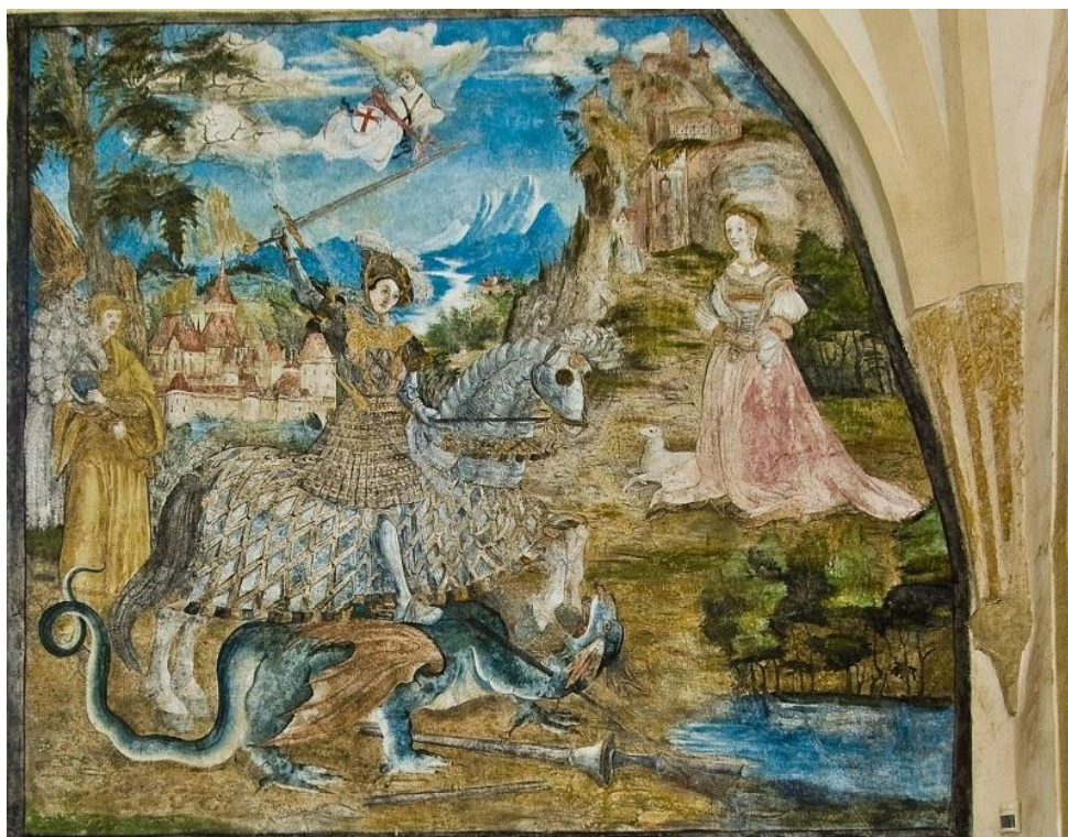
Obrázek č. 19: Nástěnná malba v hradní kapli s vyobrazením sv. Jiří [online].