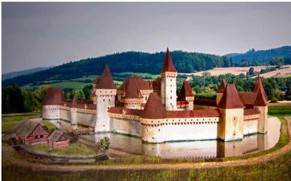
Obrázek č. 6: Švihov. Simulace původní podoby hradu Švihov [online].