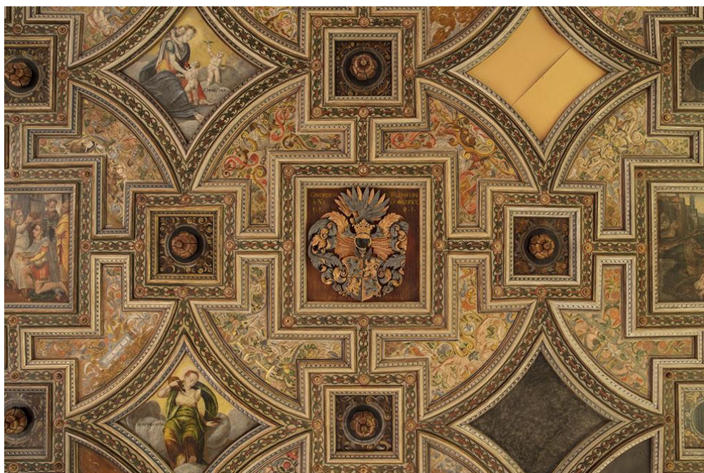
Obrázek č. 22: Valdštejnský renesanční strop ze zámku v Dobrušce [online].