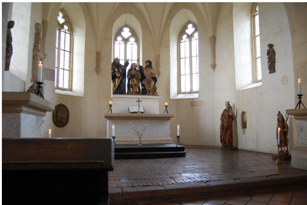
Obrázek č. 17: Hradní kaple Panny Marie [online].