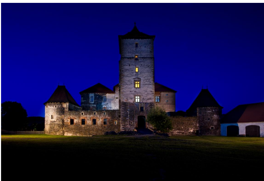
Obrázek č. 16: Hrad Švihov na noční fotografii [online].