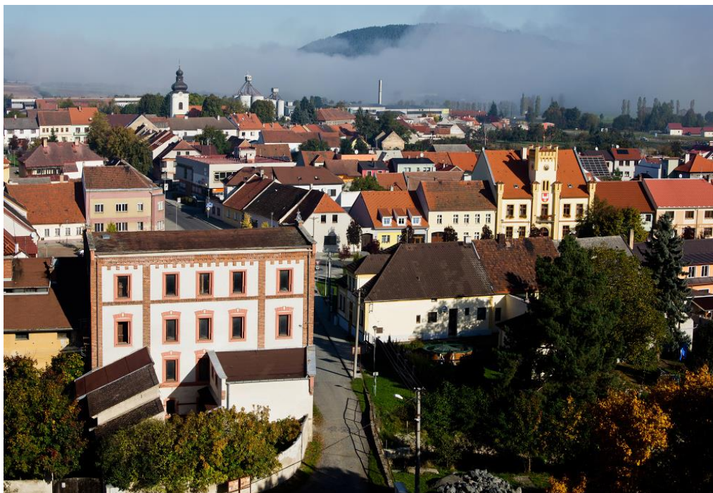
Obrázek č. 4: Město Švihov; pohled z hradní věže [online].