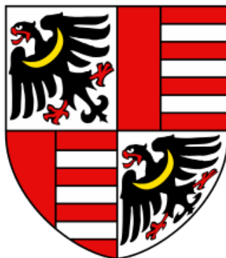
Obrázek č. 8: Erb – Švihovští z Rýzemberka [online].