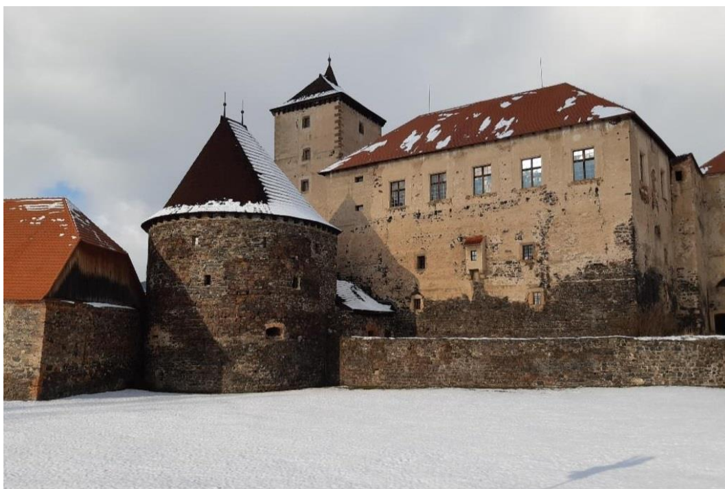
Obrázek č. 30: Hrad Švihov v zimě.