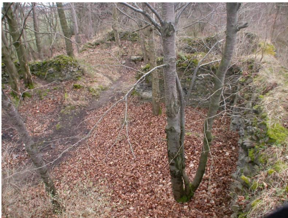
Obrázek č. 19: Zřícenina tvrze Kokšínský hrádek [online]. Zdroj: https://pamatkovykatalog.cz/zricenina-tvrze-koksinsky-hradek-14900671