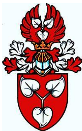
Obrázek č. 9: Erb – Páni z Říčan (Říčanští) [online].