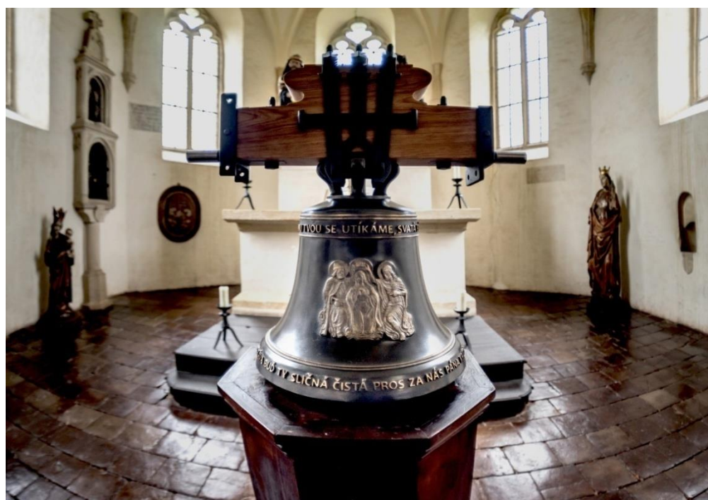
Obrázek č. 24: Nový zvon pro hradní kapli Panny Marie [online].