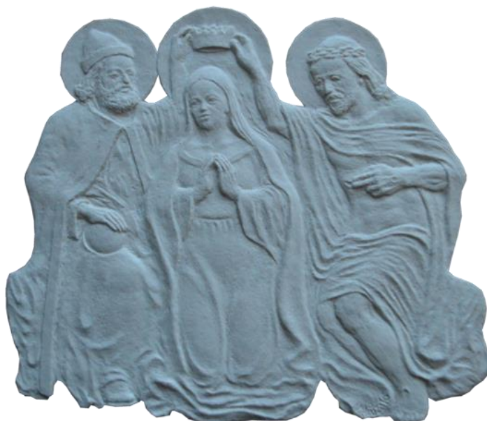
Obrázek č. 28: Reliéf nového zvonu v hradní kapli – korunovace Panny Marie [online]. Zdroj: https://www.hrad-svihov.cz/cs/cs/fotogalerie/11364-jak-vypada-svihovsky-hrad-zevnitr