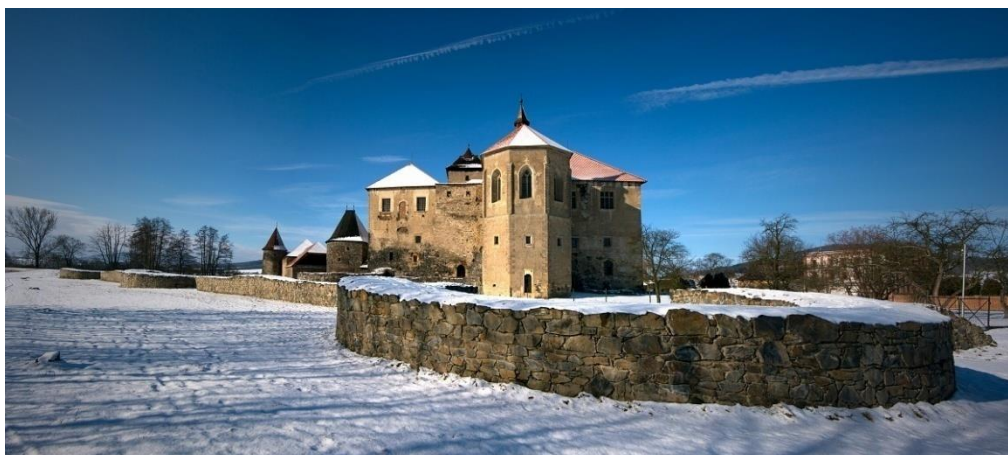
Obrázek č. 15: Vnější opevnění z východní strany [online].