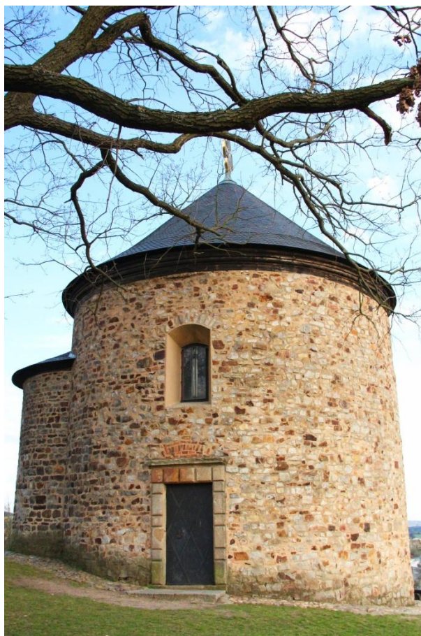
obr. 7 – Rotunda sv. Petra a Pavla je jednou z nejstarších památek na území České republiky. Byla součástí centra staroplzeňského hradiště zvaného Hůrka.

Starý Plzenec jsem navštívila 10. dubna 2020. Hilarius Litoměřický toto město zmiňuje v souvislosti se založením Nové Plzně. Právě od Starého Plzeňce získala na základě odvolacího práva Plzeň své jméno.