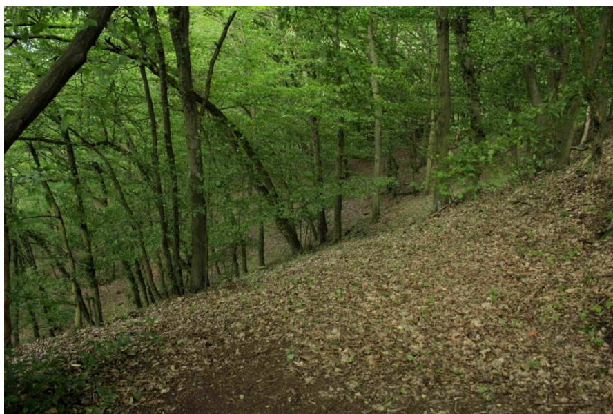
obr. 7 – Pohled na nejvýše položené části Bukovce. Vysoký terén byl pro vznik hradiště ideální.