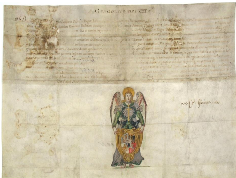
obr. 14 – První barevné vyobrazení plzeňského znaku na listině papeže Řehoře XIII. z roku 1578. Tento papež do znaku přidal trojvrší s křížkem a nápisem In hoc signo vinces , dvě helmy, halapartnu a buzikán.