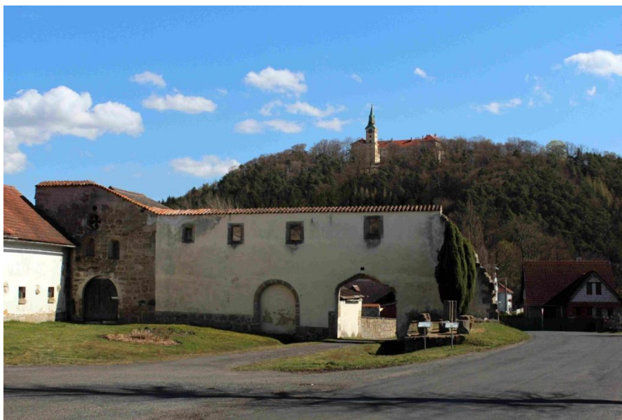
obr. 12 – Pohled na Zámek Zelená Hora z obce Klášter.