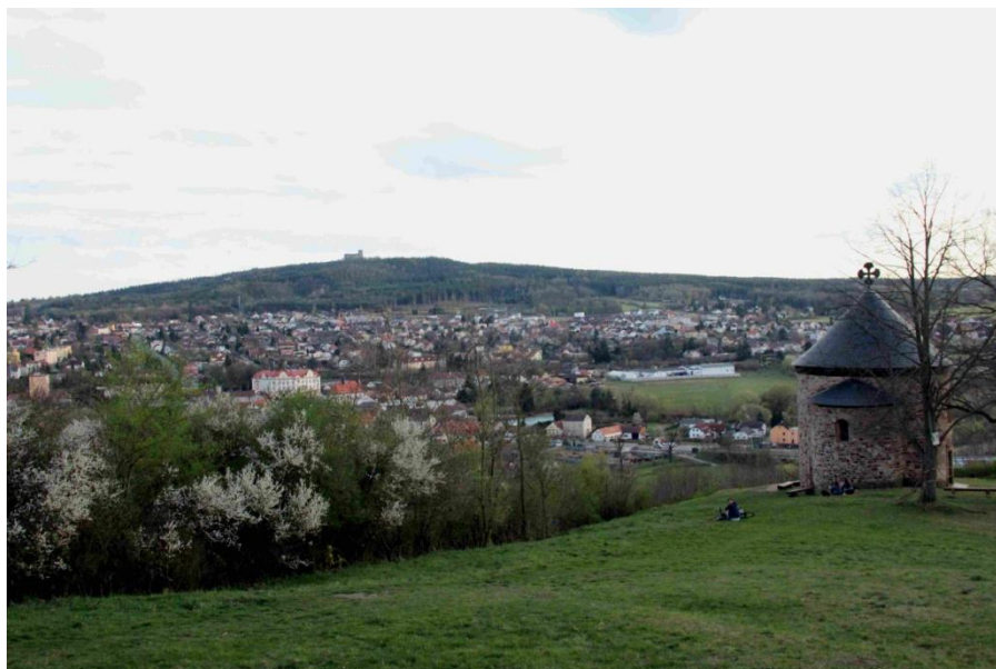
obr. 9 – Rotunda sv. Petra a Pavla je dominantou Starého Plzeňce. O tomto městě se kromě Hilaria Litoměřického zmiňují také Dětmár z Mersenbukru nebo Bruno z Querfurtu.