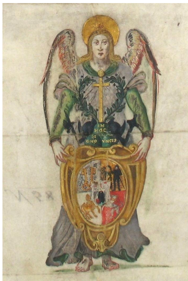
obr. 15 – Detail plzeňského znaku z papežské listiny.