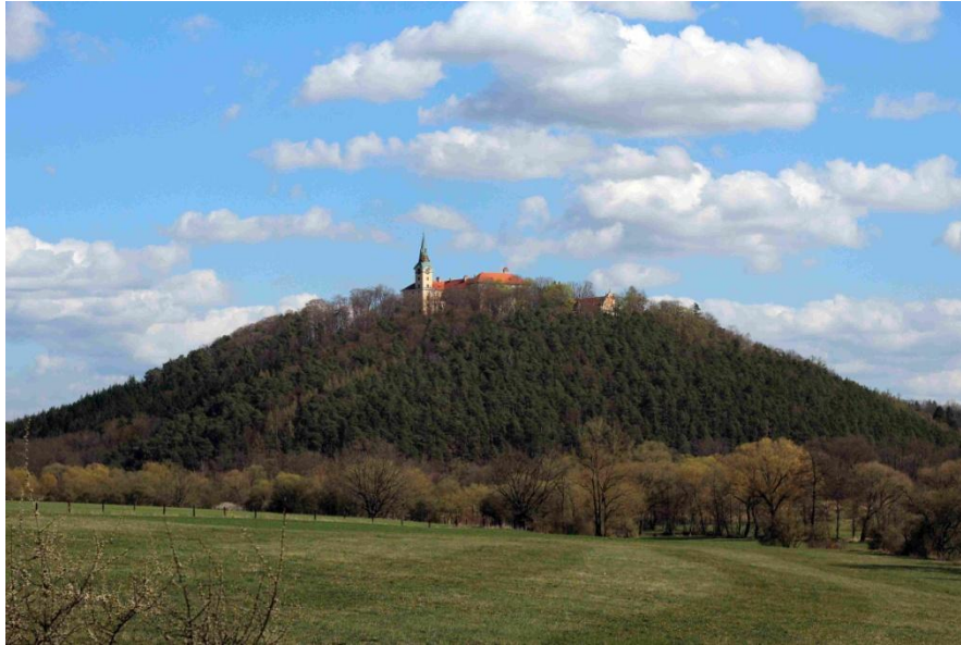
obr. 10 – Pohled na zámek Zelená Hora ležící na severní straně nad Nepomukem. Jeho majitelem byl ve 2. polovině 15. století Zdeněk ze Šternberka. Formovala se zde tzv. zelenohorská jednota, která vystupovala proti králi Jiřímu z Poděbrad.

Zámek Zelená Hora, který se nachází u Nepomuku, jsem navštívila ve stejný den jako Starý Plzenec, tedy 10. dubna 2020. Zelená Hora už nesouvisí s pobytem Hilaria Litoměřického v Plzni, ale s tzv. zelenohorskou jednotou.