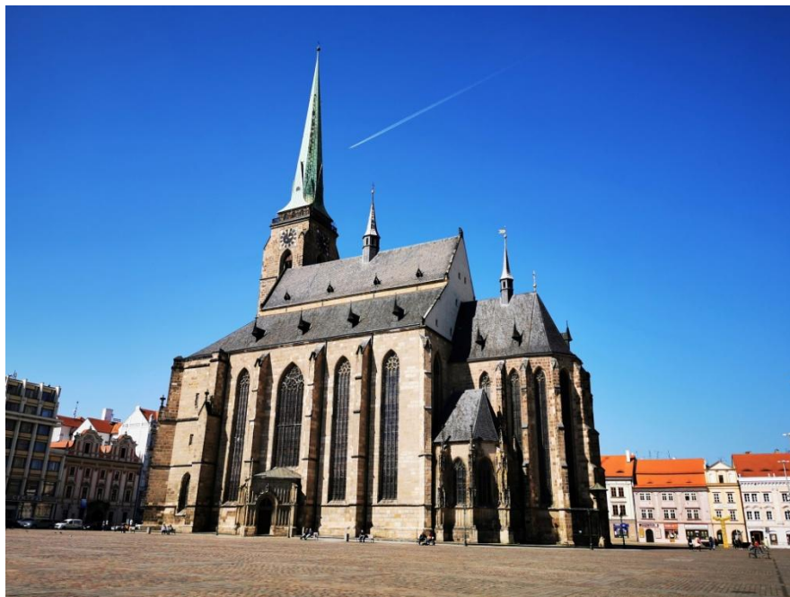
obr. 1 – Pohled na katedrálu sv. Bartoloměje v Plzni.

Katedrálu sv. Bartoloměje na náměstí v Plzni jsem navštívila 4. června 2021, krátce po jejím znovuotevření. Na tomto místě Hilarius mezi léty 1467 – 1468 kázal a přednesl tu mimo jiné i kázání Hystoria civitatis Plznensis . V největší pravděpodobnosti byl do roku 1919 v katedrále pochován.