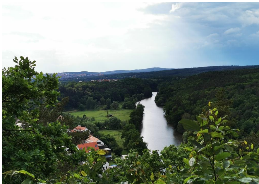
obr. 6 – Výhled z Holého vrchu na Bukovec a řeku Berounku. V pozadí se nachází Bílá Hora, Chlumek, Bolevec a Košutka.