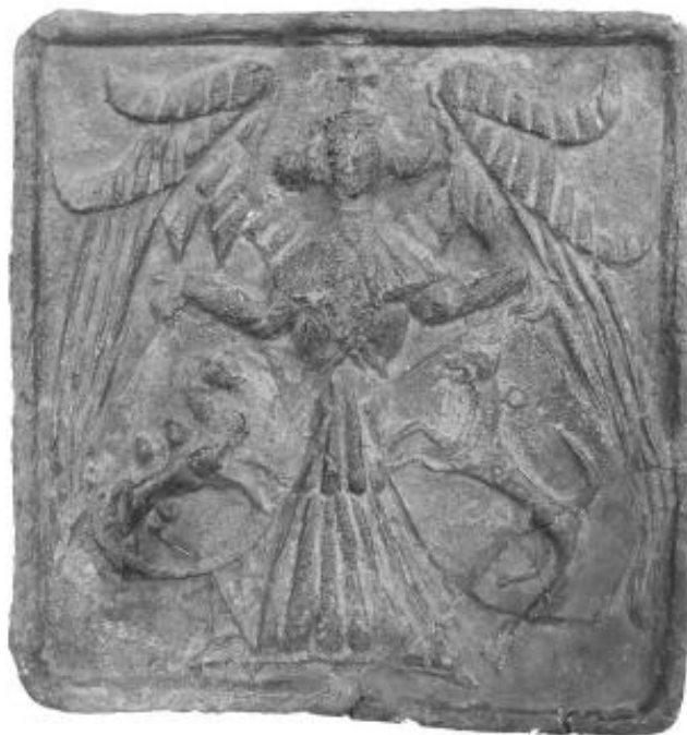
obr. 13 – Komorový kachel s andělem nesoucím částí plzeňského znaku. Plzeň, 1434–1466.

Na závěr přílohy přikládám nejstarší vyobrazení plzeňského znaku z 15. a 16. století.