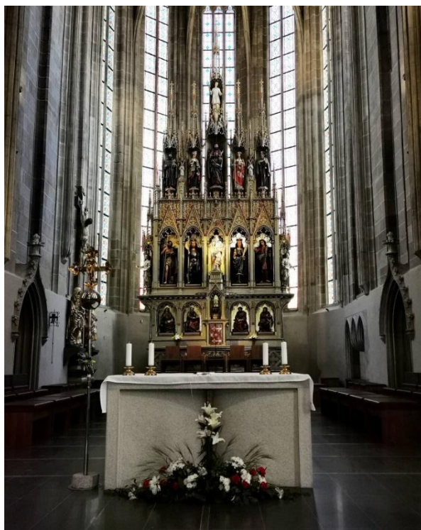
obr. 2 – Pohled na presbytář (kněžiště) v katedrále sv. Bartoloměje.