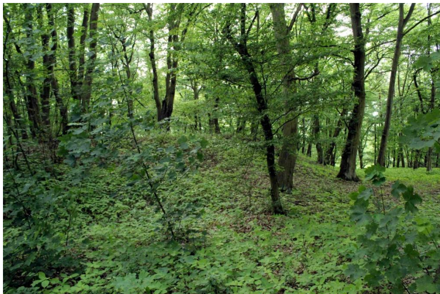
obr. 5 – Pohled na opevnění jádra hradiště.