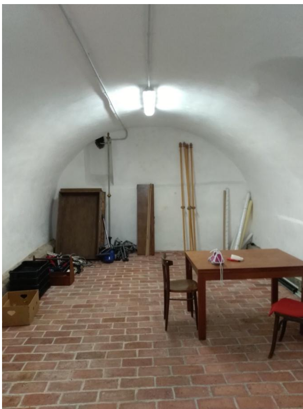
obr. 3 – Krypta, v níž byl Hilarius Litoměřický pohřben. Aktuálně slouží jako depozitář.