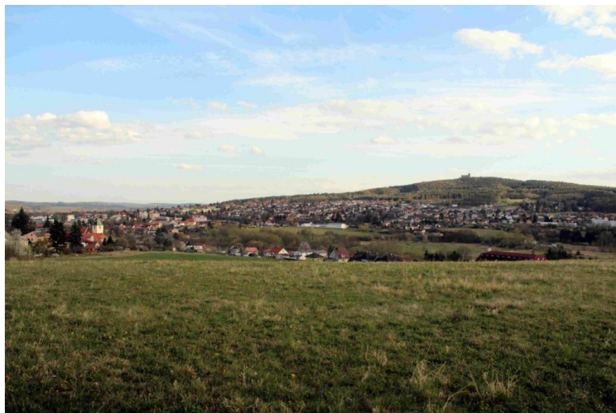
obr. 8 – Pohled na Starý Plzeňec. Směrem doleva vede cesta k zaniklému staroplzeňskému hradišti Hůrka. Nalevo v pozadí můžeme vidět Kostel Narození Panny Marie a napravo hrad Karlova koruna, známý též jako Radyně.