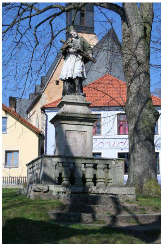
Obr. č. 23: Sousoší sv. Jana Nepomuckého, Rožmitál na Šumavě