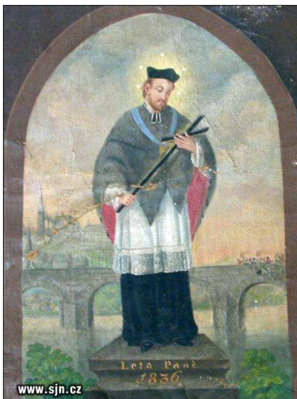
Obr. č. 13: Sv. Jan ukazuje na paprsku z nebes svůj rodný dům, Karel Škréta