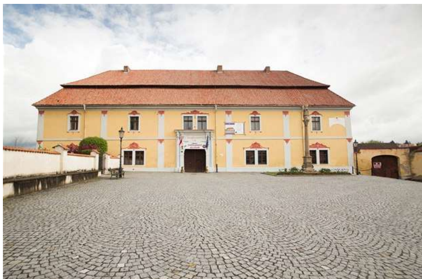
Obr. č. 25: Svatojánské muzeum v Nepomuku, v popředí dřevěná poutní socha sv. Jana