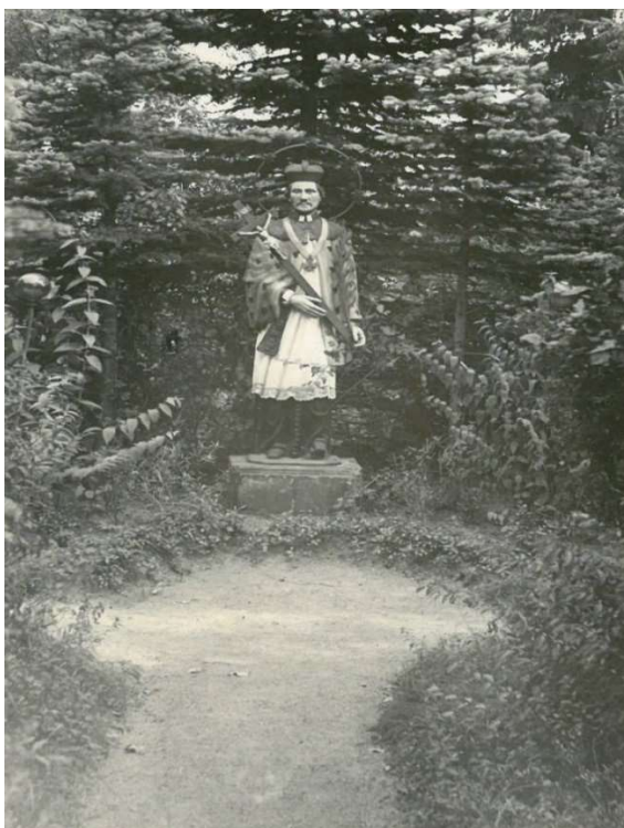
Obr. č. 17: Železolitina sv. Jana Nepomuckého objevená u býv. hřbitovní zdi zahrady Psychiatrické léčebny Lnáře v roce 2019