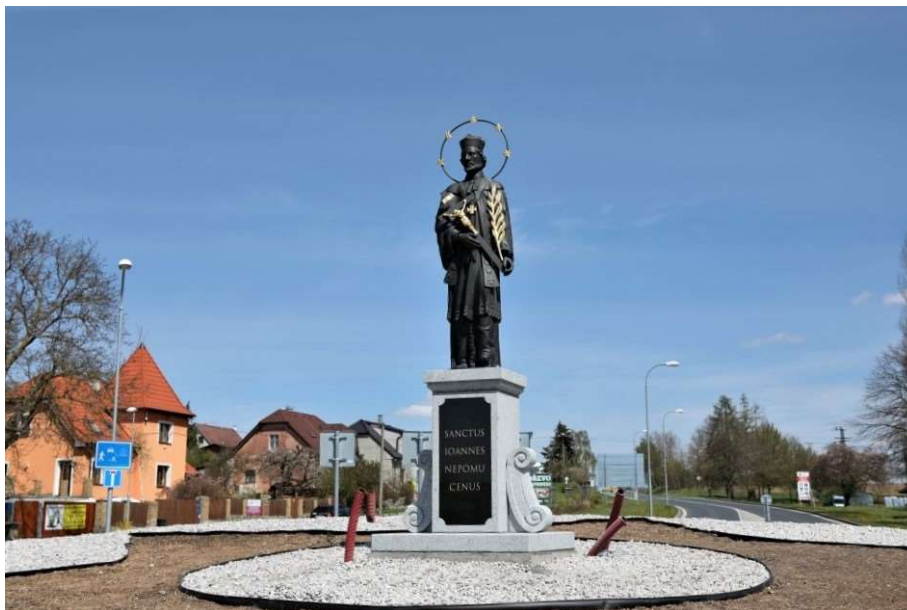
Obr. č. 19: Skleněná socha Jana Nepomuckého, Vladimíra Tesařová, Čepice