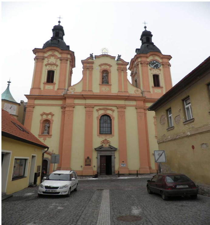
Obr. č. 1: Kostel sv. Jana Nepomuckého v obci Nepomuk