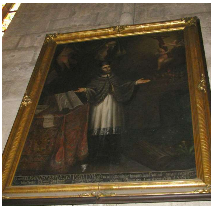
Obr. č. 11: Glorifikace svatého Jana Nepomuckého, kaple sv. Kříže, Praha