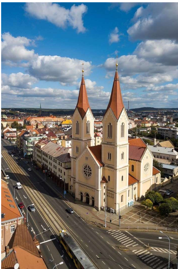
Obr. č. 3: Kostel sv. Jana Nepomuckého v Praze, Na Skalce