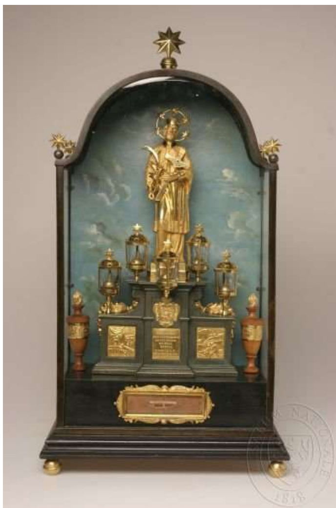
Obr. č. 7: Relikviář svatého Jana Nepomuckého, Čeladná, kostel sv. Jana Nepomuckého