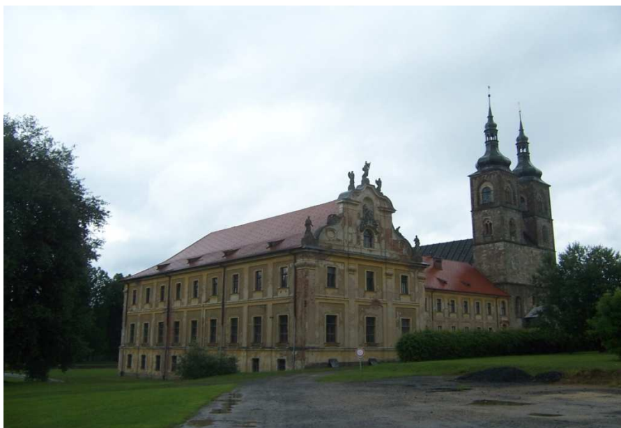
Obrázek č. 1: klášter Teplá