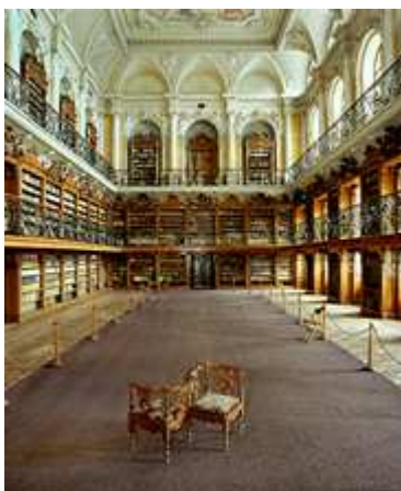
Obrázek č. 2: knihovna