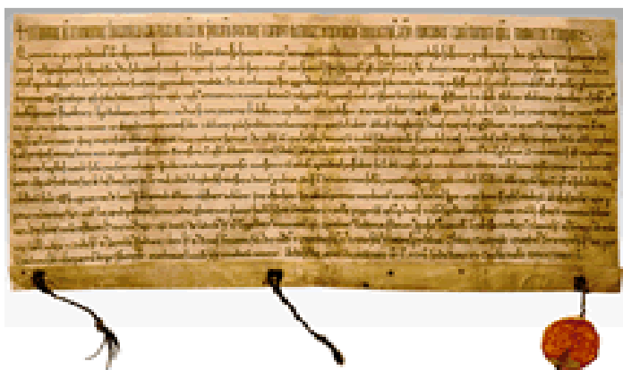
Obrázek č. 4: Hroznatova závět (1197), která je pokládána za zakládací listinu kláštera Teplá