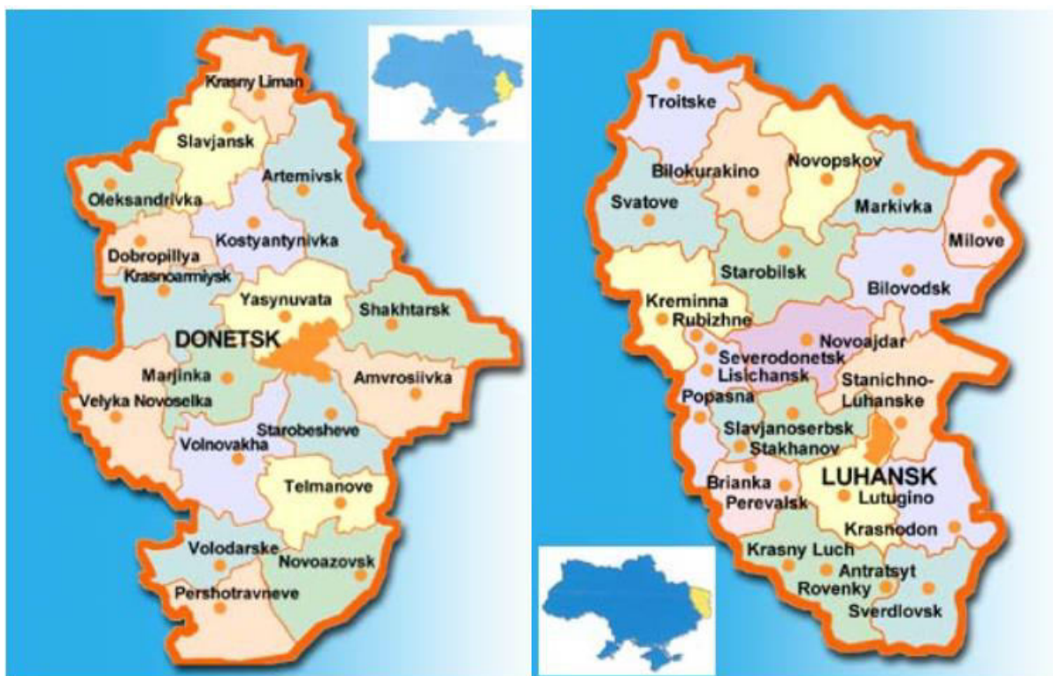
Mapa č. 1. Geografická poloha a administrativní členění Doněcké a Luhanské oblasti. Zdroje: ( http://www.infoukes.com/ukremb/slideshow/luhansk-desc.htm , http://www.infoukes.com/ukremb/slideshow/donetsk-desc.htm , 10. 3. 2022).

Ukrajina nemá nouzi o pitnou vodu, tu zajišťují velké řeky jako Dněpr a Dněstr. Na východě skrze Luhanskou a Doněckou oblast protéká řeka Milus. Kromě příznivého vlivu na úrodnost zemědělské půdy umožňují velké toky též říční dopravu. Kvůli množství řek je v zemi i mnoho mostů, které mohou mít strategický význam.