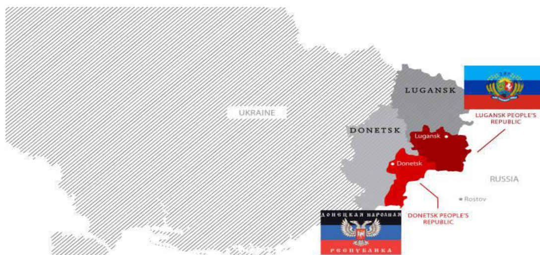
Mapa č. 4. Doněcká lidová republika a Luhanská lidová republika v poměru k Doněcké a Luhanské oblasti.