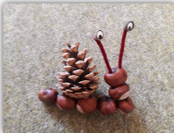
Sada obr. 15 – Sova, šnek, dětská práce

Čím déle vlaštovky u nás v říjnu prodlévají, tím déle pěkné a jasné dny potrvají.