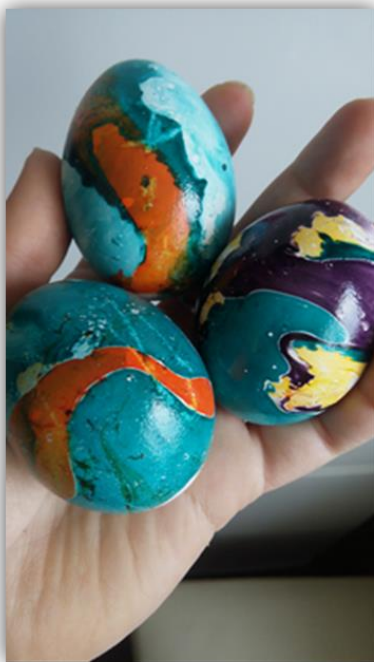
Obr. 34 – Velikonoční vajíčka, dětská práce, archiv autora

Závěr hodiny: Zhodnocení vyučovací hodiny, jak se žákům činnost líbila, sebereflexe žáků.