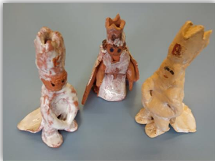
Sada obr. 23 – Tří králové, dětská práce, archiv autora