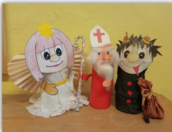
Obr. 21 – Mikuláš, anděl, čert, dětská práce, archiv autora

Zhodnocení vyučovací hodiny, dětská sebereflexe, jak se jim práce líbila, práce s papírem. Společné vystavení hotových výrobků ve třídě.