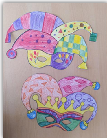
Obr. 28 – Škraboška, dětská práce

Závěr hodiny: Zhodnocení vyučovací hodiny, dětská sebereflexe, jak se jim práce líbila, práce s papírem.