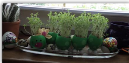
Obr. 7 – Housenka, kolektivní práce

Poslední večer v dubnu je věnován pálení čarodějnic, kdy se na vesnicích dělají velké ohně, stavějí se májky a děti se převlékají za čarodějnice. Ve městech se tento zvyk dodržuje tak, že lidé grilují. Dříve se slavnost pálení čarodějnic označovala jako filipo-jakubská noc, noc magická.