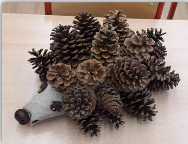
Obr. 1 – Ježek, kolektivní práce, archiv autora

Zhodnocení vyučovací hodiny, průběh skupinové práce dětí, dětská sebereflexe, jak se jim práce a práce ve skupině líbila. Vystavení hotových výrobků před budovou školy.