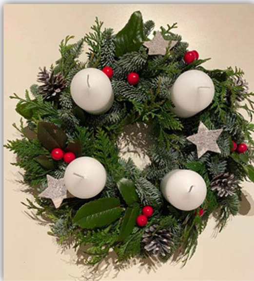
Obr. 19 – Adventní věnec, dětská práce