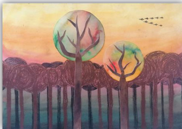
Obr. 16 – Podzimní krajina, dětská práce

Závěr hodiny: Zhodnocení vyučovacích hodin, dětská sebereflexe, jak se jim práce a kombinace technik líbila.