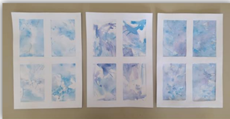
Obr. 20 – Okna, dětská práce

Závěr hodiny: Zhodnocení vyučovací hodiny, sebereflexe žáků, společné hodnocení. Vystavení oken na chodbě školy.