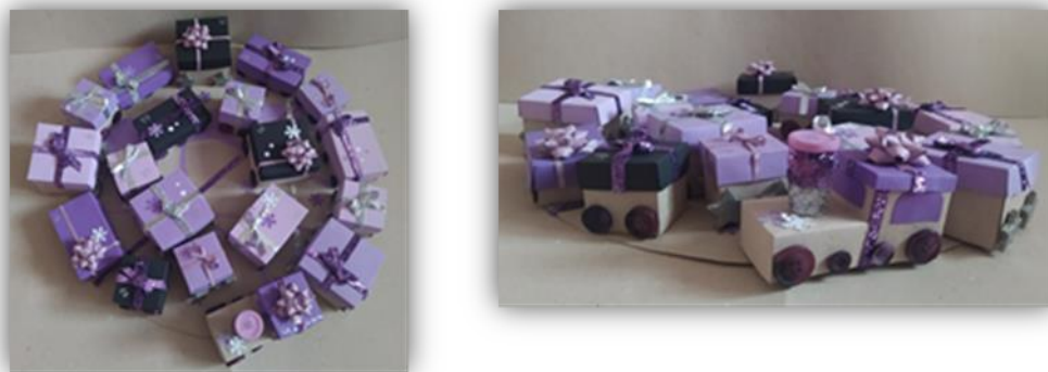
Sada obr. 4 – Adventní kalendář, kolektivní práce