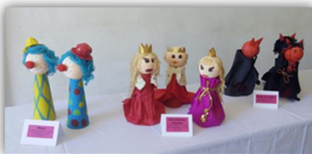
Sada obr. 6 – Masopust, kolektivní práce