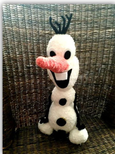
Obr. 29 - Sněhulák „Olaf“, dětská práce

Závěr hodiny: Zhodnocení průběhu vyučovací hodiny. Zhodnocení práce dětí, dětská sebereflexe, vystavení hotových výrobků v prostorách školy.