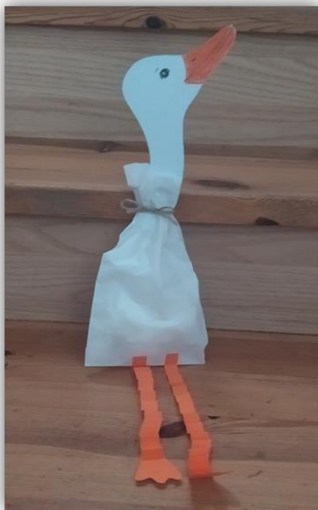
Obr. 11 – Husa, dětská práce, archiv autora

Závěr hodiny: Závěrečné zhodnocení vyučovacích hodin, sebereflexe žáků, práce s papírem, jak se jim činnost líbila. Společné vystavení výrobků v jídelně školy.