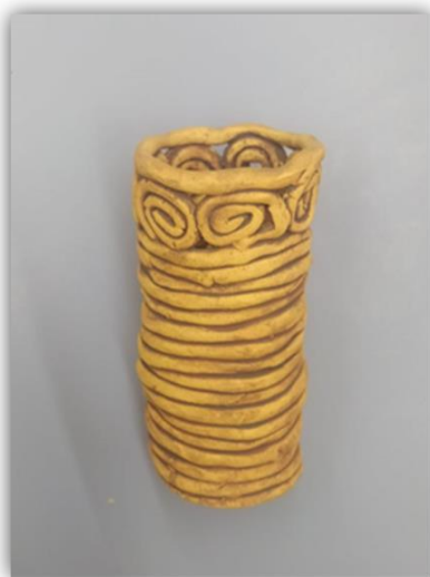
Obr. 35 – Váza, dětská práce

Závěr hodiny: Zhodnocení vyučovacích hodin, dětská sebereflexe, jak se jim práce líbila, práce s keramickou hlínou, glazování burelem.