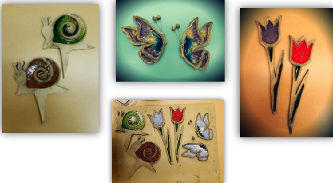
Sada obr. 40 – Zápich, dětská práce

Závěr hodiny: Zhodnocení vyučovacích hodin, dětská sebereflexe, jak se jim práce líbila, práce s keramickou hlínou, glazování burelem, práce s drceným sklem.