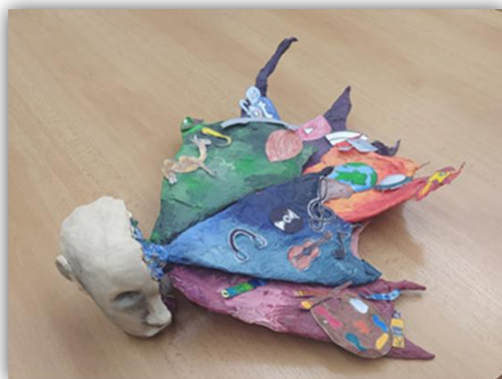
Obr. 5 – Hlava, kolektivní práce