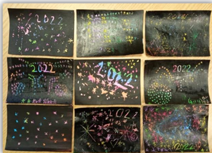
Obr. 24 – Ohňostroj, dětská práce, archiv autora

Společné zhodnocení ohňostrojů, dětská sebereflexe, vystavení výkresů na nástěnkou ve třídě.