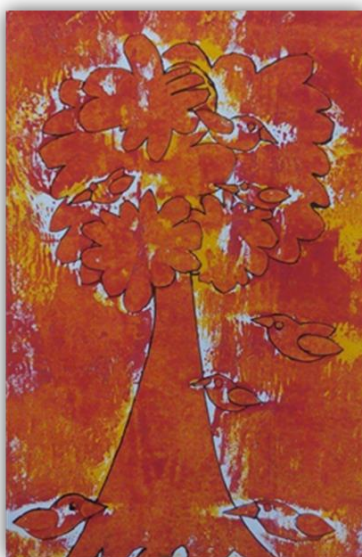
Obr. 33 – Jarní strom, dětská práce

Závěr hodiny: Zhodnocení vyučovacích hodin, sebereflexe žáků, trpělivost. Zhodnocení a vystavení hotových výrobků na chodbě školy.