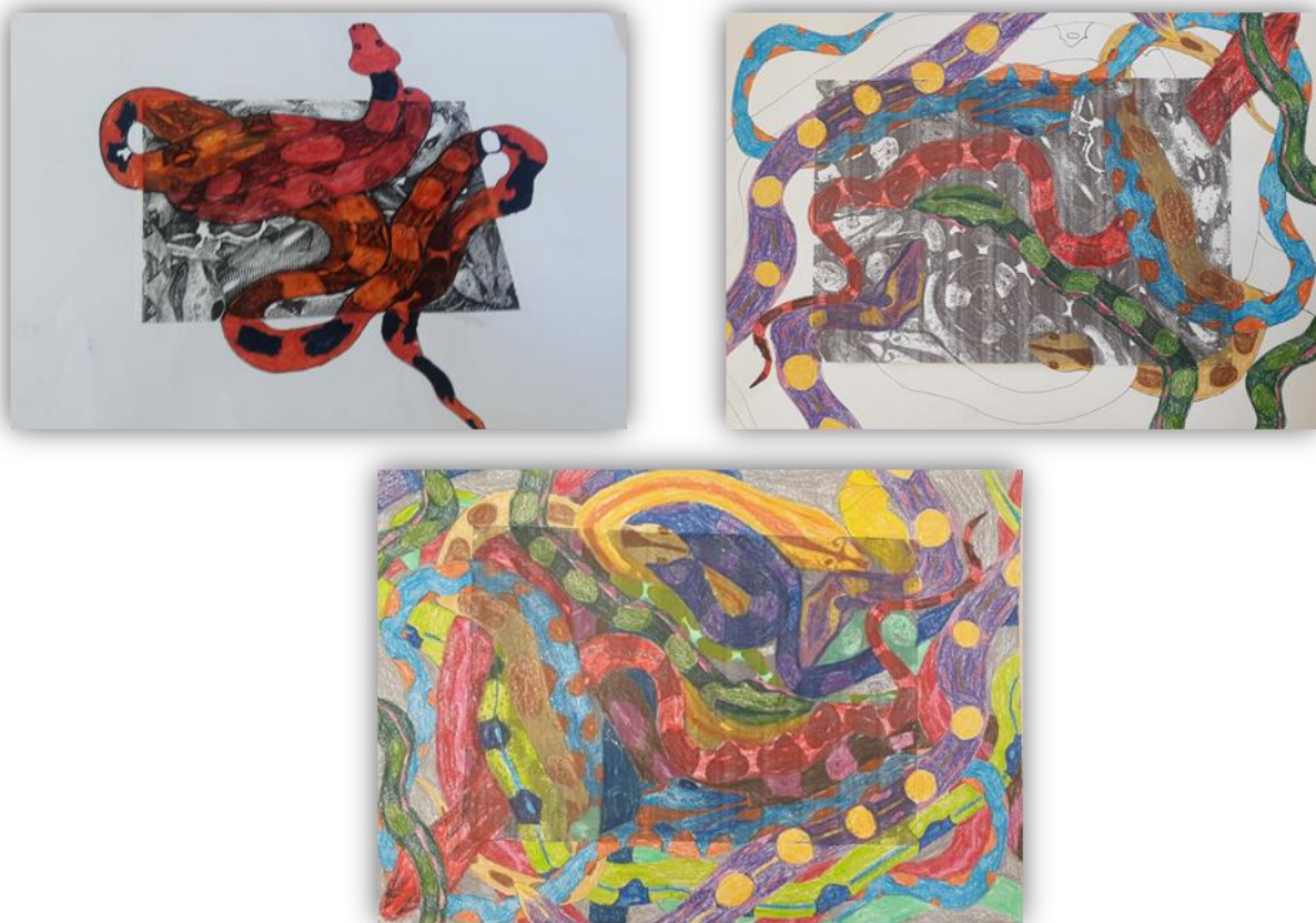
Sada obr. 32 – Hadi, dětská práce

Závěr hodiny: Zhodnocení vyučovacích hodin, dokreslování hadů, vybarvování. Sebereflexe žáků, společné hodnocení a vystavení obrázků na chodbě školy.