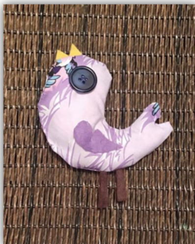
Obr. 27 – Ptáček, dětská práce