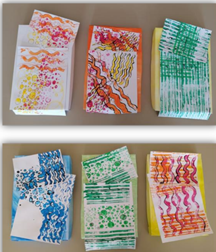
Sada obr. 17 – Povlečení, dětská práce

Závěr hodiny: Zhodnocení vyučovacích hodin, kombinace technik, dětská sebereflexe, jak se jim práce líbila, společné vystavení výrobků ve školní družině.