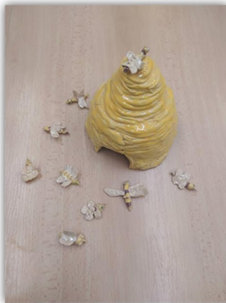
Obr. 37 – Úl a včelky, dětská práce