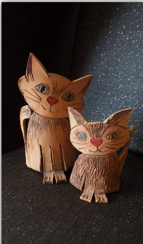
Obr. 26 – Kočka, dětská práce

Závěr hodiny: Zhodnocení vyučovacích hodin, jak se žákům práce s keramickou hlínou líbila. Zhodnocení a vystavení hotových výrobků ve školní družině.