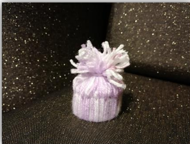
Obr. 12 – Kulich, dětská práce, archiv autora

Závěr hodiny: Zhodnocení vyučovací hodiny, práci dětí, dětská sebereflexe, jak se jim práce líbila. Společné vystavení hotových výrobků na chodbu školy