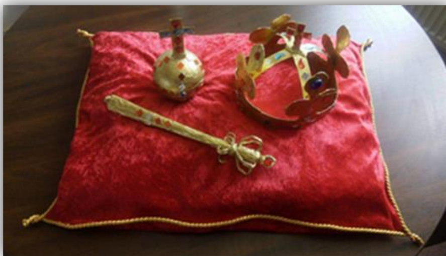
Obr. 2 – Korunovační klenoty, kolektivní práce

Závěr hodiny: Jednotlivé vyučovací hodiny na konci vždy společně zhodnotíme, žáci posoudí skupinovou práci a celkový výrobek. Následuje hodnocení ostatních skupin, jak se jim klenoty a polštář líbí, sebereflexe a motivace na příští vyučovací hodinu.