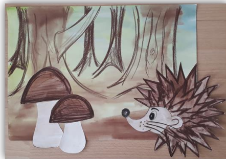
Obr. 13 – Les, dětská práce