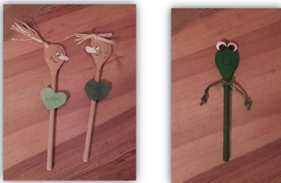
Sada obr. 36 – Vařečka, dětská práce, archiv autora

Závěr hodiny: Zhodnocení vyučovací hodiny, společné hodnocení, sebereflexe žáků.