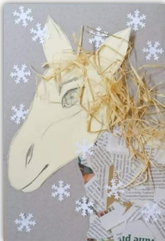
Obr. 18 – Kůň sv. Martina, dětská práce

Závěr hodiny: Zhodnocení vyučovací hodiny, sebereflexe žáků, jak se jim práce a kombinace technik líbila. Vystavení výrobků na chodbě školy.