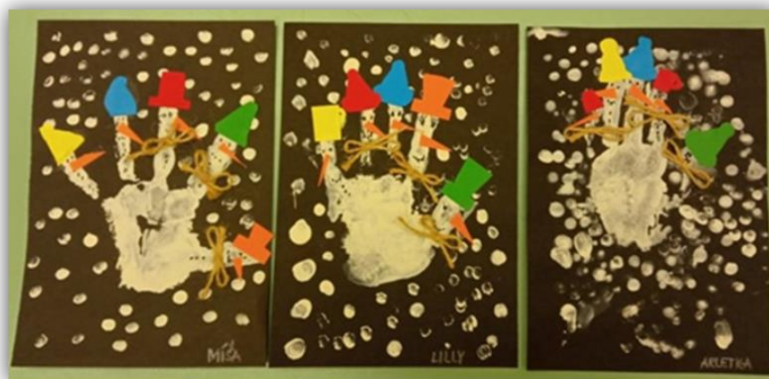
Obr. 25 – Rukavice se sněhuláky, dětská práce