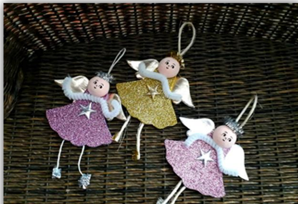
Obr. 22 – Andílek, dětská práce

Zhodnocení vyučovací hodiny, sebereflexe žáků, žáci vyráběli každý dva andílky. Jednoho si vzali domů a ostatní jsme použili jako ozdoby na vánoční stromeček.