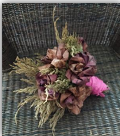
Sada obr. 39 – Květina, dětská práce, archiv autora