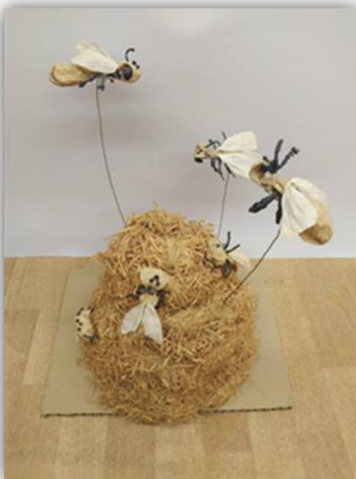
Obr. 10 – Včelí úl, kolektivní práce