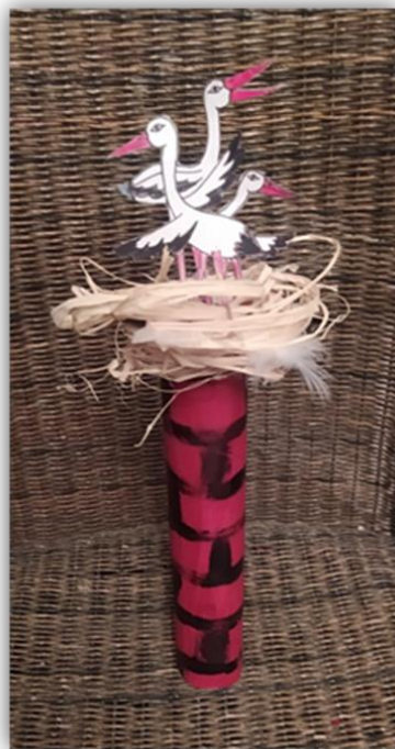
Obr. 31 – Čápi na komíně, dětská práce