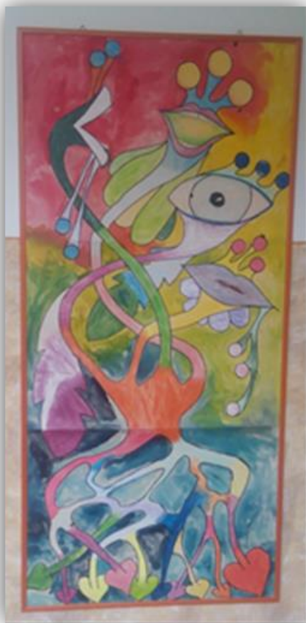
Obr. 9 – Masožravá kytky, kolektivní práce

Závěr hodiny: Závěrečné zhodnocení vyučovacích hodin, sebereflexe žáků. Velký formát jsem nechala podlepit a zarámovat. Masožravou kytku jsme pověsili na chodbě školy.