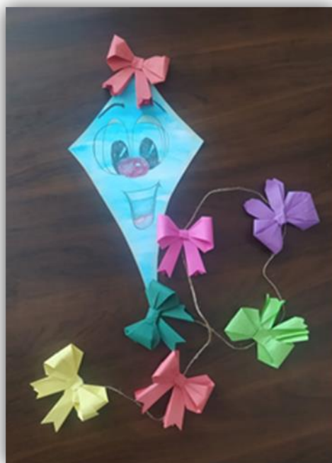
Obr. 3 – Drak, kolektivní práce, archiv autora

Závěr hodiny: Zhodnocení práce žáky, sebereflexe, zhodnocení pedagogem. Vystavení létajícího papírového draka ve školní družině.