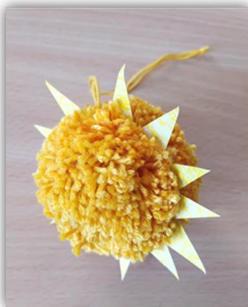
Obr. 30 – Slunce, dětská práce

Závěr hodiny: Zhodnocení vyučovacích hodin, dětská sebereflexe, jak se jim práce líbila, práce s vlnou, s papírem.