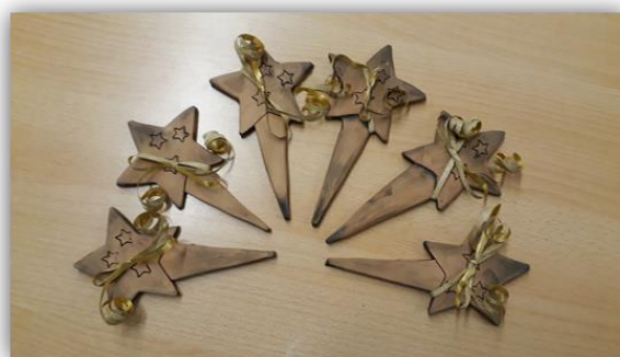
Sada obr. 14 – Zápich, dětská práce, archiv autora