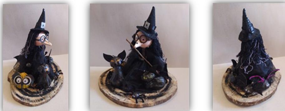
Sada obr. 8 – Čarodějnice, kolektivní práce, archiv autora

Závěr hodiny: Na konci vyučovací hodiny proběhlo zhodnocení odvedené pracovní činnosti, jak se dětem činnost líbila, jestli se jim dobře komunikovalo a spolupracovalo ve skupinách, ve kterých děti tvořily jinou část výrobku.