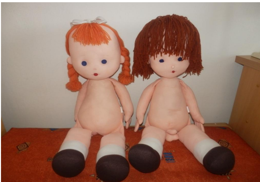
Pomůcky „Jája a Pája“ bez oděvu