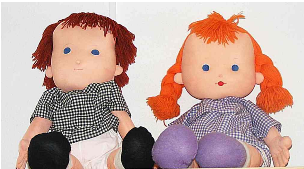
Pomůcky pro výslech dětských svědků „Jája a Pája“