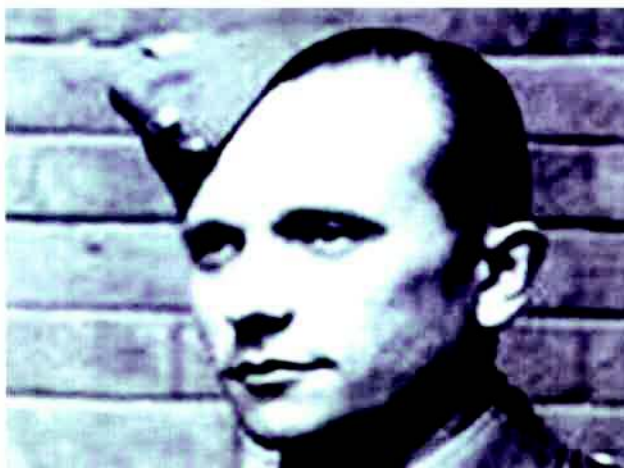
1 - Jozef Gabčík