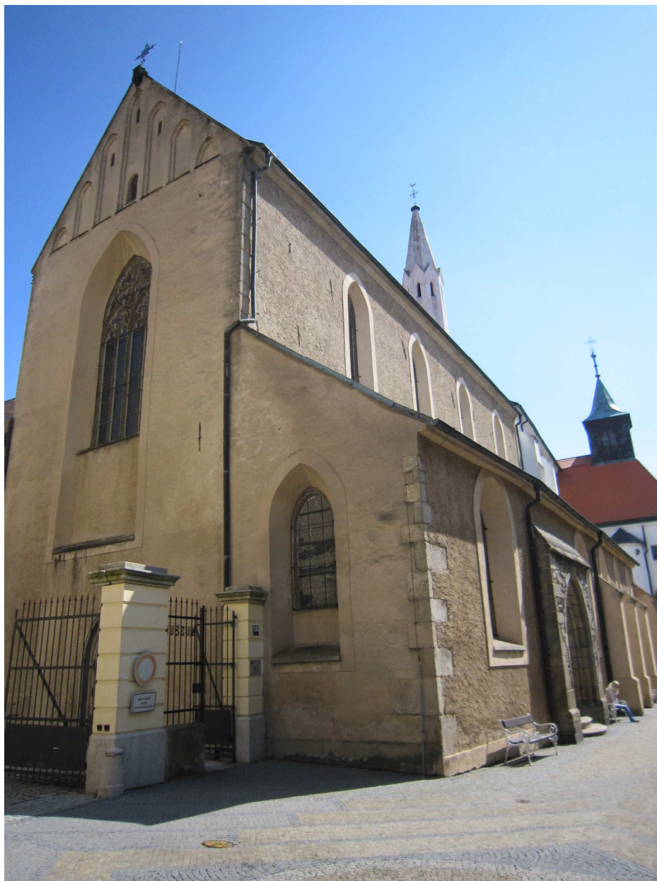
14. Kostel sv. Jana Křtitele nejstarší kostel v Jindřichově Hradci.