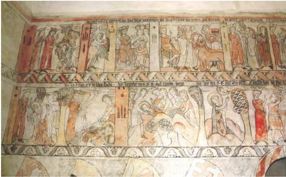
13. Část fresky zobrazující legendu o sv. Jiří.

JUŘÍK, P.: Dominia Pánů z Hradce, Slavatů a Czerninů , s. 24.