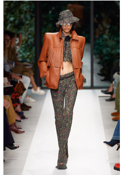
[3] Philosophy di Lorenzo