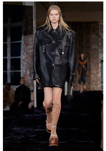
[6] Acne Studios

[1-6] Spring 2022 Ready-to-Wear Fashion shows | Vogue. [online]. Copyright © [cit. 27.04.2022]. Dostupné z: https://www.vogue.com/fashion-shows/spring-2022-ready-to-wear