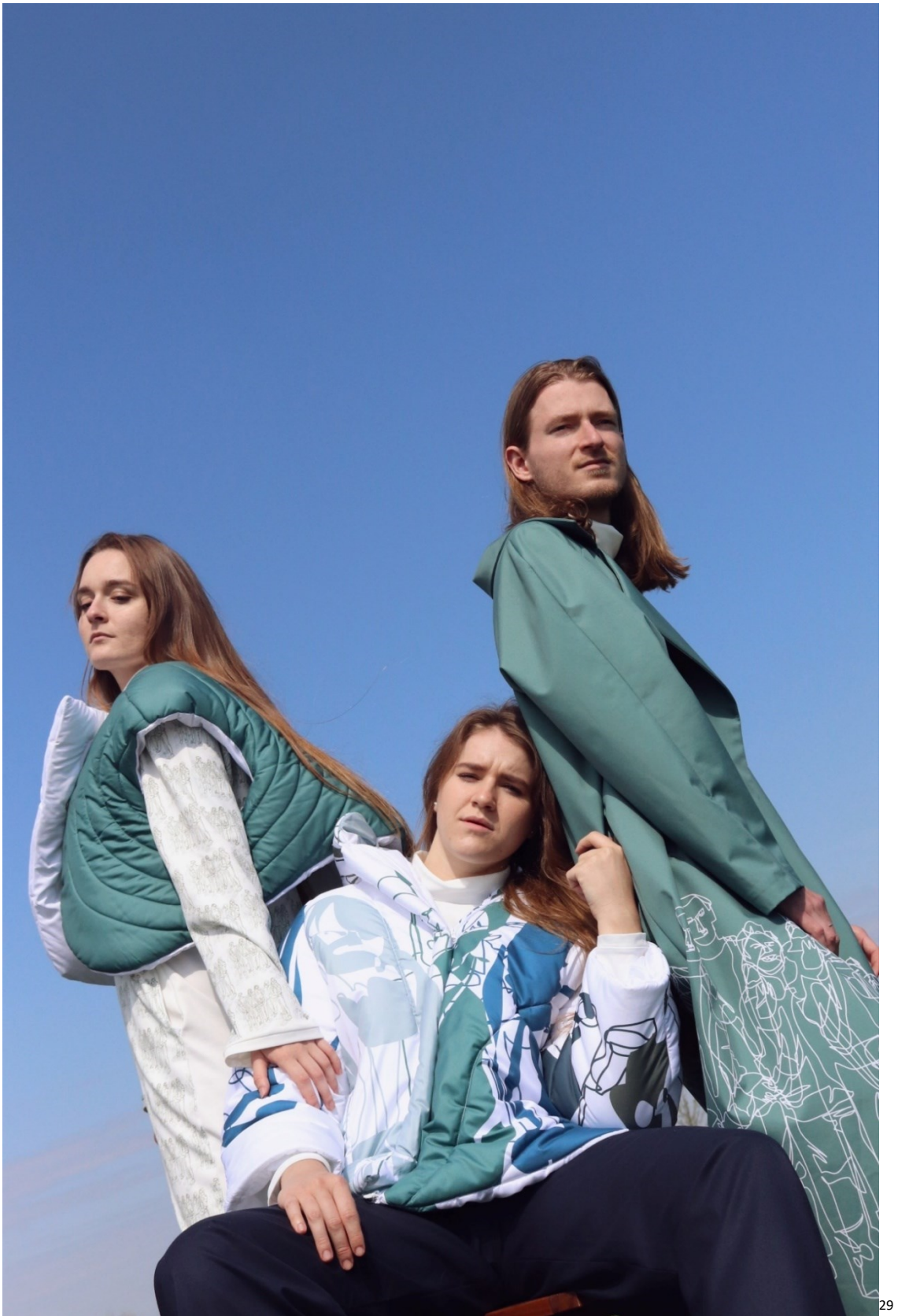
příloha 28 - fotodokumentace