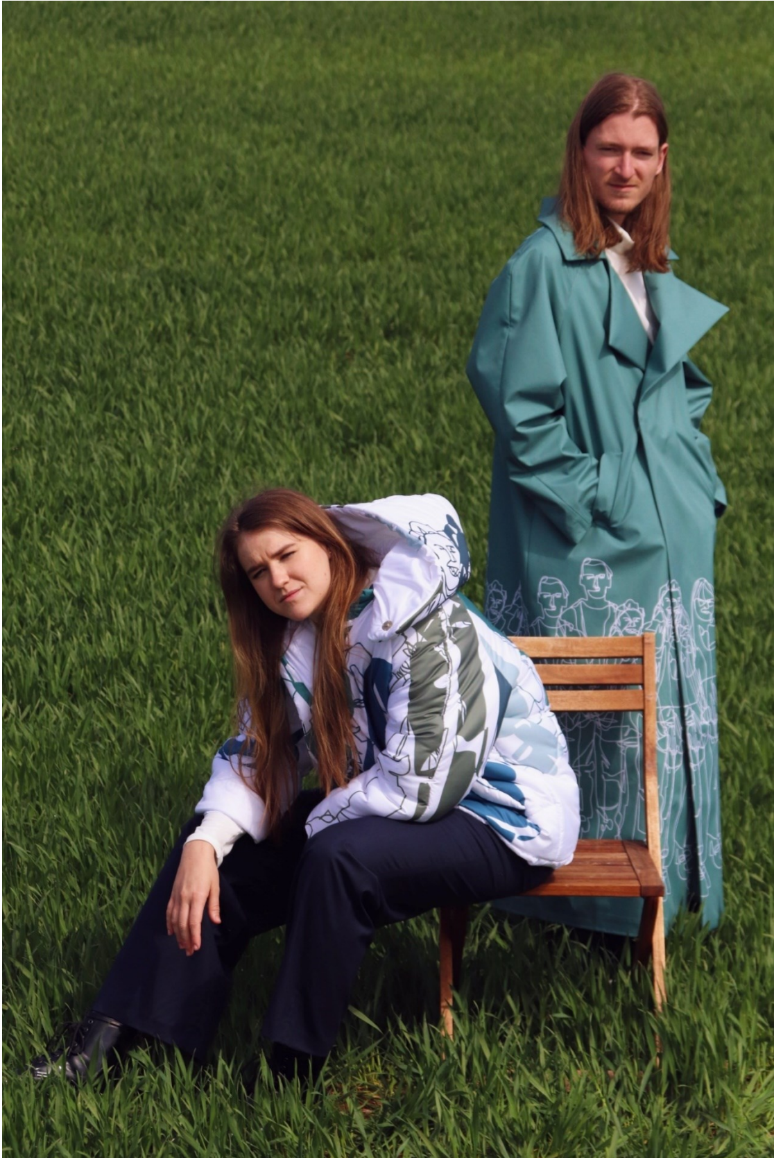
příloha 30 - fotodokumentace