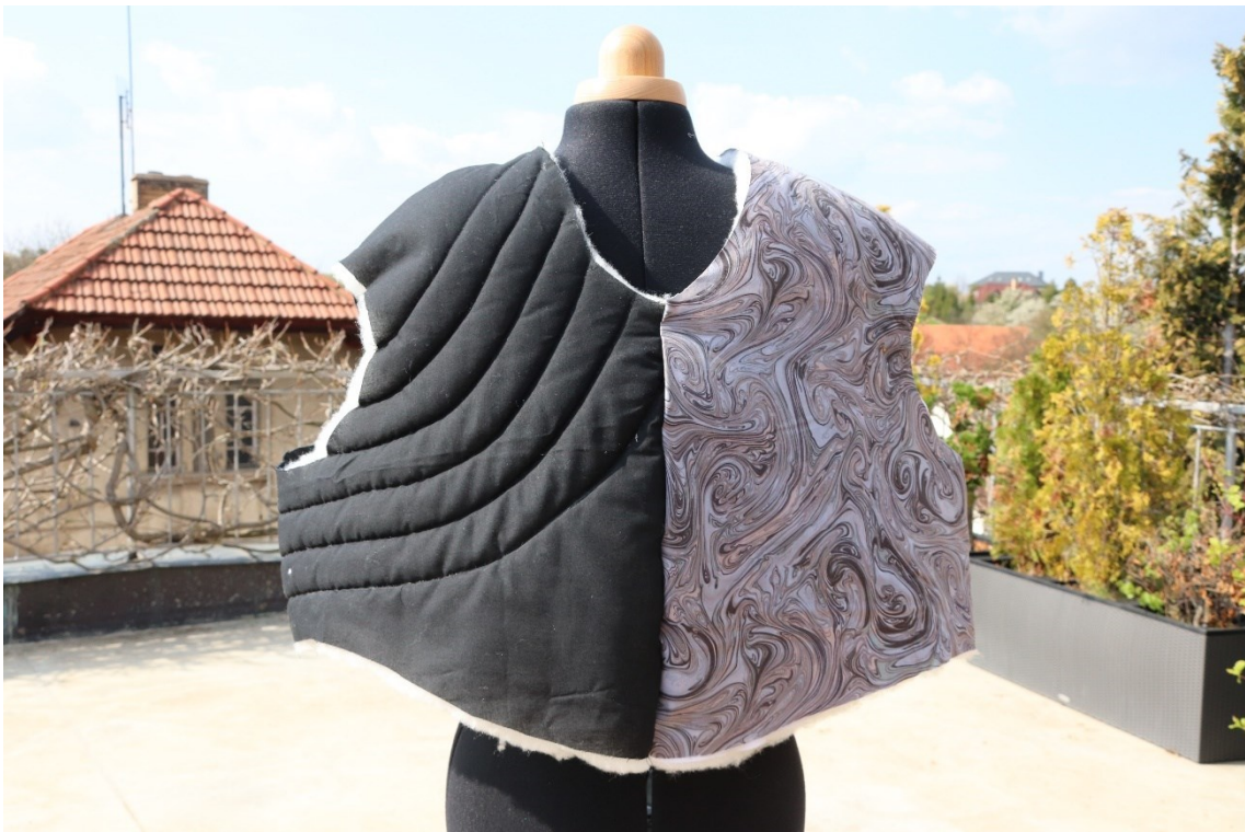
příloha 7 - model z pomocného materiálu