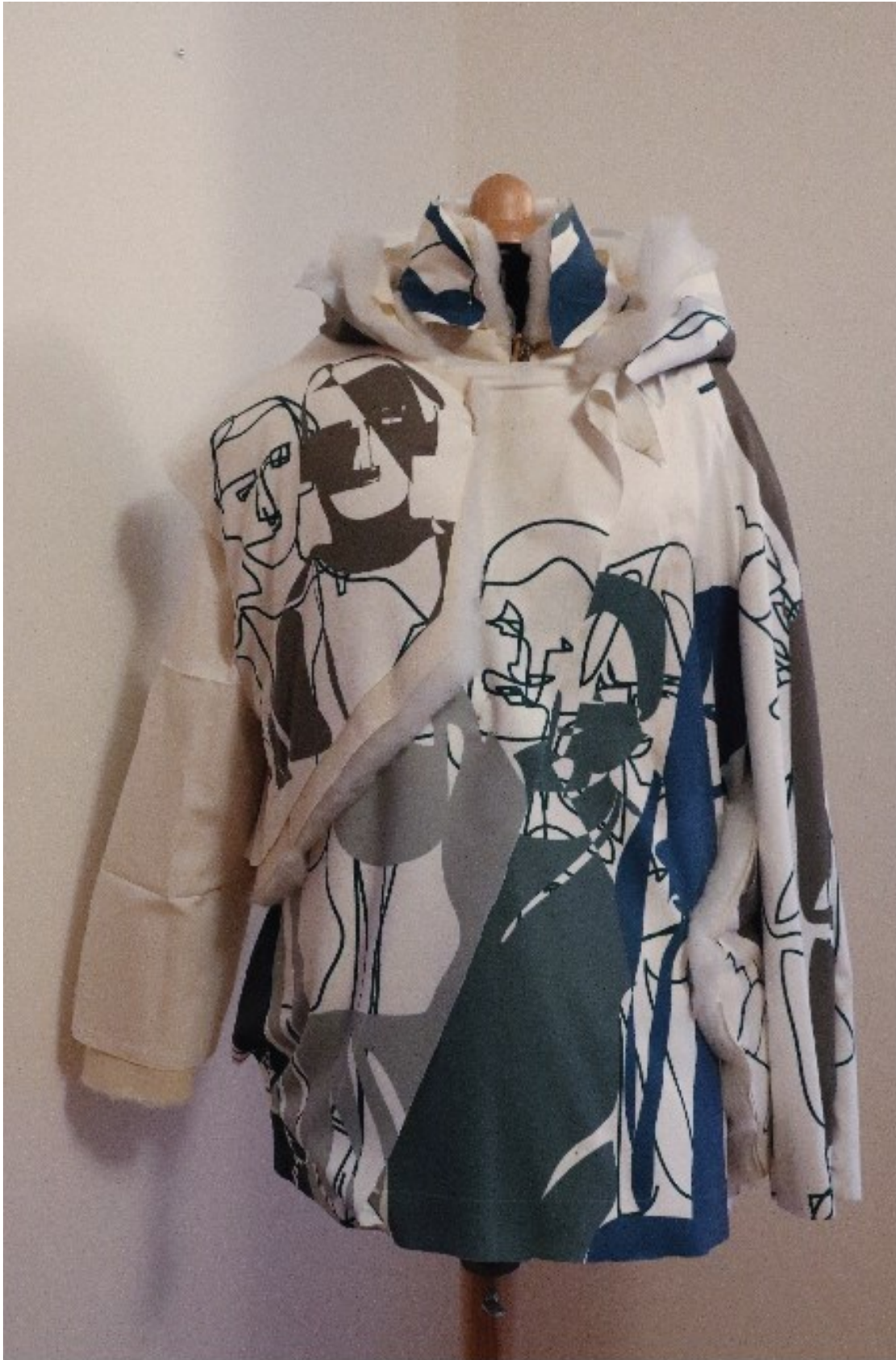
příloha 5 - model z pomocného materiálu