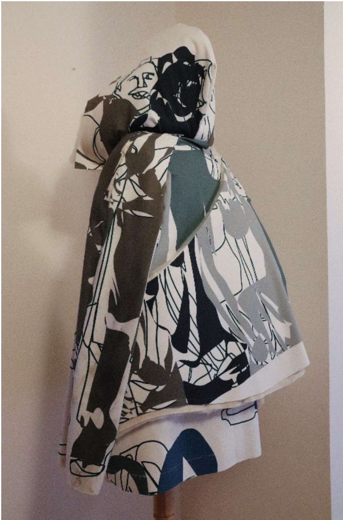
příloha 4 - model z pomocného materiálu