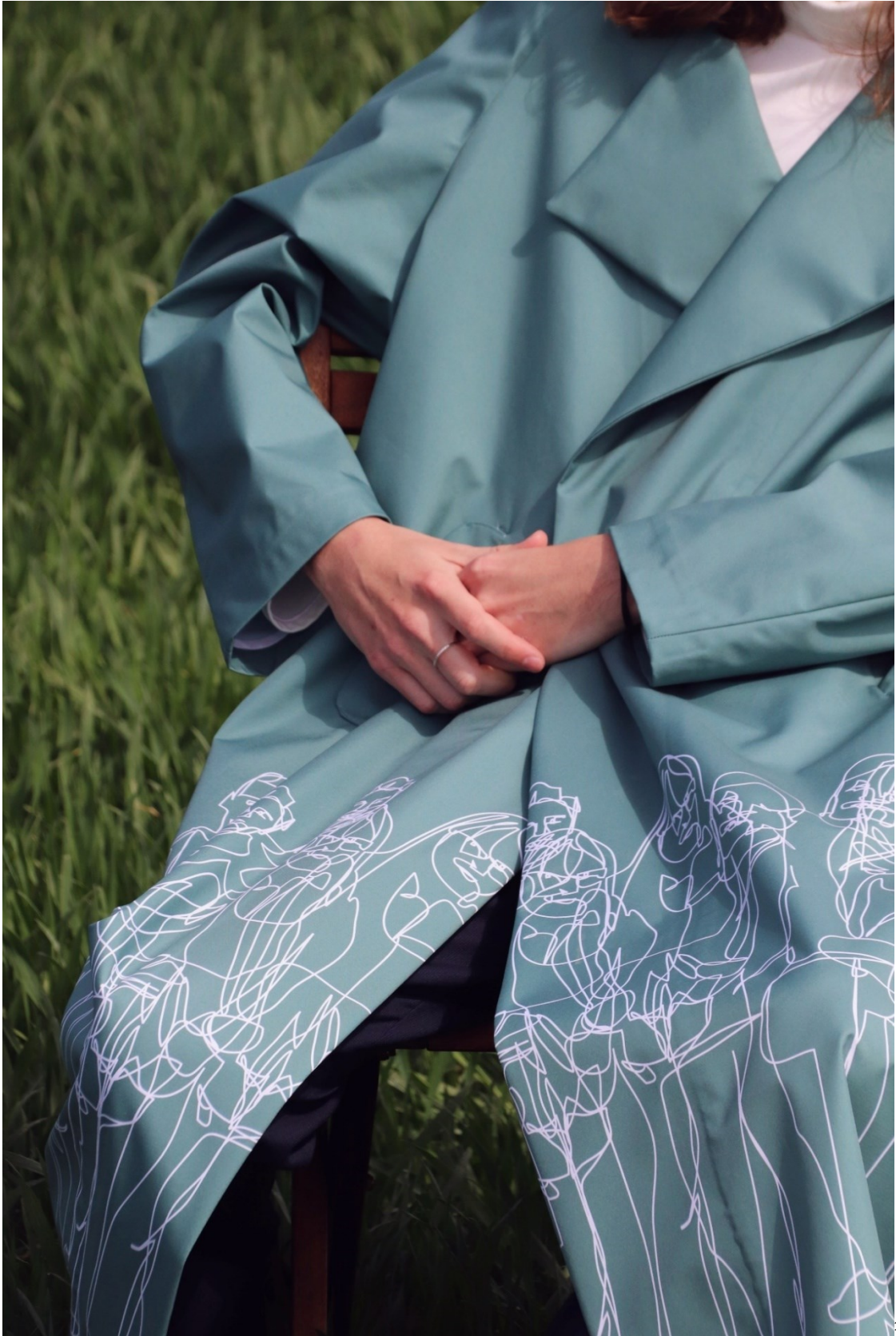
příloha 18 - fotodokumentace