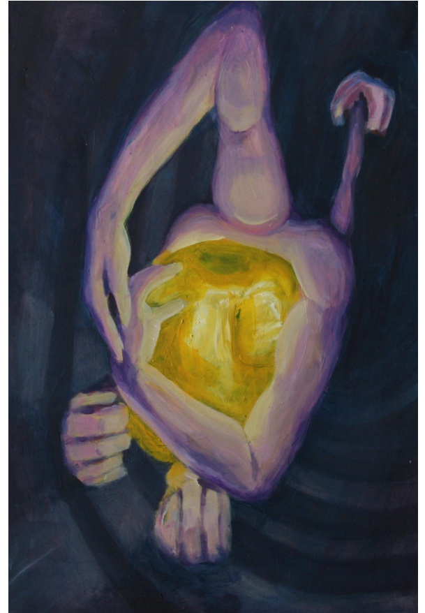
(Příloha č. 4)