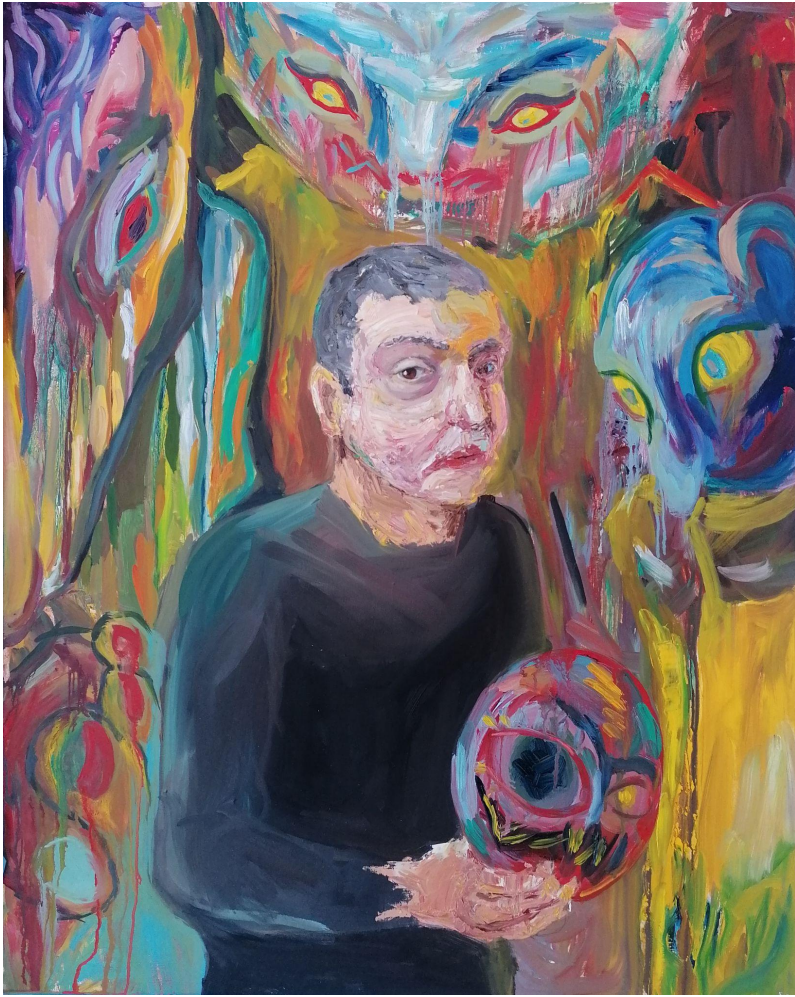
(Příloha č. 1)