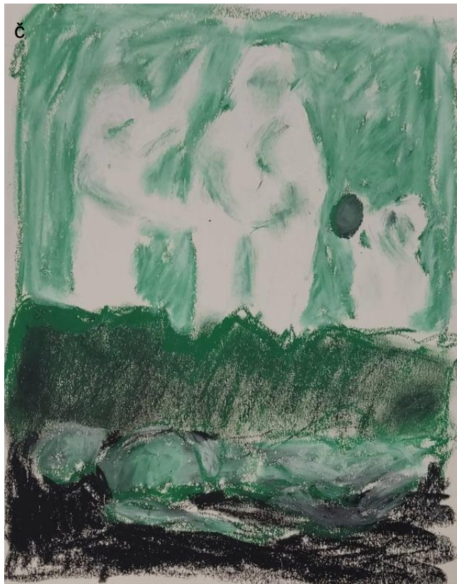
(Příloha č. 5 a 6)