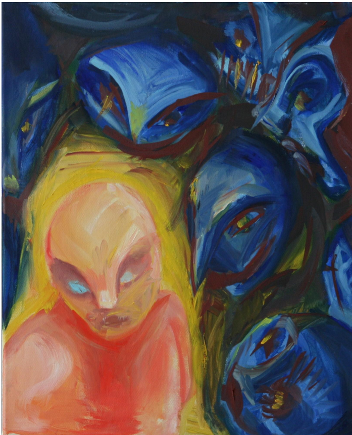
(Příloha č. 2)