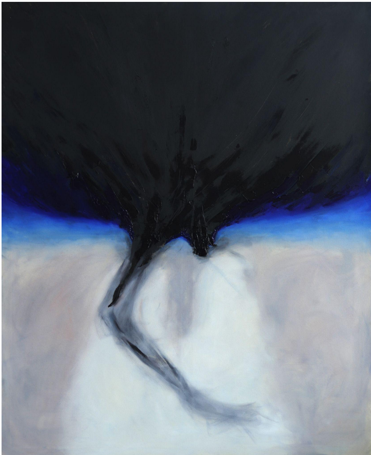
(Příloha č. 11)