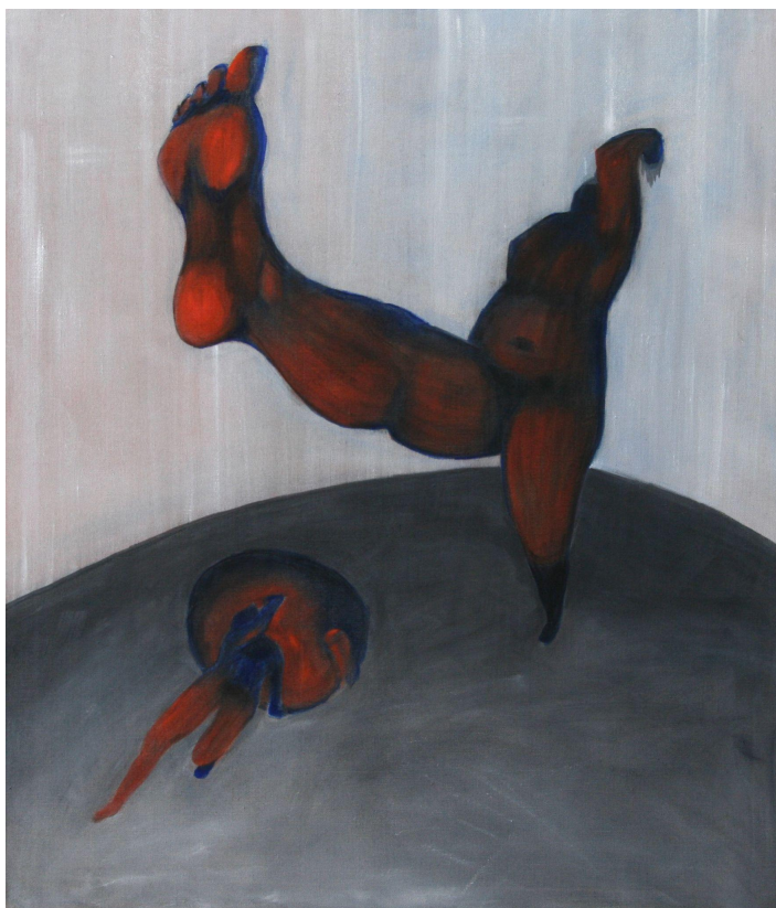
(Příloha č. 7)