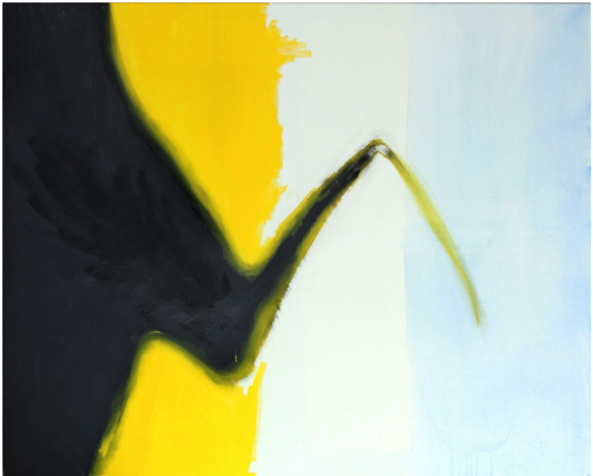
(Příloha č. 14)