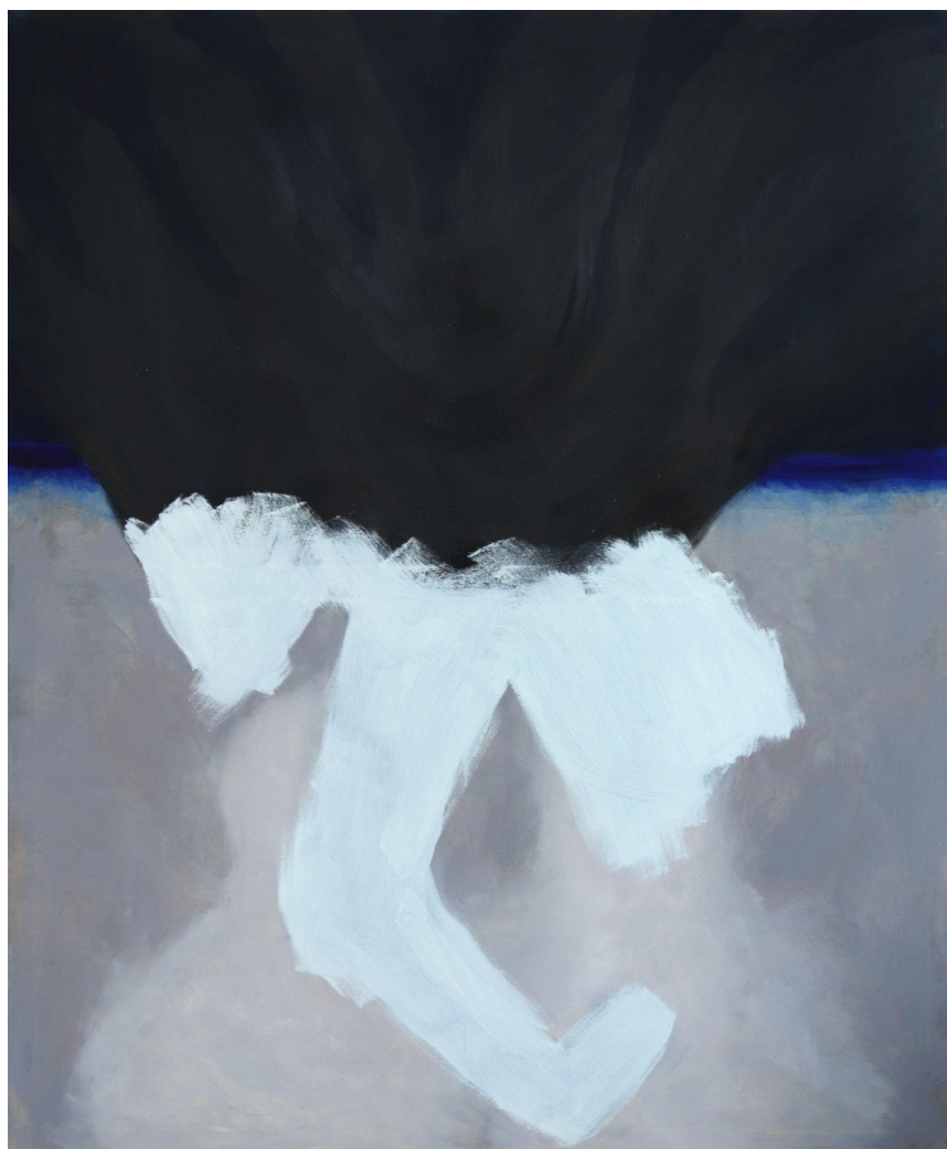
Příloha č. 8)