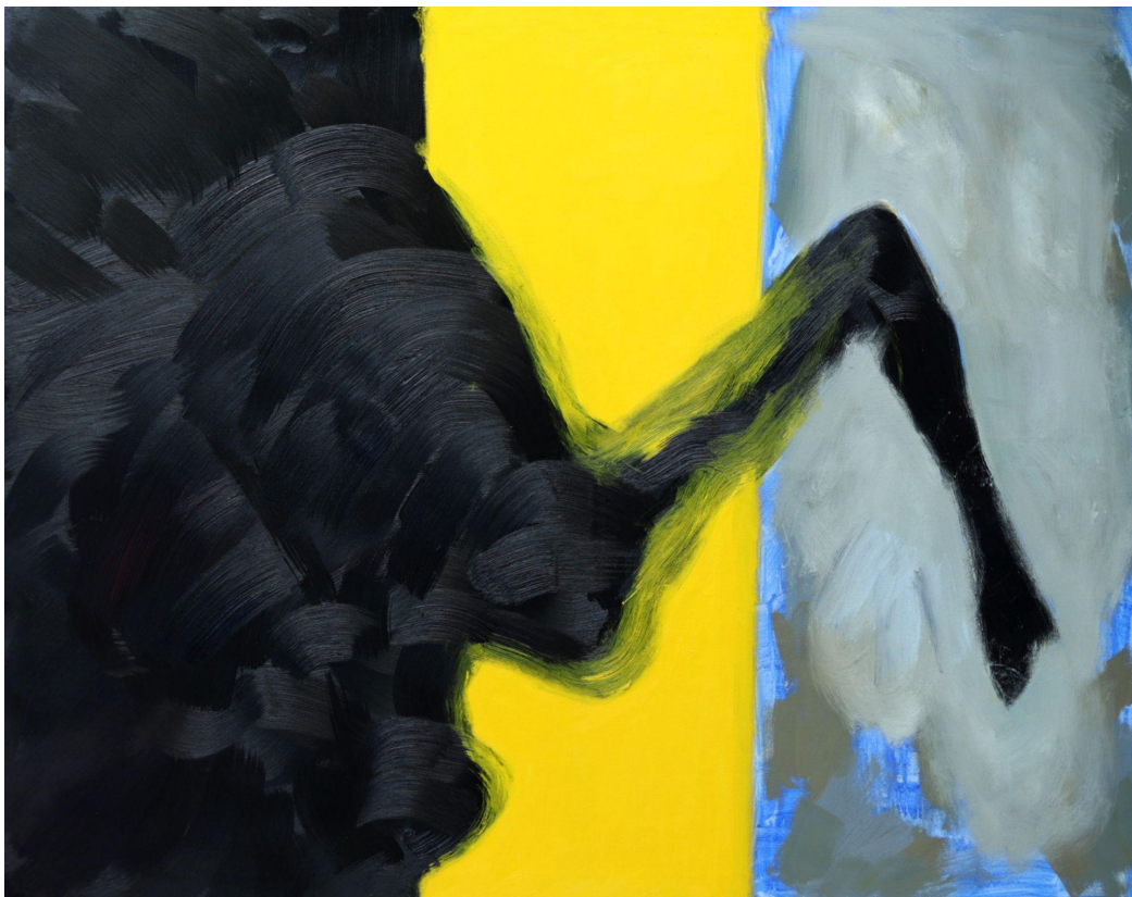
(Příloha č. 10)