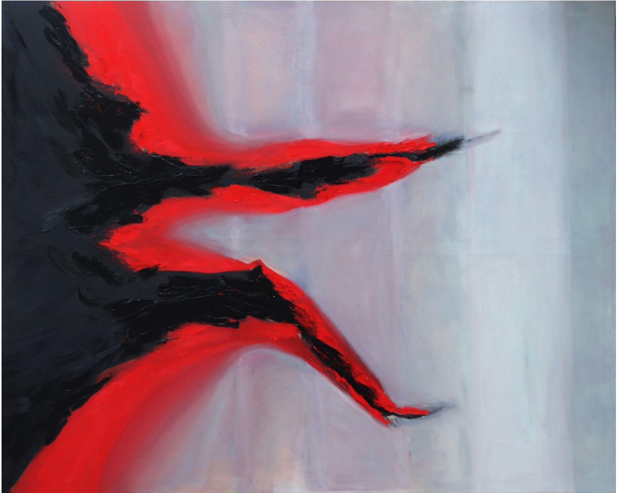
(Příloha č. 12)