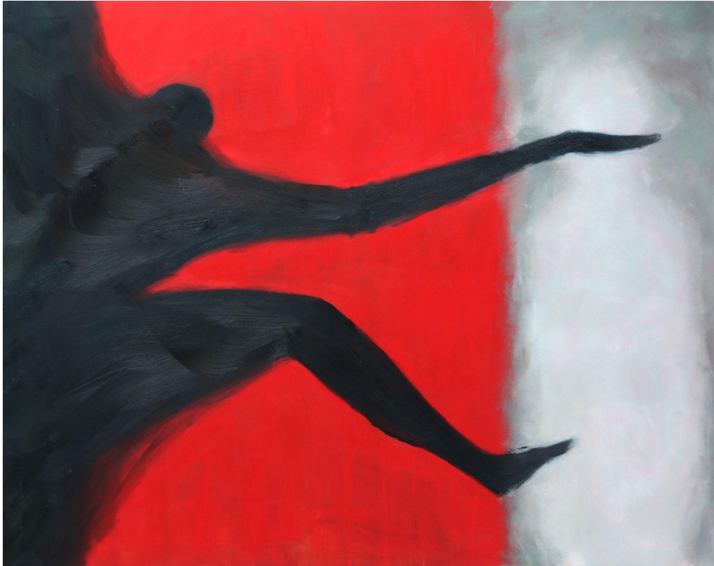
(Příloha č. 9)