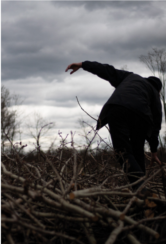
příloha č. 3