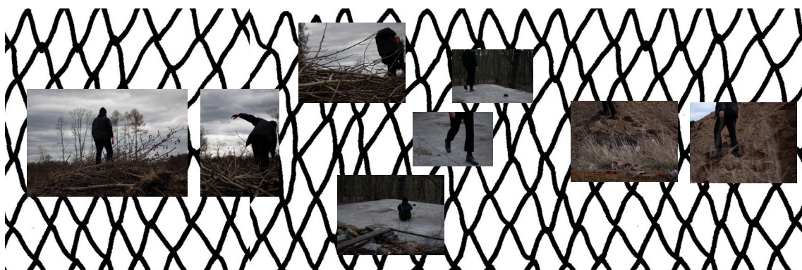
příloha č. 13