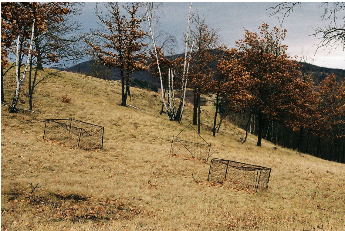
příloha č. 18