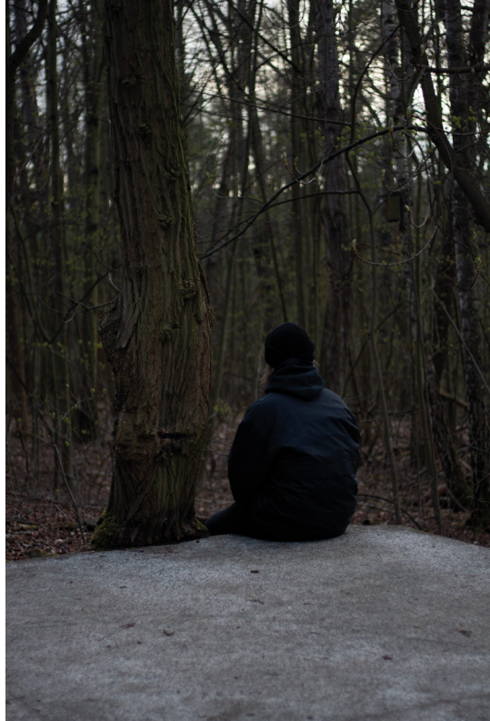
příloha č. 11