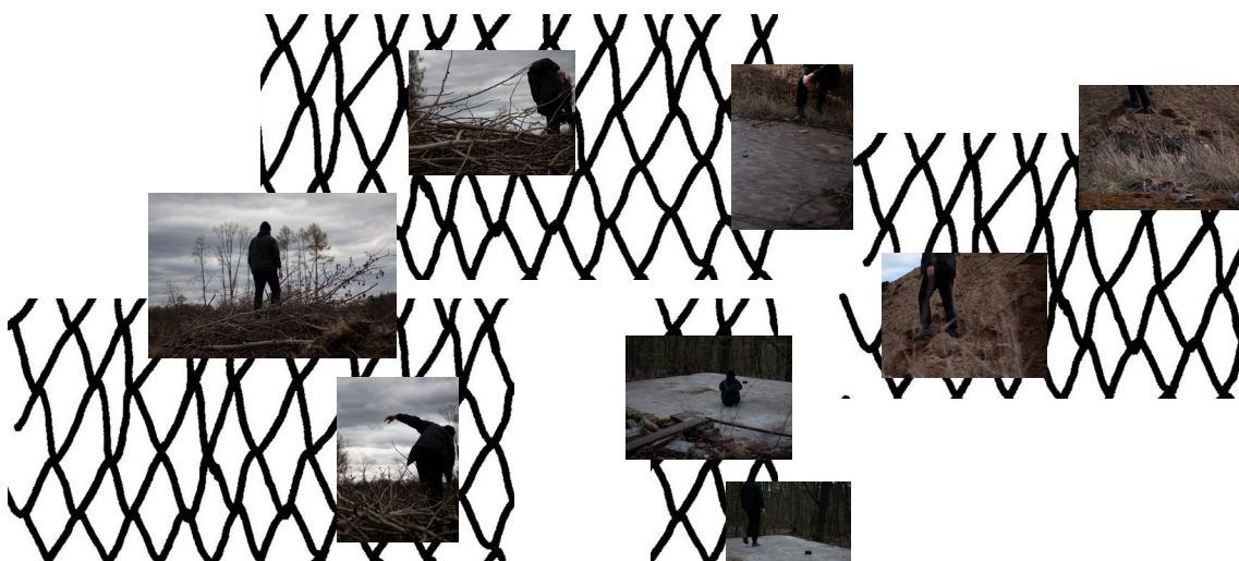
příloha č. 14