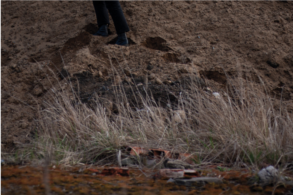
příloha č. 6