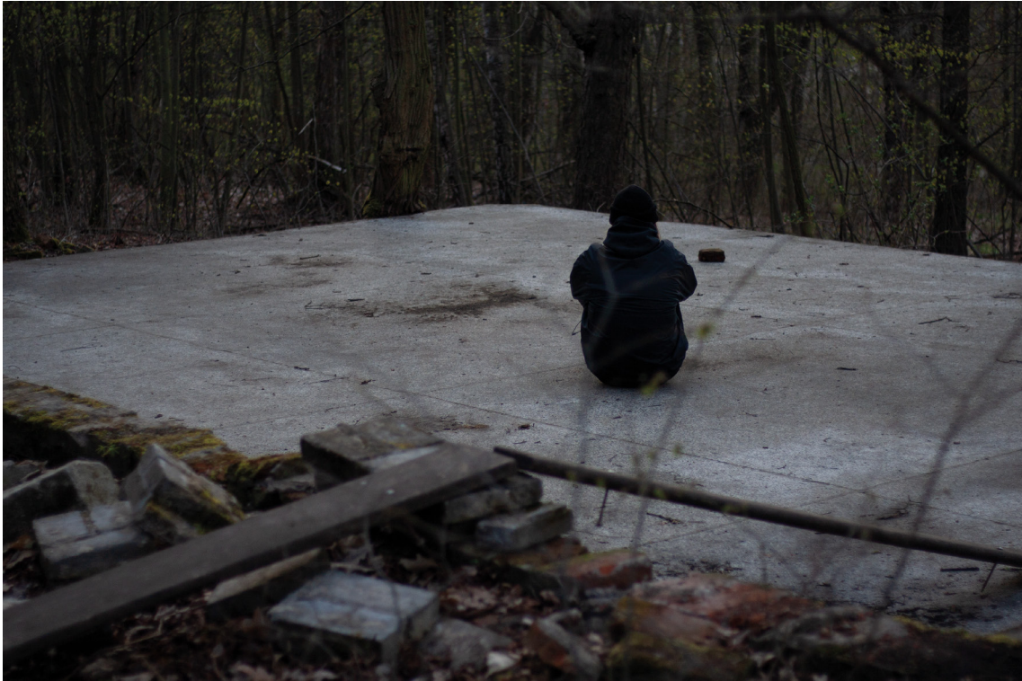
příloha č. 8