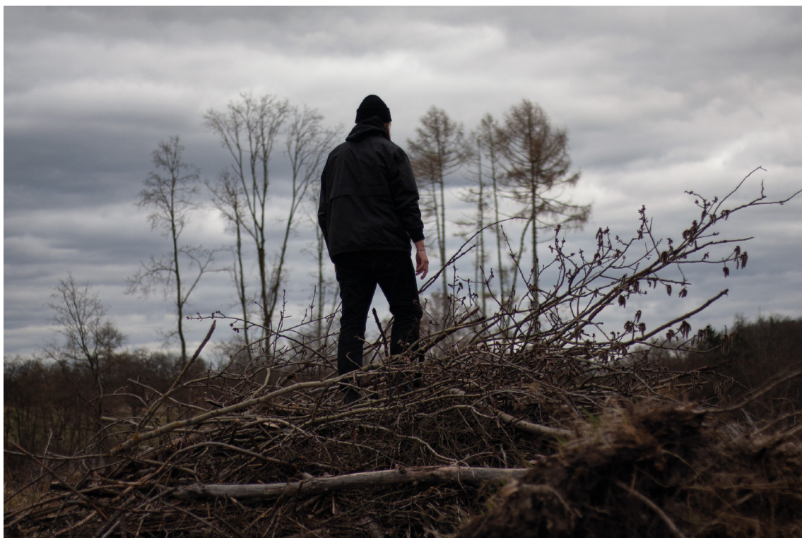
příloha č. 1