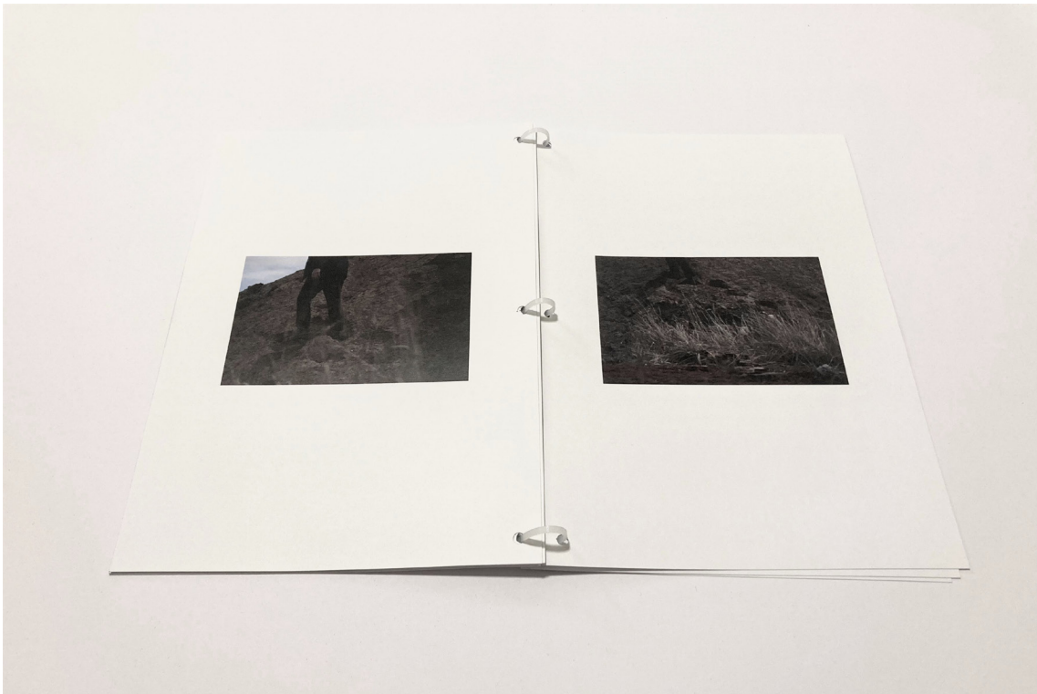
příloha č. 21