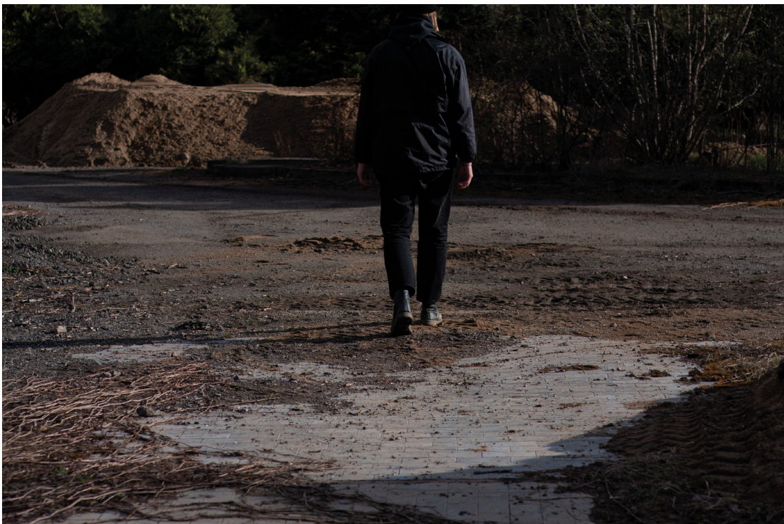
příloha č. 5