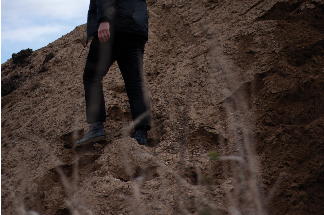
příloha č. 7