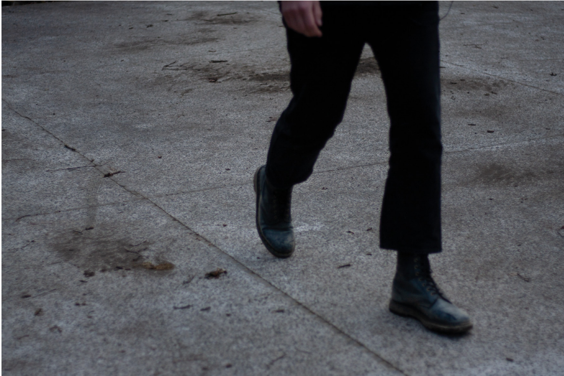
příloha č. 10