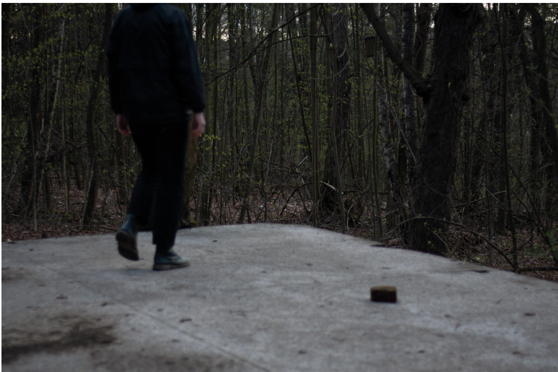
příloha č. 9