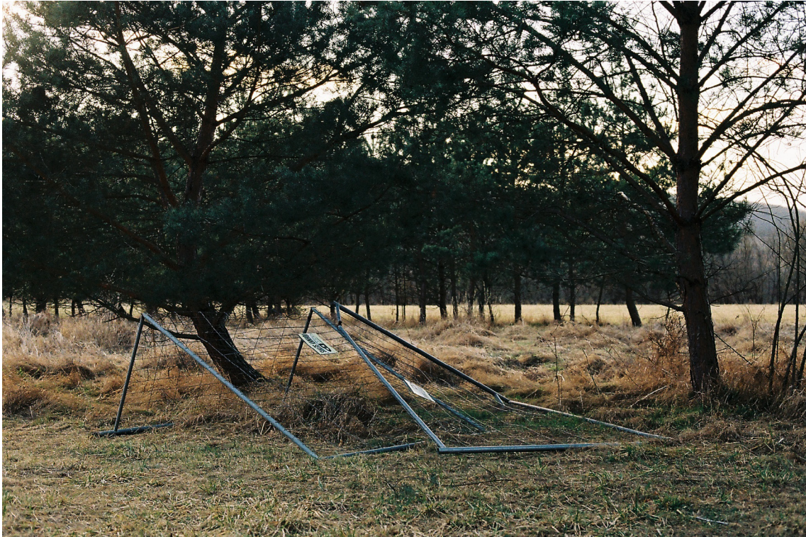
příloha č. 17