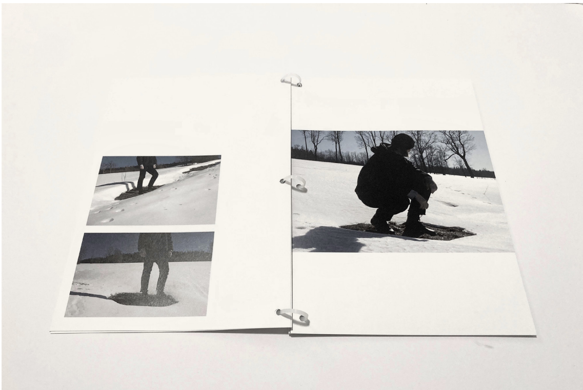
příloha č. 22