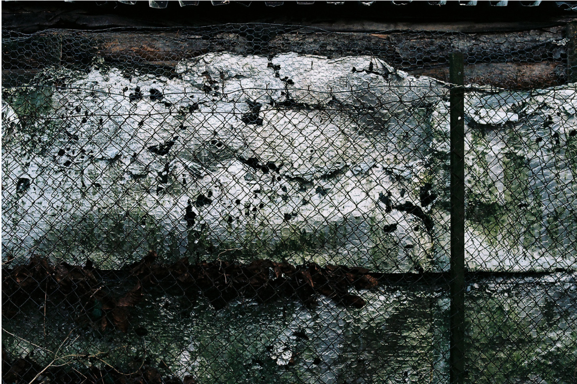
příloha č. 19