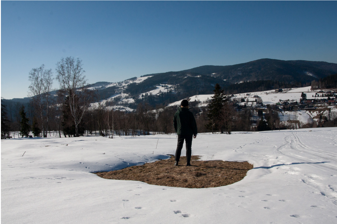
příloha č. 15