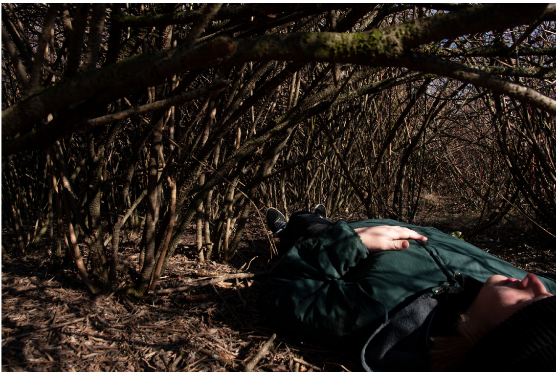
příloha č. 16