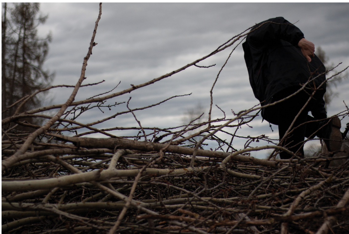
příloha č. 2