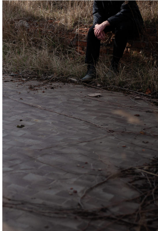
příloha č. 4