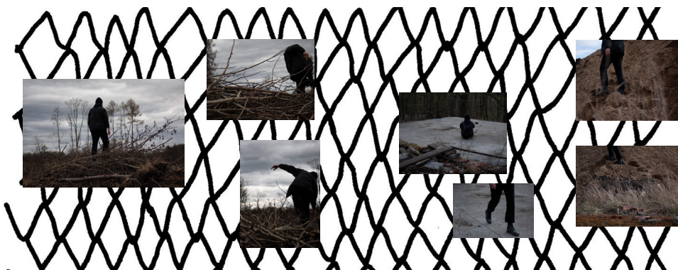
příloha č. 12