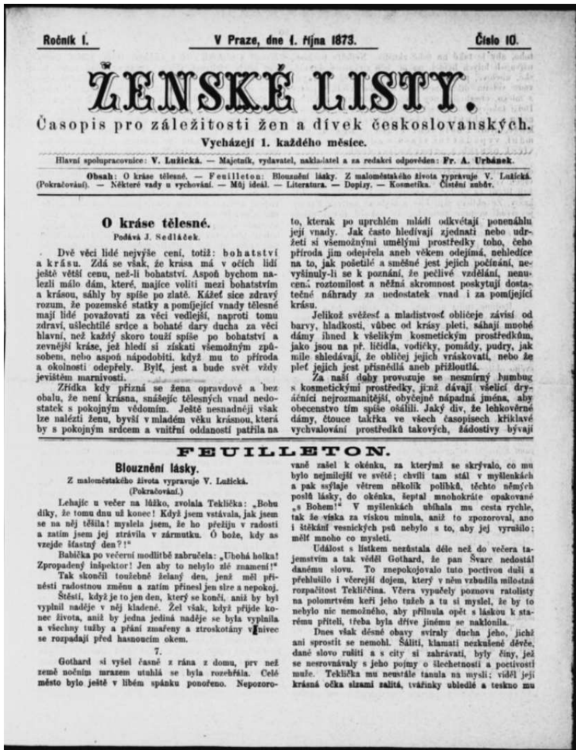
Obrázek 1: Úvodní strana Ženských listů