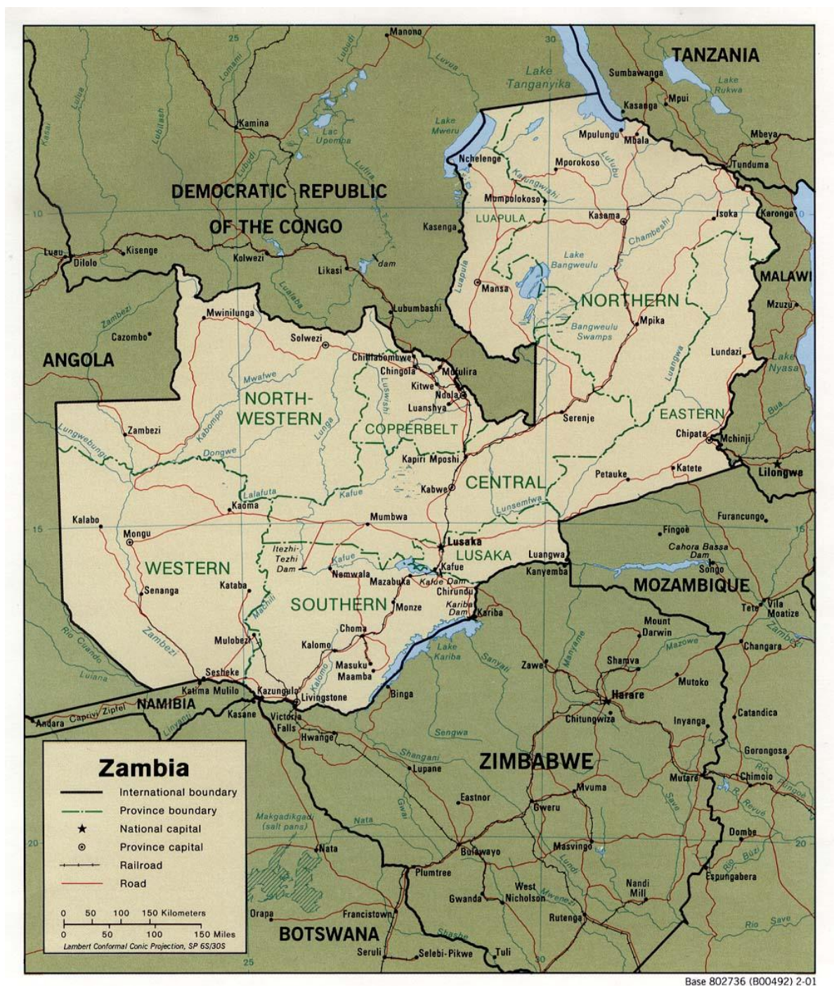
Mapa č. 3. Geografická mapa dnešního Zimbabwe, Zambie a Malawi.