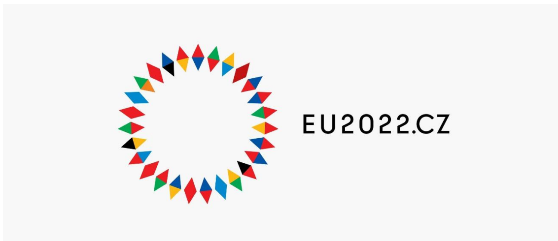
Obrázek 1: Logo českého předsednictví v Radě EU

Česká republika si pro své předsednické období zvolila logo 27 střelek ve tvaru větrné růžice. Počet reprezentuje shodný počet členských států EU a každý prvek obsahuje dvě barvy, které vycházejí z barev státní vlajky jednotlivých členů. Jelikož je vlajka České republiky jedinou obsahující klín, jedná se o unikátnost, kterou se ČR snažila podtrhnout. Základem loga se stal trojúhelník, který odkazuje na klín české vlajky. Homogenní symbol se zároveň snaží odrážet motto EU „Jednotná v rozmanitosti“ (EU2022 2022d). Logo je založeno na jednoduchosti a čitelnosti, ale přesto skrývá hlubší význam, než je na první pohled patrné. Kruh symbolizuje soudržnost a jednotlivé trojúhelníky ostrážitost. Střelky kompasu představují to, že ČR bude tím státem, který bude během šesti měsíců určovat směr EU. Jediné, co by mohlo být případně vytknuto je font písma, který působí moc ostře. Celkově logo vypadá barevně a pozitivně.