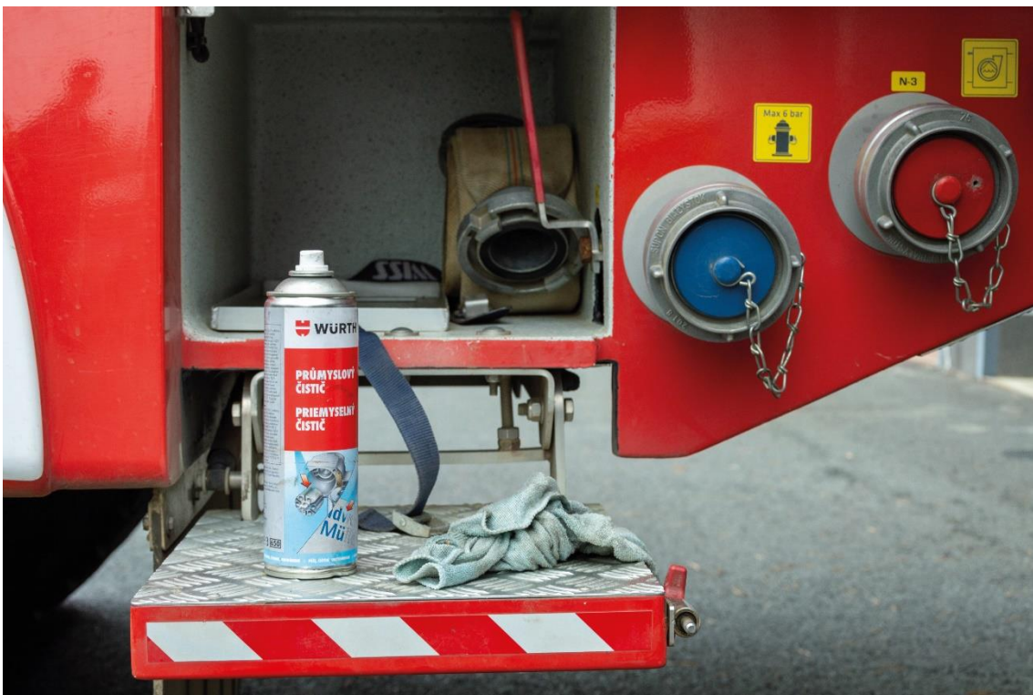
příloha 2 nepoužitá fotografie