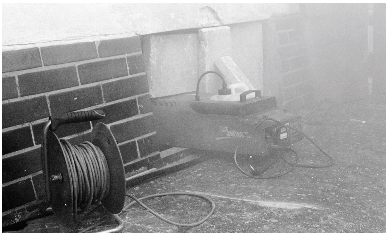
příloha 10 nepoužitá analogová fotografie, vlastní