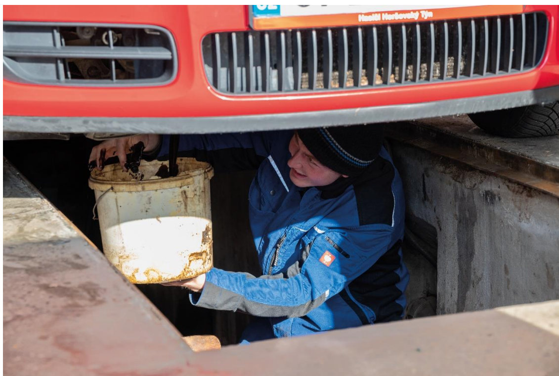
příloha 3 nepoužitá fotografie