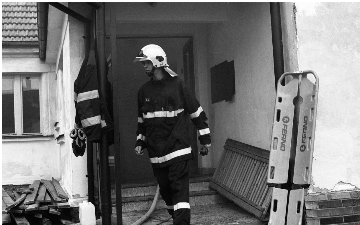
příloha 9 nepoužitá analogová fotografie, vlastní