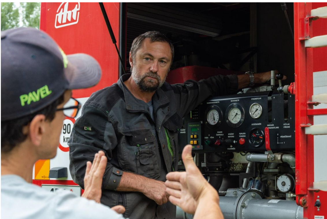
příloha 6 nepoužitá fotografie, vlastní