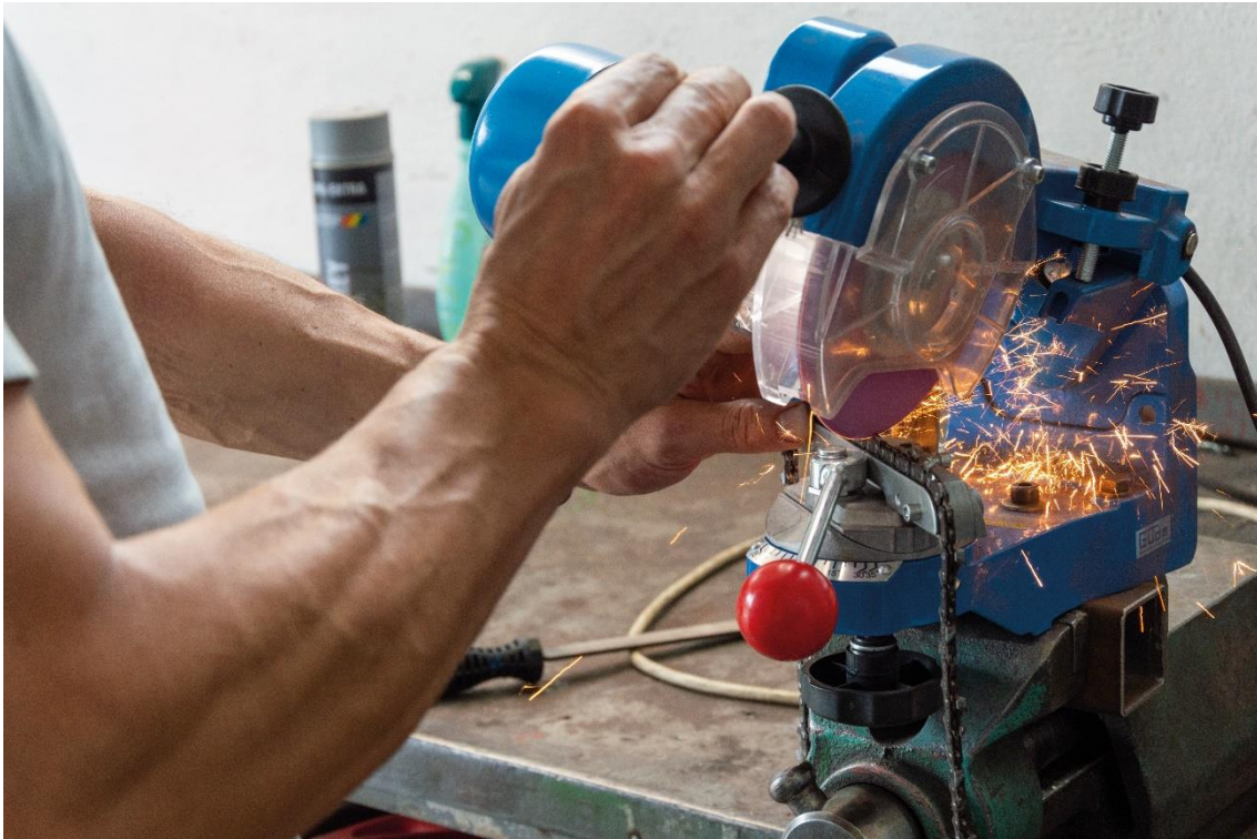
příloha 1 nepoužitá fotografie, vlastní