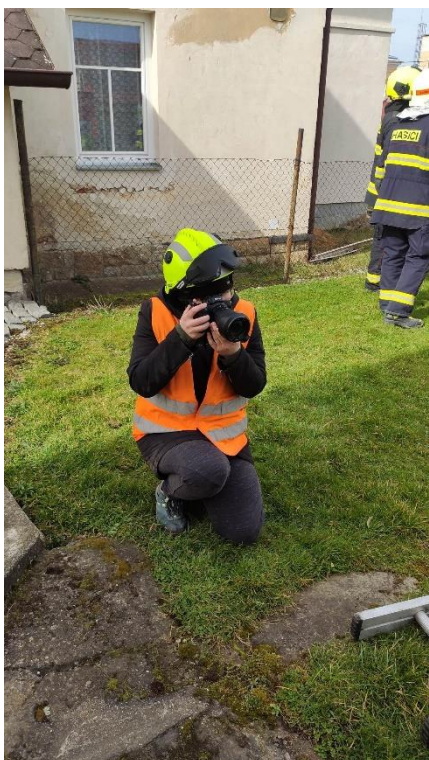
příloha 7 snímek ze cvičení s dýchací technikou