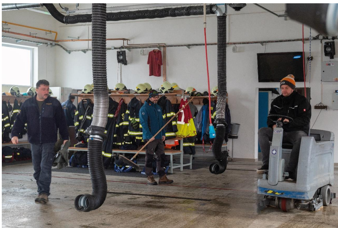
příloha 4 nepoužitá fotografie