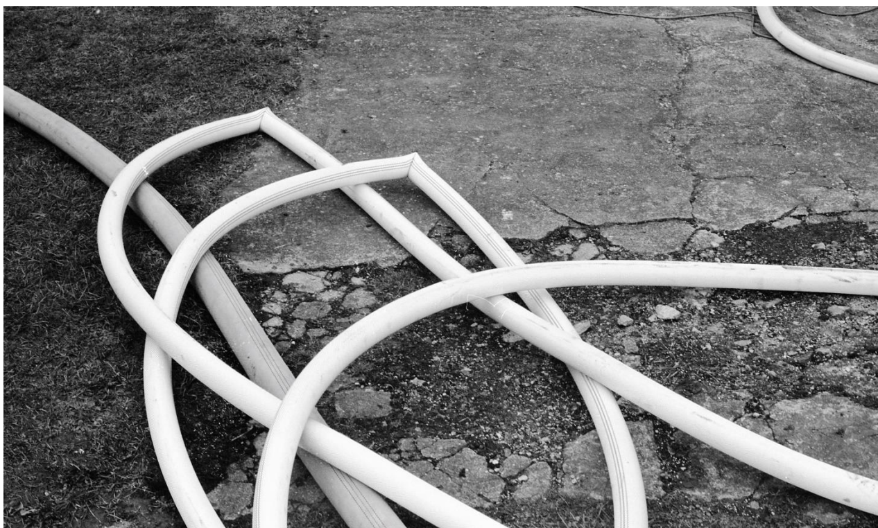
příloha 12 nepoužitá analogová fotografie