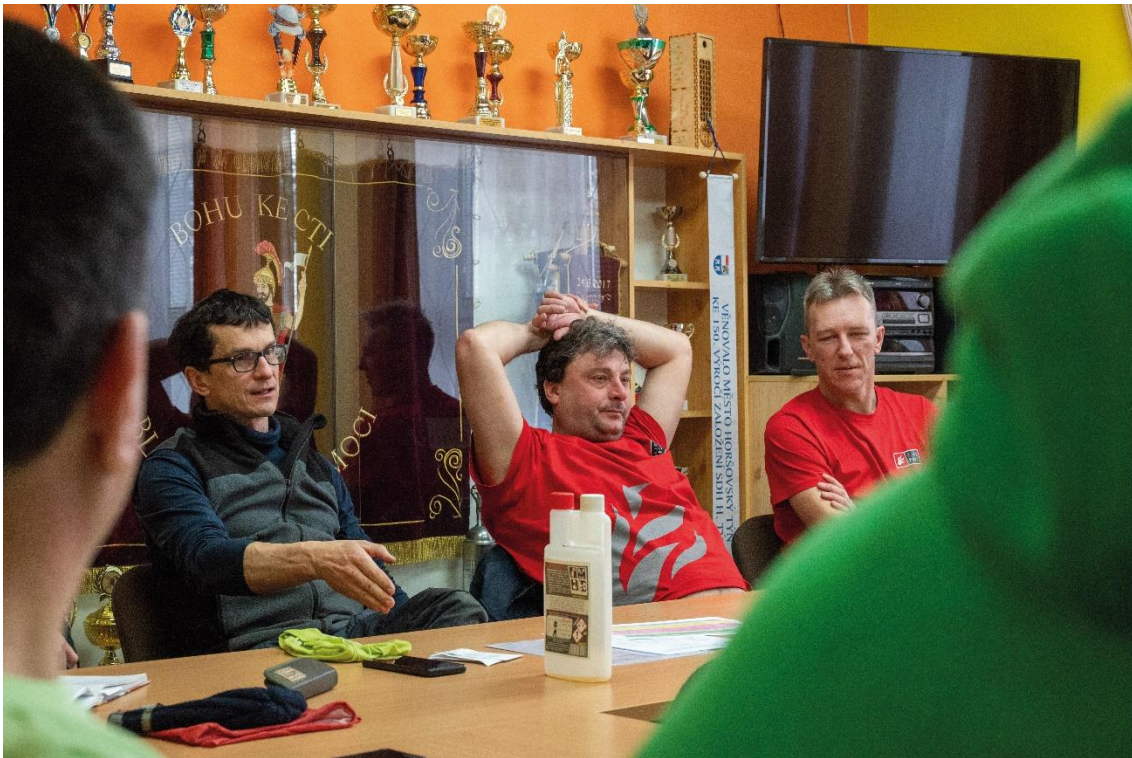
příloha 5 nepoužitá fotografie, vlastní