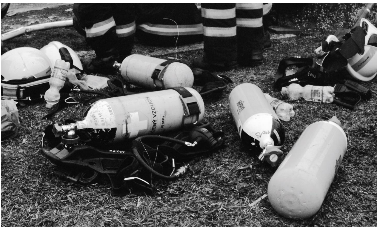
příloha 8 nepoužitá analogová fotografie, vlastní