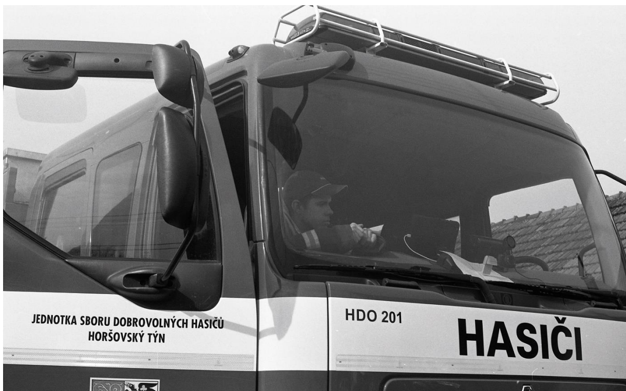
příloha 11 nepoužitá analogová fotografie