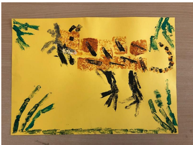
Příloha č. 3 – Fotografie z hodiny výtvarné výchovy na téma: Můj nejlepší přítel