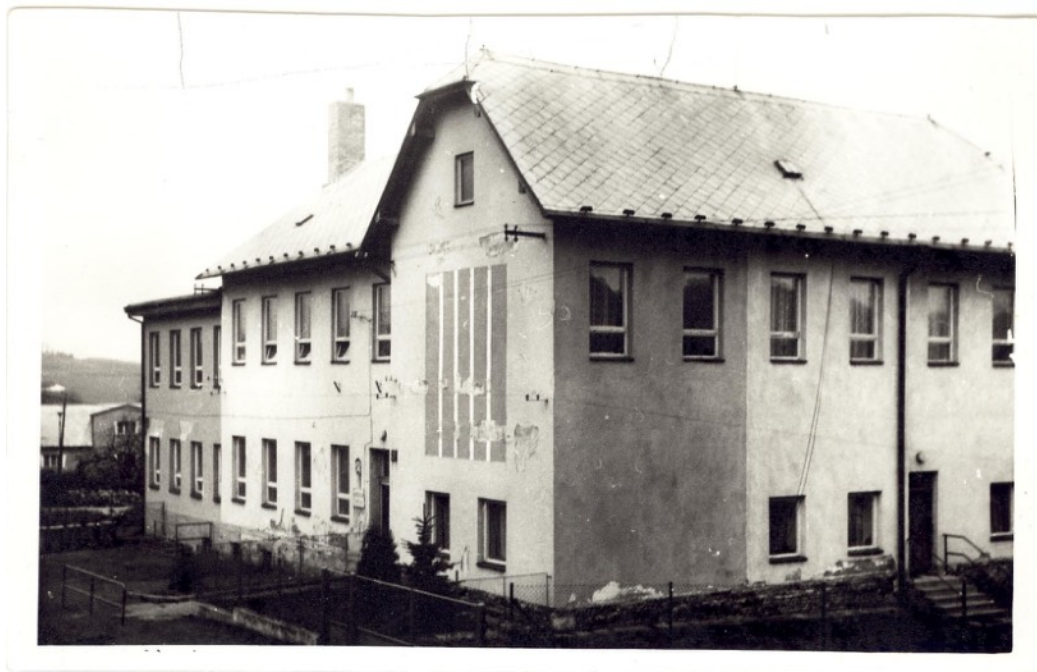
Obrázek č.9: Základní škola Prapoříště nyní 61