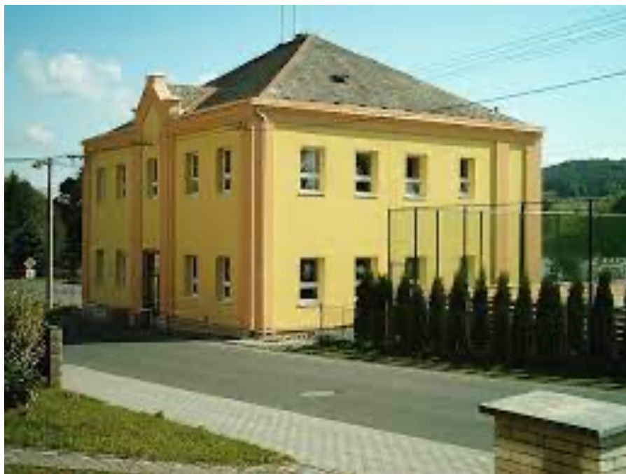
Obrázek č.10: Základní škola Všeruby 62