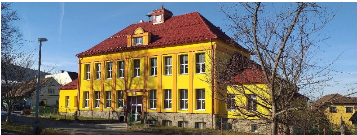
Obrázek č.3: Základní škola Meclov 55