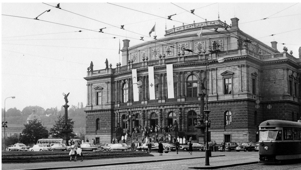
Rudolfinum - místo slavnostního zahájení pražského zasedání Mezinárodního Červeného kříže [JPG].

V rámci Mezinárodního Červeného kříže můžeme zmínit Mezinárodní konferenci Červeného kříže, která se konala v roce 1963 a zasedání Rady guvernérů Ligy společností Červeného kříže a Rady delegátů Červeného kříže, které se konalo v roce 1961, přičemž jako místo konání byla vybrána Praha, a to konkrétně pražský hotel International. Slavnostní zahájení zasedání se pak konalo v Rudolfinu (viz. výše). Na obou těchto zasedáních byla přijata významná rozhodnutí. Ze zasedání Ligy společností ČK můžeme jmenovat přijetí jednoho z hesel Mezinárodního ČK na návrh ČSČK - Humanitou k míru ( Per Humanitatem ad Pacem ). Jednalo se o druhé heslo, které se přidalo k heslu: Milosrdenství mezi zbraněmi ( Inter Arma Caritas ). Zasedání Rady delegátů ČK se zabývalo základními principy, zásadami činností a organizací složek Mezinárodního ČK. Namísto 25 principů bylo ustanoveno pouze sedm tak, jak jsou využívány i dnes – humanita, nestrannost, neutralita, nezávislost, dobrovolnost, jednota, univerzalita. 246