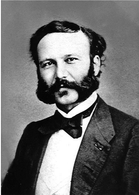
Henry Dunant [JPG]. In: Wikipedie [online]. 24. 11. 2022. [cit. 09. 03. 2023]. Dostupné z: https://cs.wikipedia.org/wiki/Henri_Dunant .