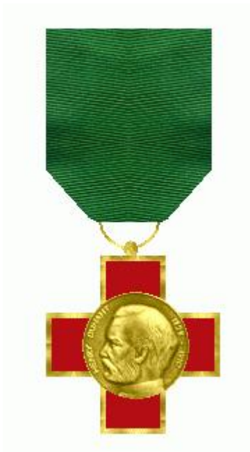
Medaile Henriho Dunanta [GIF]. In: IDENTIFYMEDALS.COM [online]. [cit. 09. 03. 2023]. Dostupné z: https://www.identifymedals.com/database/medals-by-period/post-ww2-medals/the-henry-dunant-medal/ .