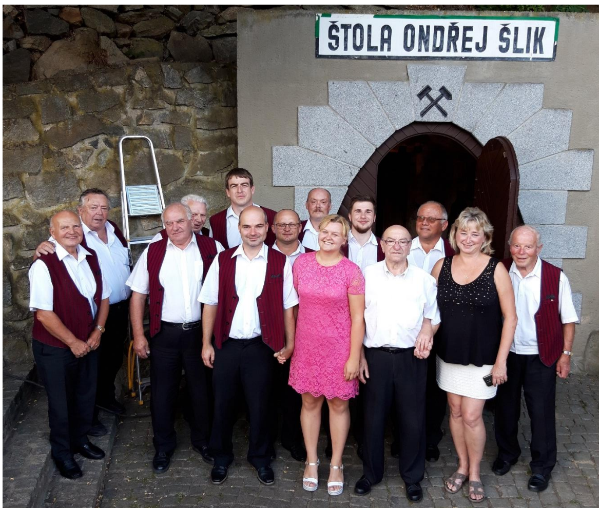
Obrázek 8: Dechová kapela Nýřaňanka, Planá 2018

Dechová kapela Nýřaňanka je každoročně zvána do Plané na Hornické slavnosti. Zde vždy hraje od dvou hodin odpoledne do osmi hodin do večera. Na tuto událost se sjíždějí horníci z různých měst, a to dokonce i ze zahraničí. Pro kapelu je velikou ctí, že se této akci může pravidelně účastnit a zůstává tak věrná i své historické tradici.