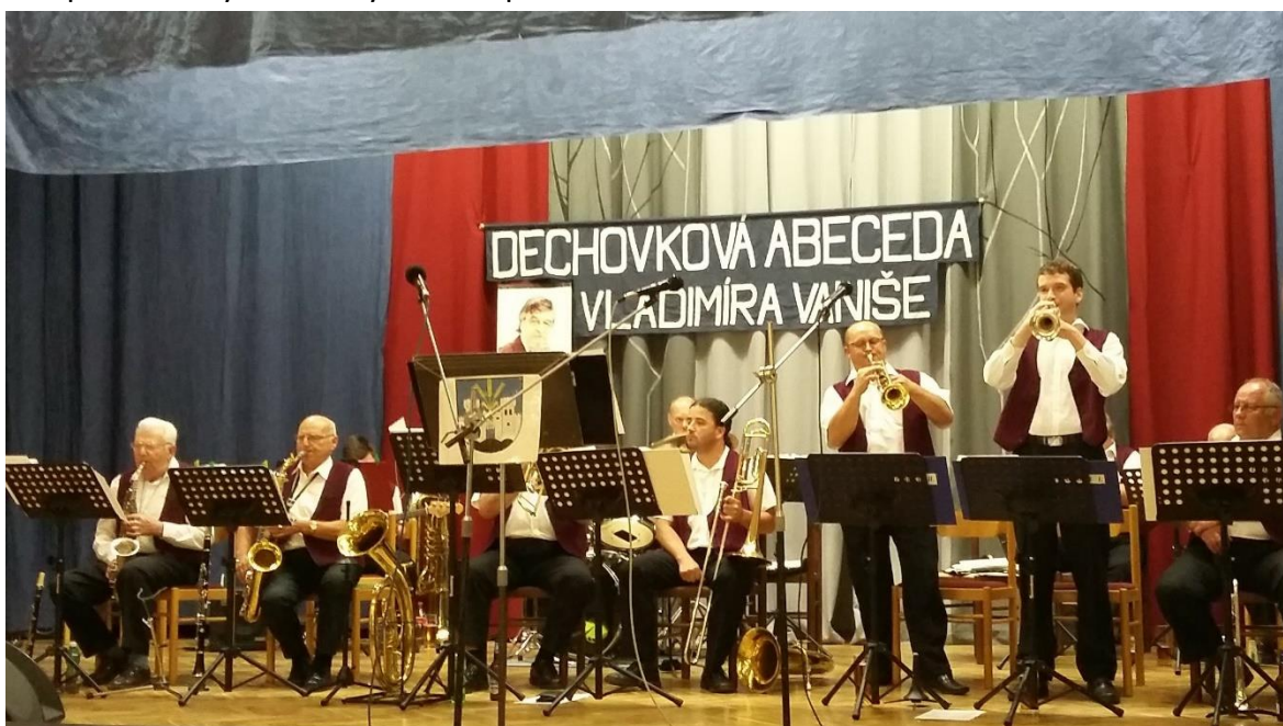
Obrázek 9: Dechová kapela Nýřaňanka, Kulturní dům Nýřany

Návštěvníci Dechovkových abeced byli rádi, že každá z pořádaných akcí se lišila nejen svým programem, každý měsíc však mohli slyšet i jiné dechové kapely. Navíc výše vstupného na tyto akce byla velice příznivá.