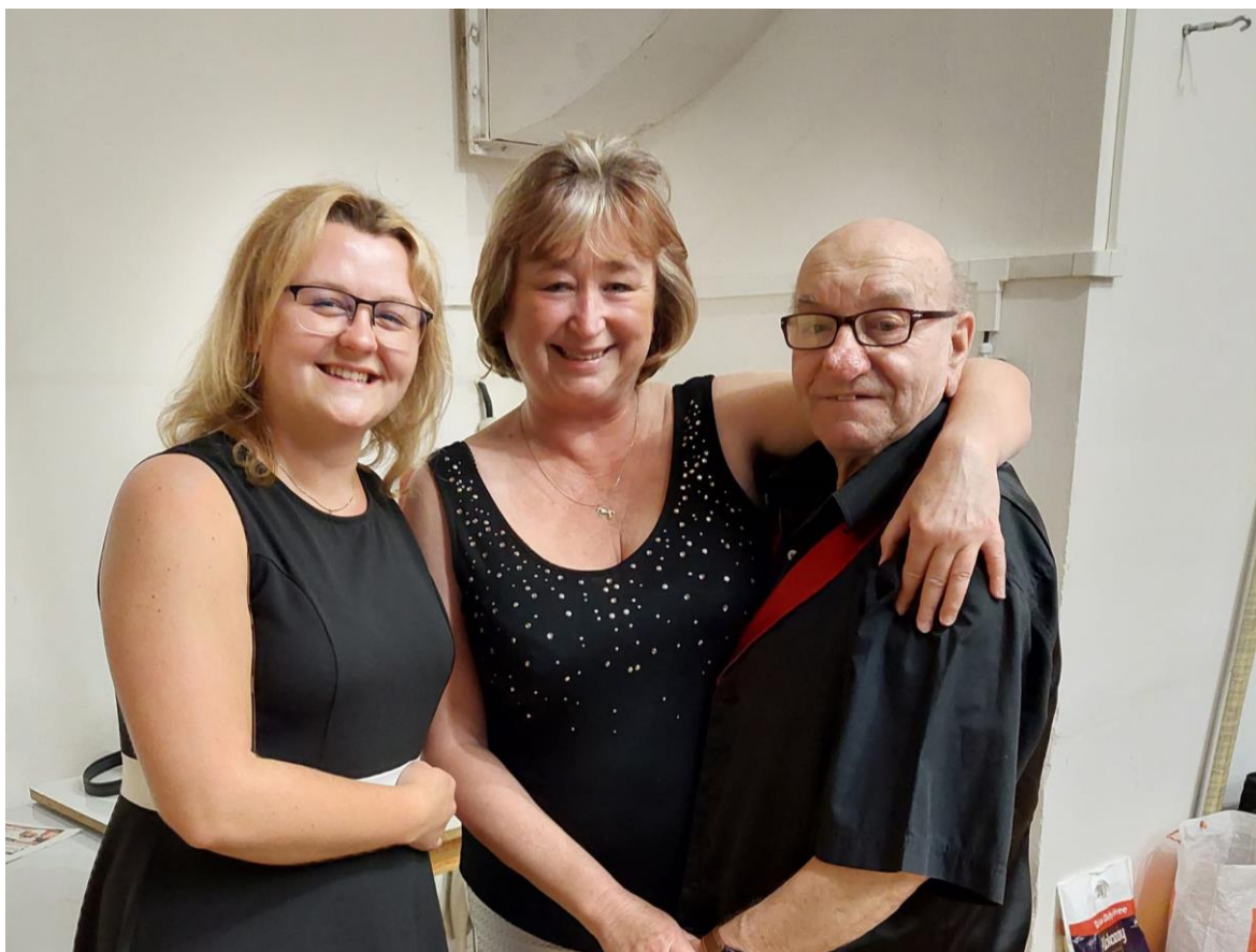
Obrázek 6: Zpěváci Dechové kapely Nýřaňanka