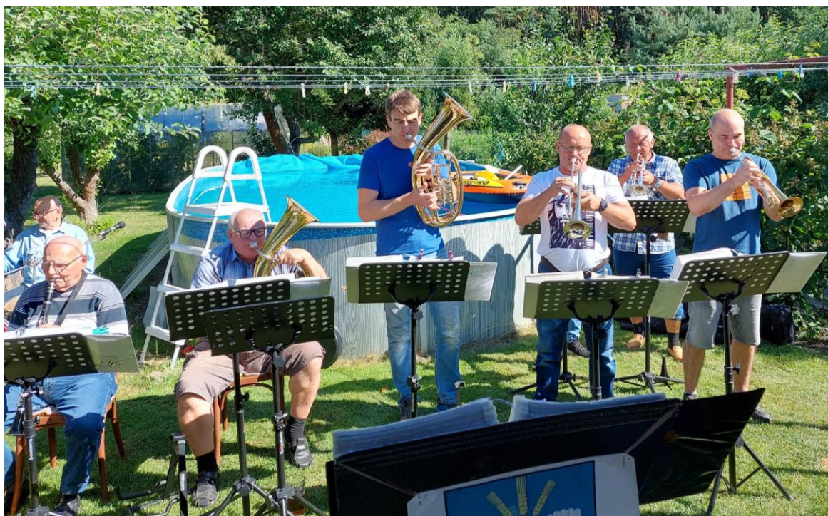
Obrázek 10: Dechová kapela Nýřaňanka, Akce zahrada

Kolem čtvrté hodiny odpoledne, poté co se sejdou všichni muzikanti, se mezi altánem a bazénem postaví notové stojánky a muzikanti začnou hrát. Po celou dobu hraní vždy jeden ze zúčastněných obstarává udírnu, ve které se připravují klobásy nebo nějaké uzené maso, které pak všichni společně kolem šesté hodiny povečeří.