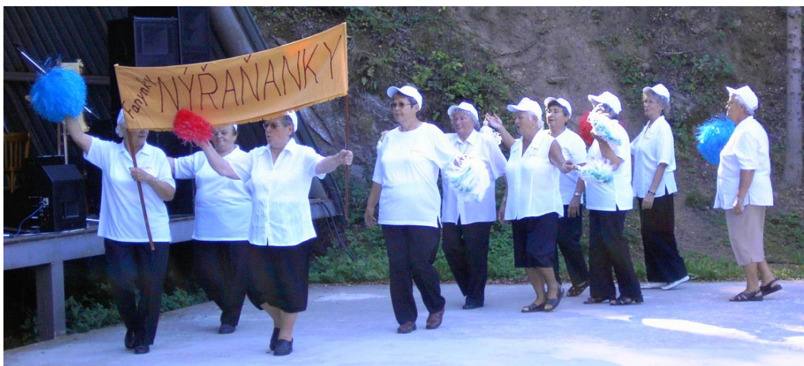
Obrázek 4: Fanyňky Dechové kapely Nýřaňanka