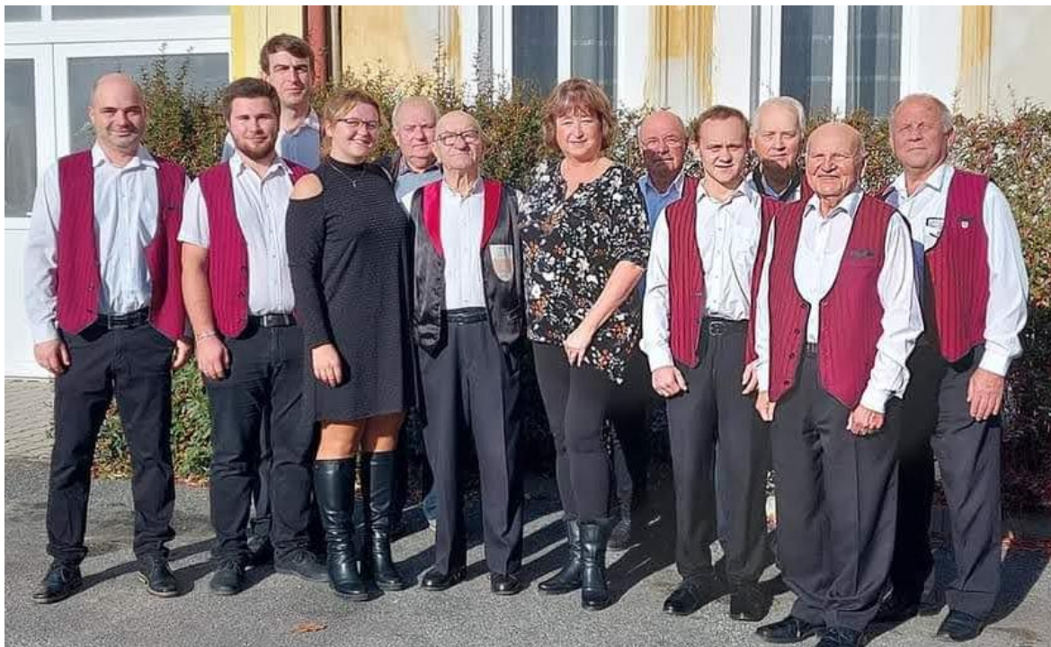
Obrázek 1: Dechová kapela Nýřaňanka, 2022