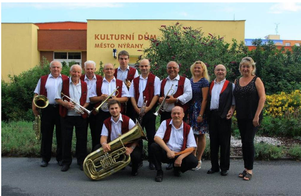
Obrázek 5: Dechová kapela Nýřaňanka, 2018

Dechová kapela Nýřaňanka již v dnešní době není tradiční klasickou dechovou kapelou, neboť má velmi bohatý repertoár, a to včetně několika „modernějších“ skladeb. Do svého repertoáru postupně zařazovala skladby ze 60., 70. a 80. let, čímž si získala nové příznivce, a je tak žádána i u mladší generace. Na akce, kde kapela Nýřaňanka hraje, se tak sjíždí podívat nejen senioři, kteří mají rádi klasickou dechovou hudbu, ale i skupiny diváků o generaci mladší.