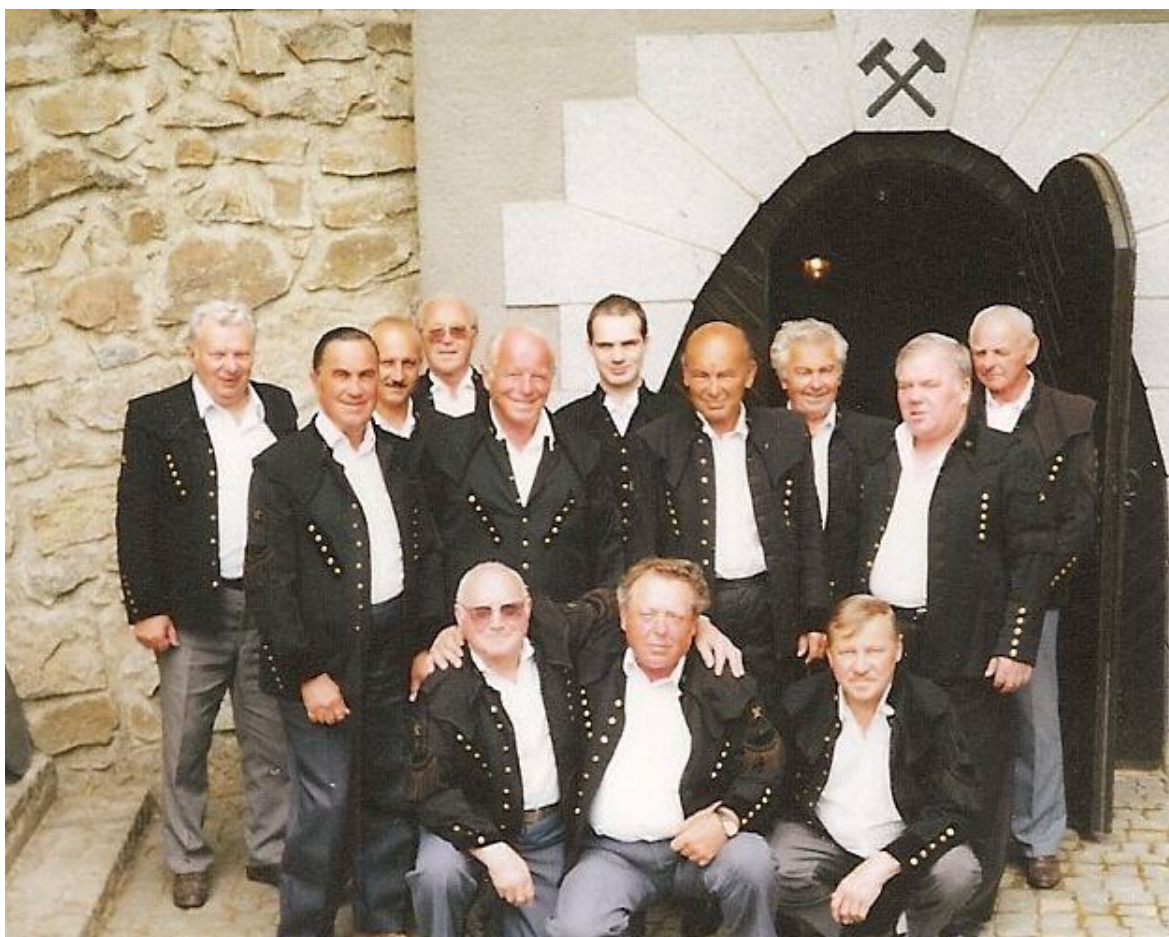
Obrázek 7: Hornické stejnokroje Dechové kapely Nýřaňanka

V současné době muzikanti z Dechové kapely Nýřaňanka oblékají kytle pouze při příležitosti Hornických slavností v Plané u Mariánských Lázní, neboť se další z hornických a havířských tradic, kde by kapela mohla hrát oděna v hornických uniformách, již nekonají.