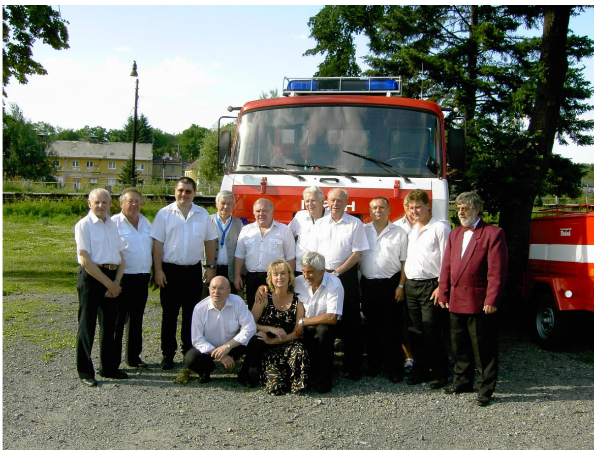
Obrázek 2: Dechová kapela Nýřaňanka, 2006