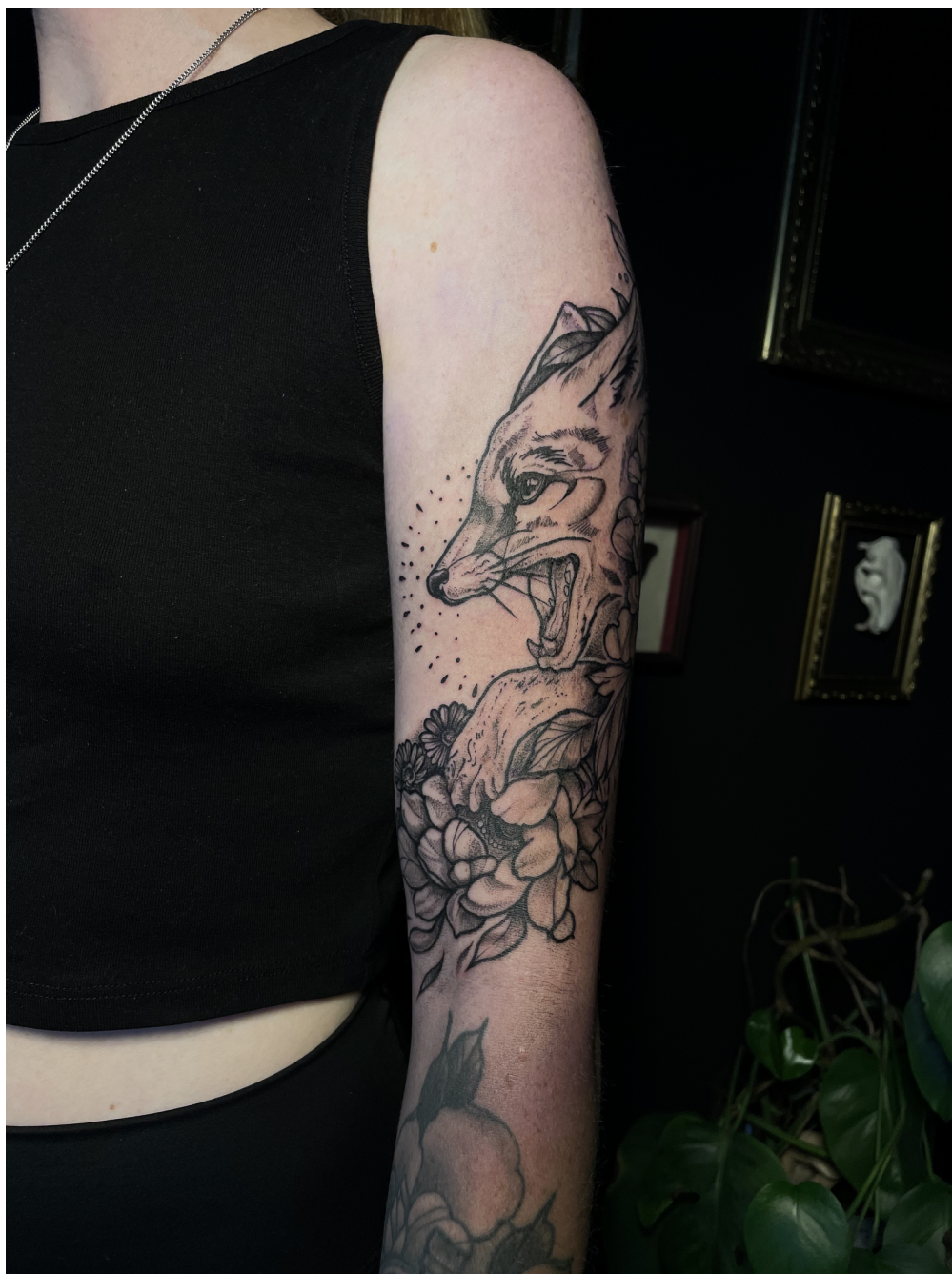
příloha č.1 Liška pod kůží