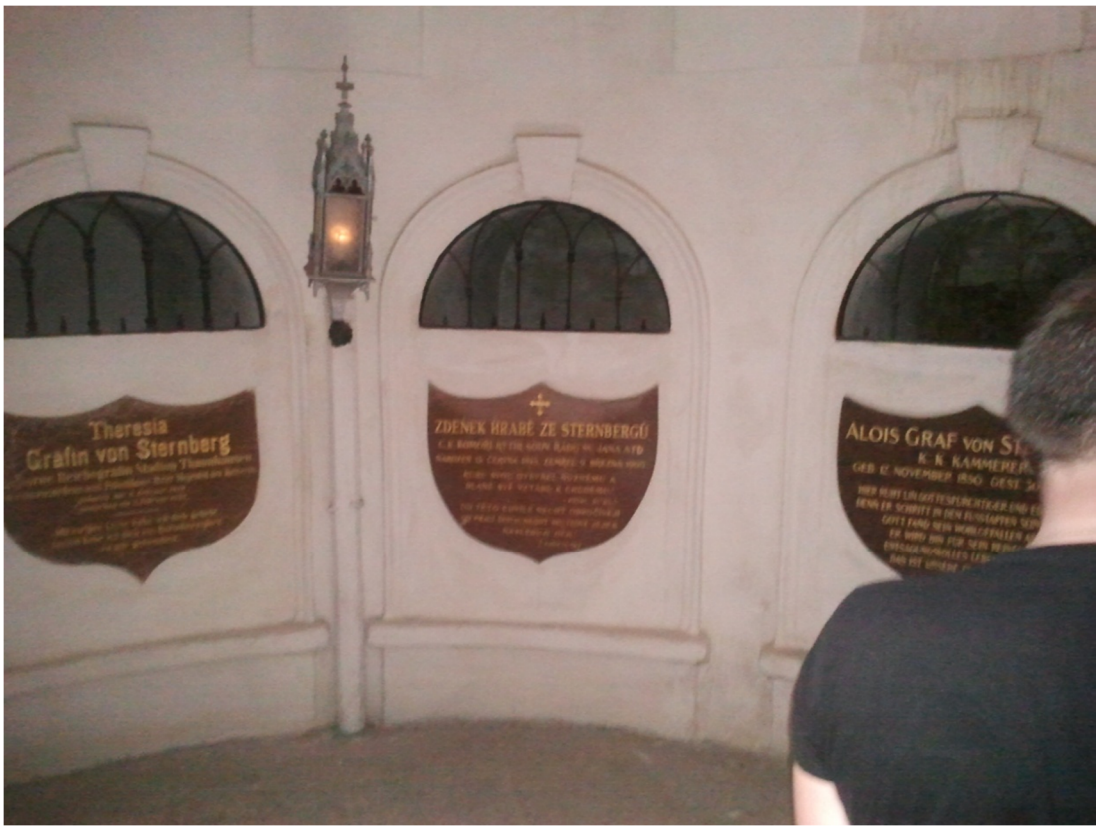
Příloha č. 17 – Fotografie interiéru šternberské hrobky (2011)