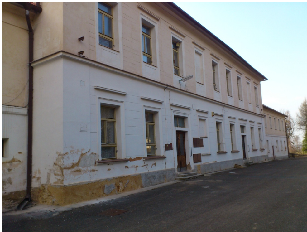
Příloha č. 8 – Fotografie zámku, zadní strana (2012)