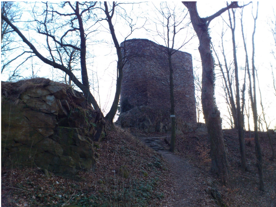
Příloha č. 11 – Fotografie hradu (2012)