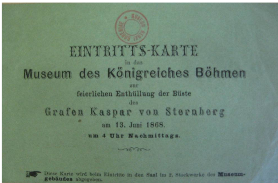
Příloha č. 3 – Vstupní lístek do musea Království českého k odhalení busty Kašpara hraběte Šternberka dne 13.6.1868