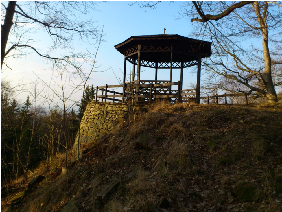
Příloha č. 15 – Fotografie vyhlídkového altánu u Hradiště (2012)