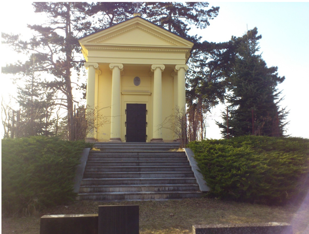
Příloha č. 16 – Fotografie Šternberské hrobky ve Stupně (2012)