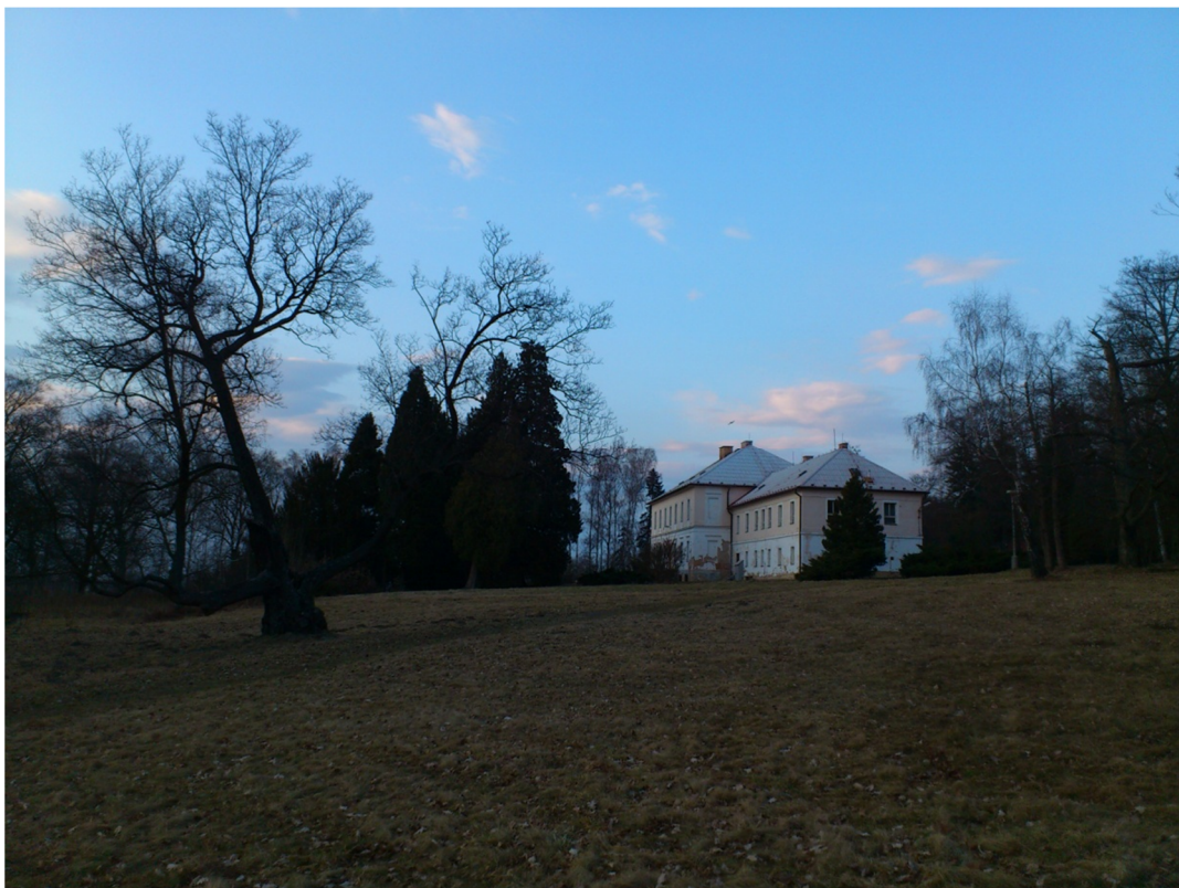
Příloha č. 6 – Fotografie zámku (2012)