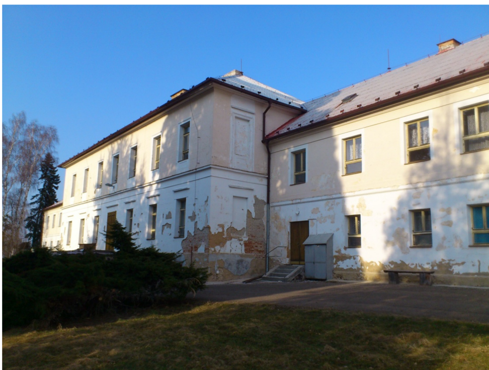
Příloha č. 7 – Fotografie zámku, přední strana (2012)