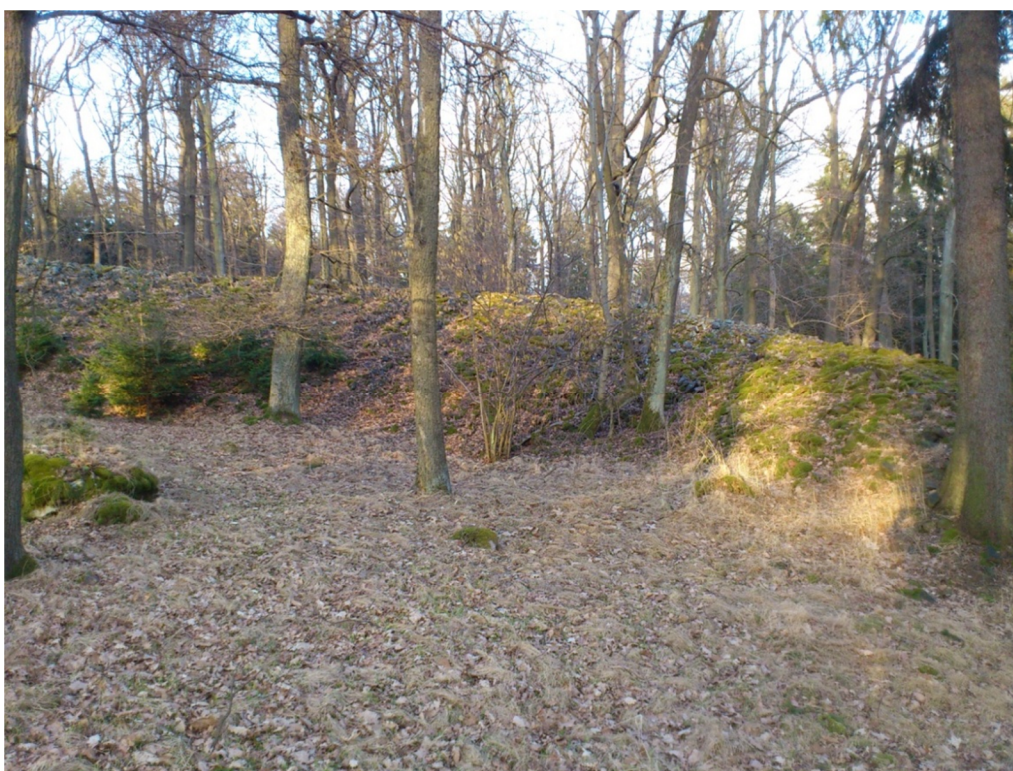
Příloha č. 14 – Fotografie hradištních valů (2012)