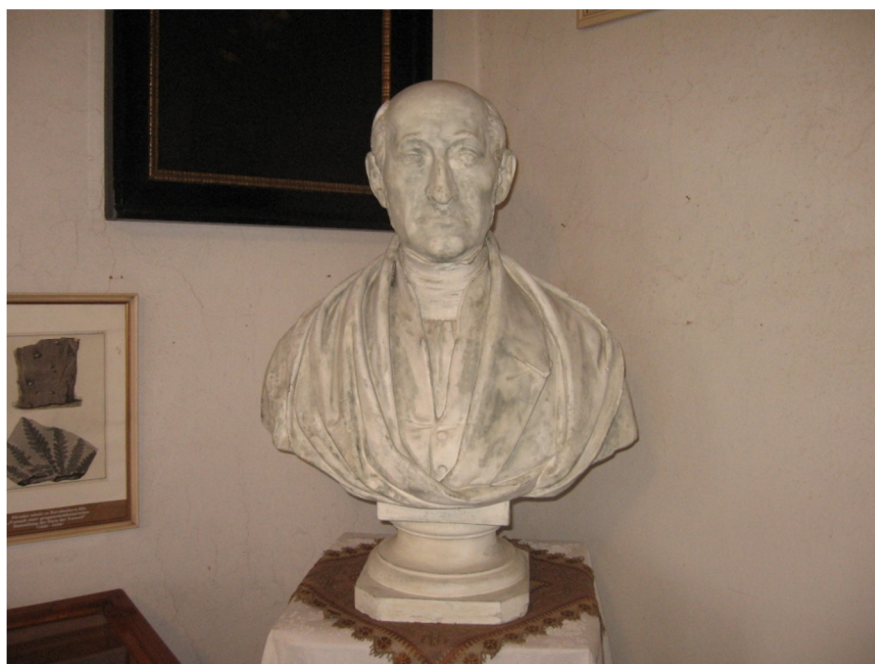
Příloha č. 2 – Kopie busty Kašpara Marii Šternberka uložená v muzeu v Radnicích