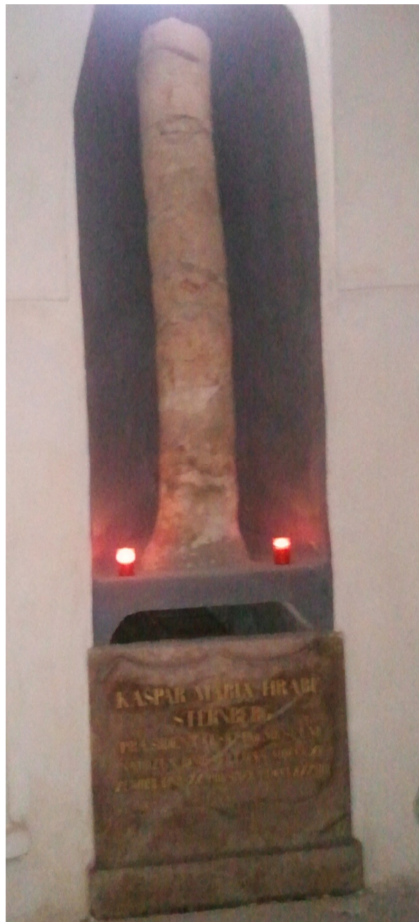
Příloha č. 18 – Fotografie hrobu Kašpara Marii Šternberka (2011)