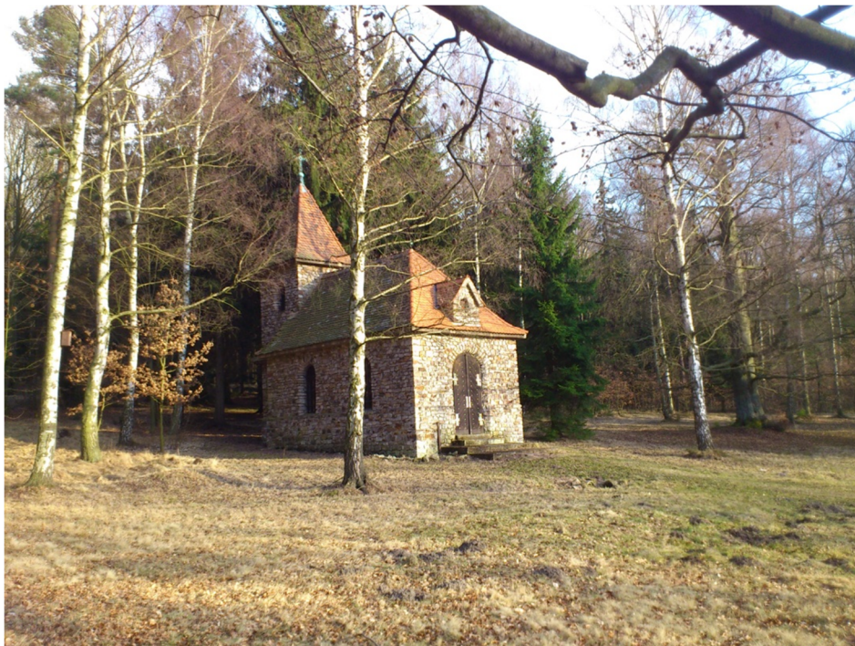
Příloha č. 10 – Fotografie zámecké kaple (2012)