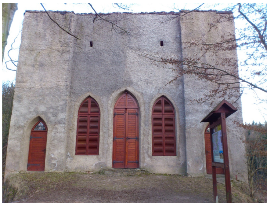
Příloha č. 12 – Fotografie hradu, přední strana (2012)