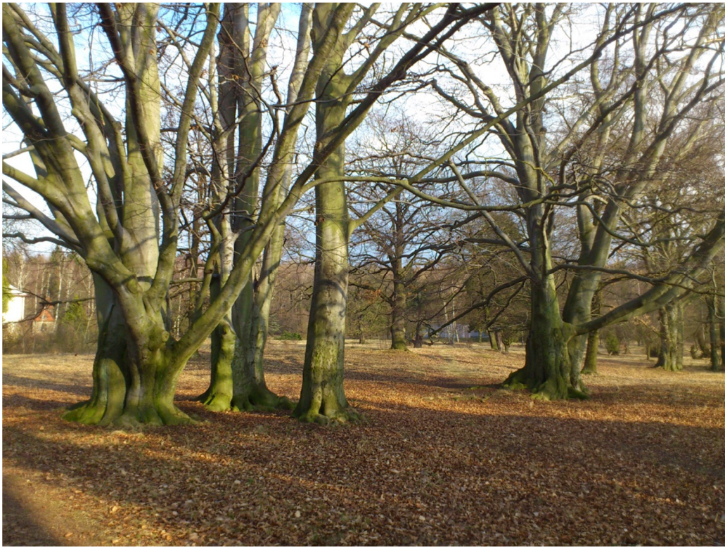
Příloha č. 9 – Fotografie zámeckého parku (2012)