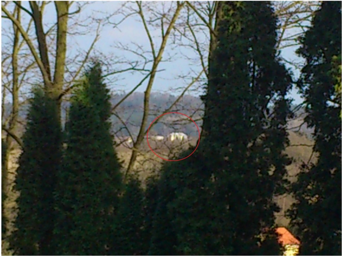
Příloha č. 19 – Pohled z hrobky na zámek (2012)