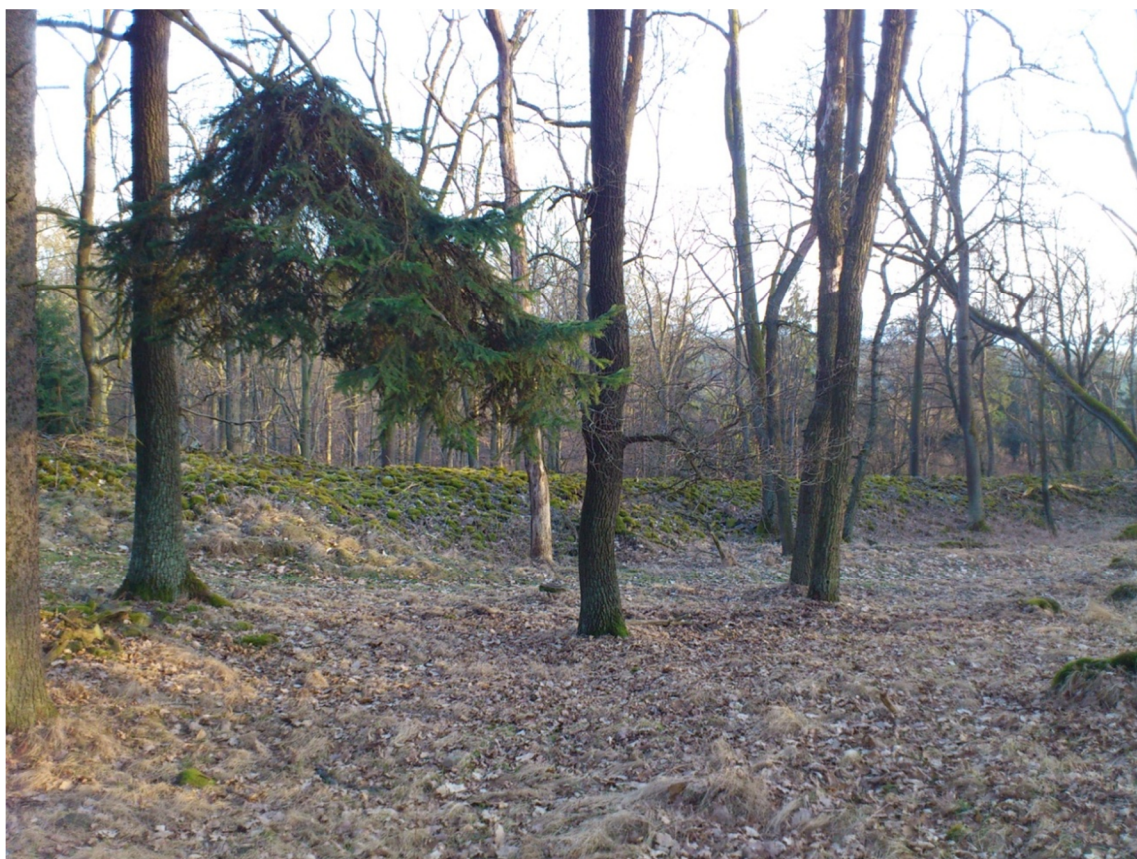
Příloha č. 13 – Fotografie Hradiště (2012)