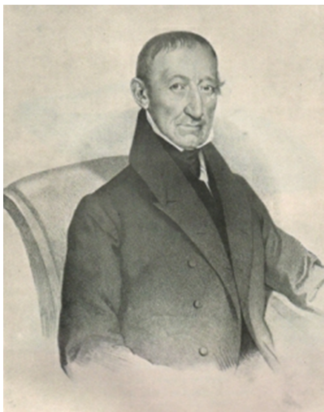
Příloha č. 1 – Kašpar Maria Šternberk