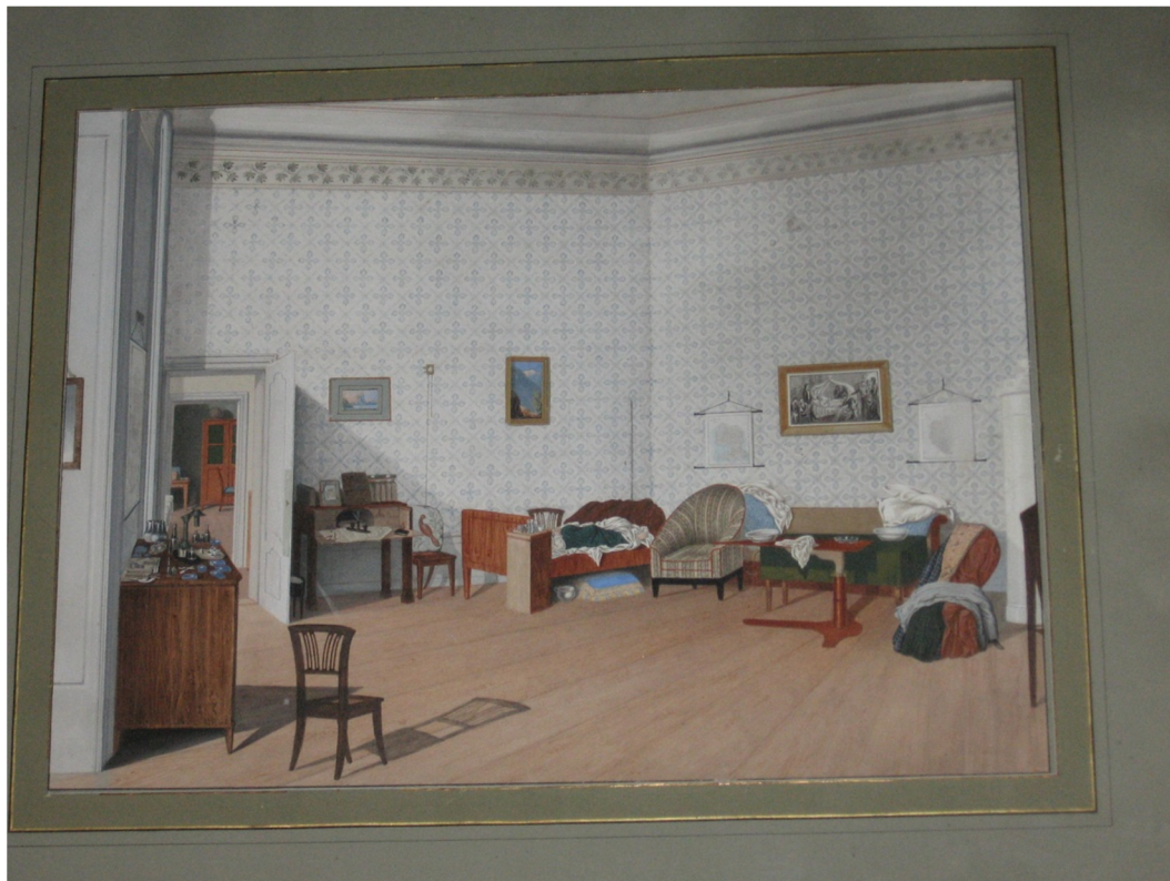
Příloha č. 5 – Úmrtní pokoj Kašpara Marii Šternberka na Březině