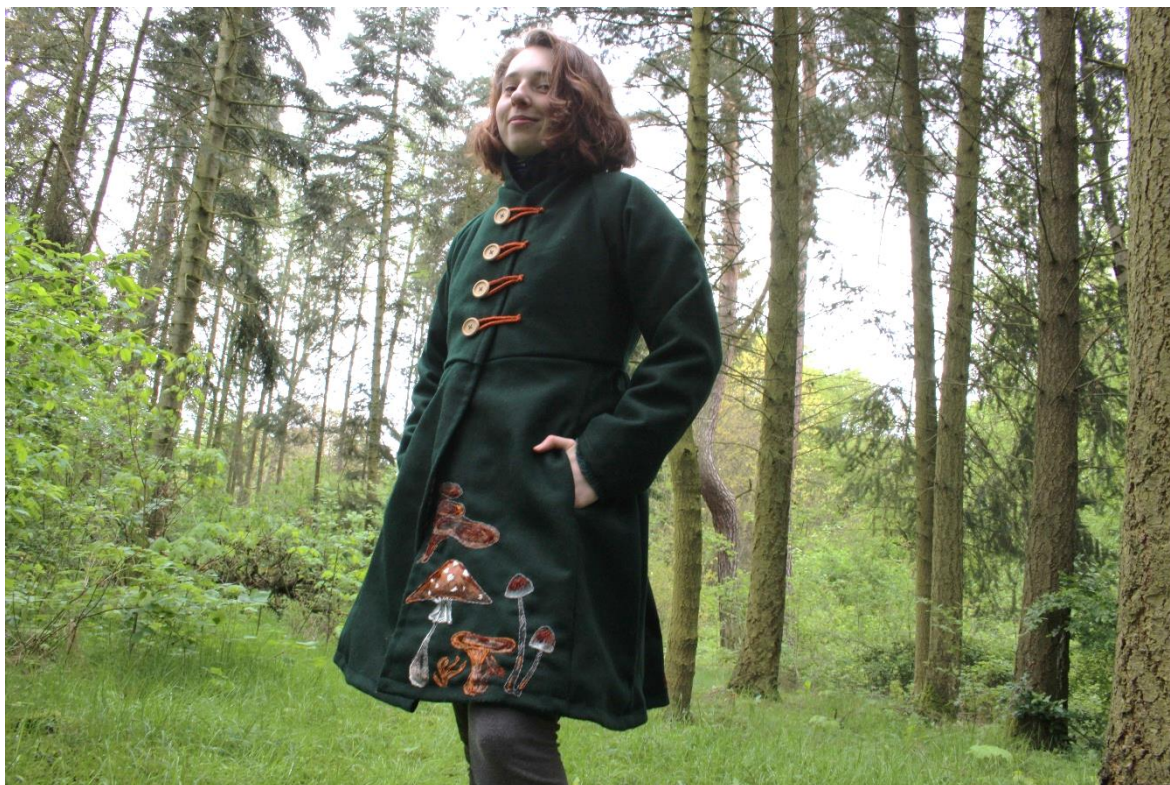
Obrázek 13 – Kabát na osobě zepředu