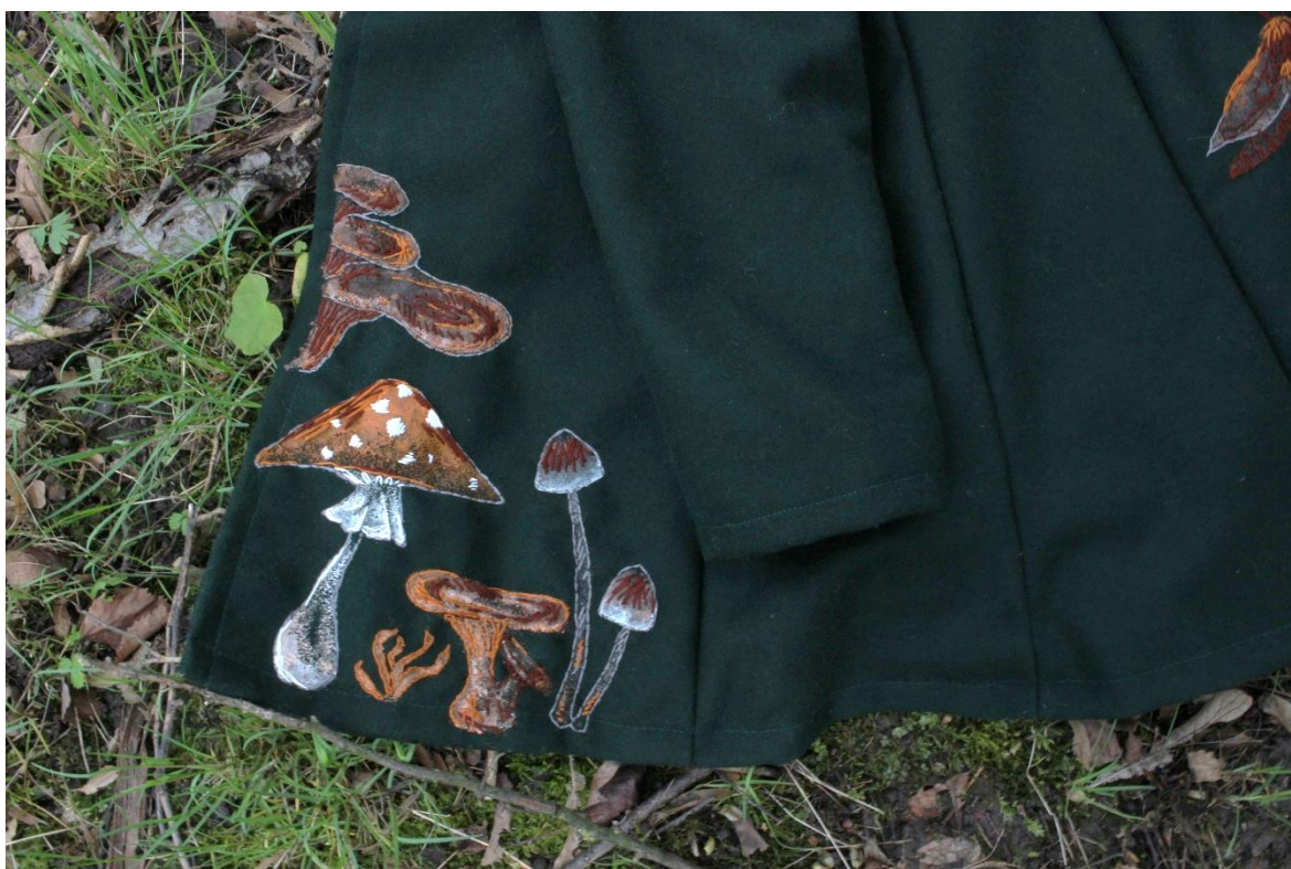
Obrázek 12 – Detail houby