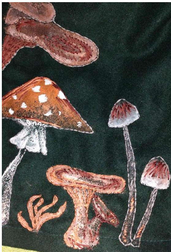
Obrázek 7 – Rozpracovaná výšivka