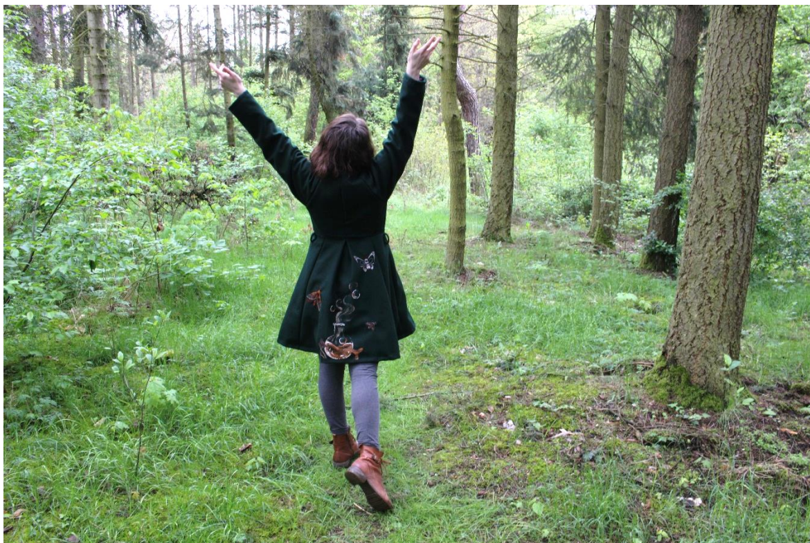
Obrázek 15 – Kabát na osobě zezadu