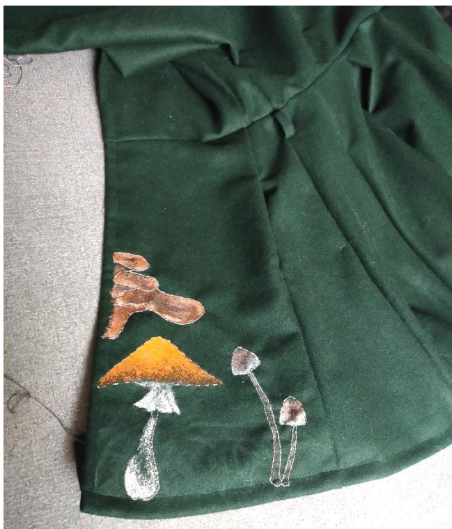
Obrázek 6 – Začátek výšivky