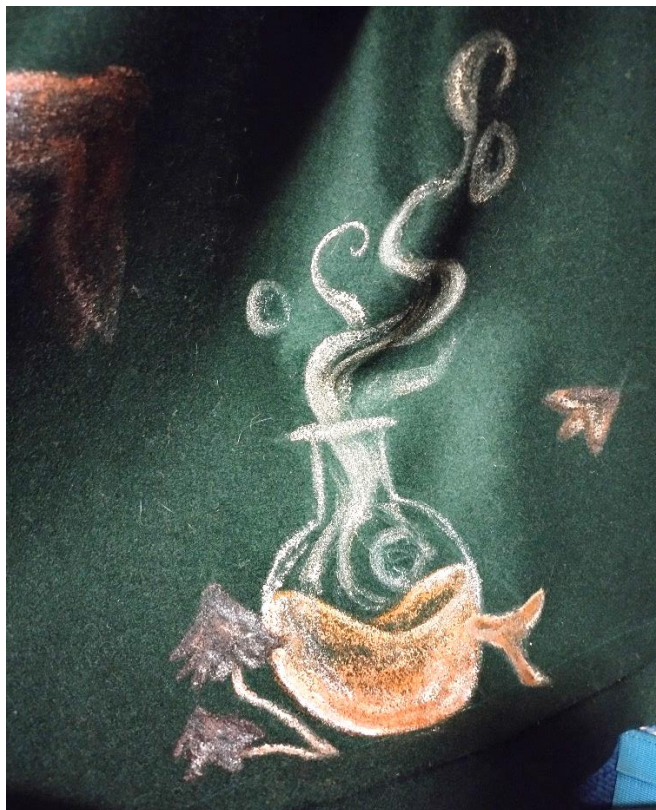
Obrázek 5 – Podmalba