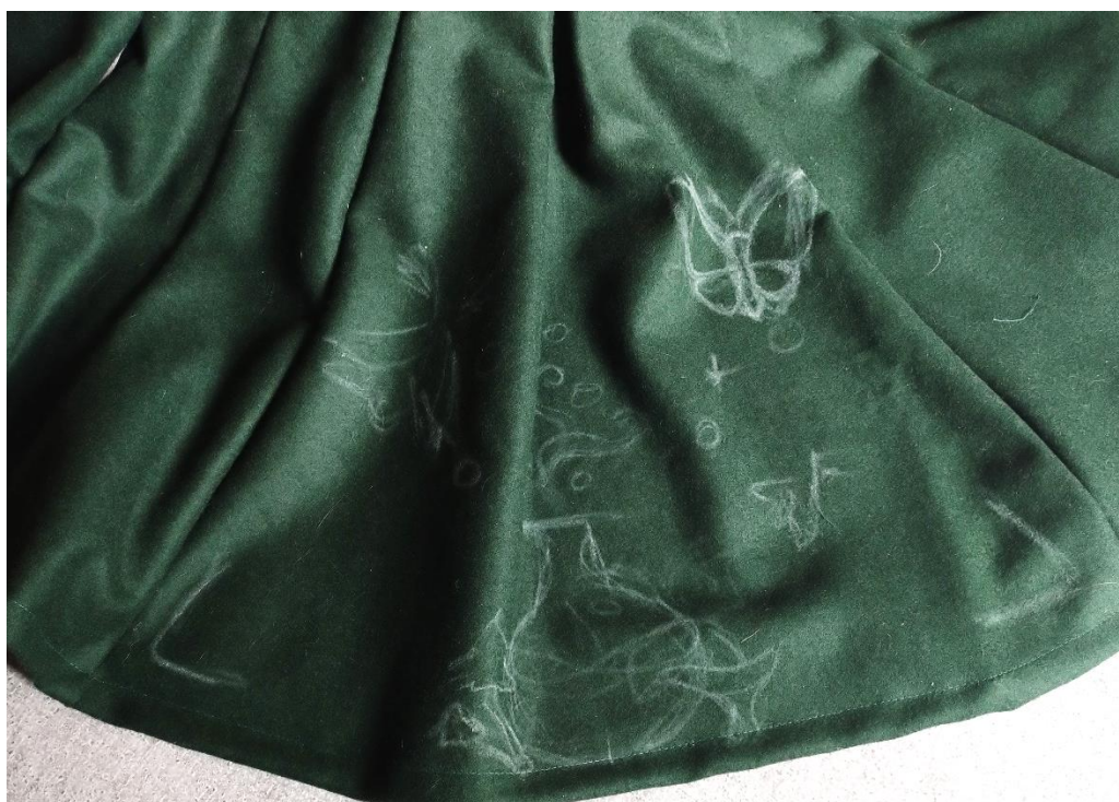
Obrázek 4 – Podkres