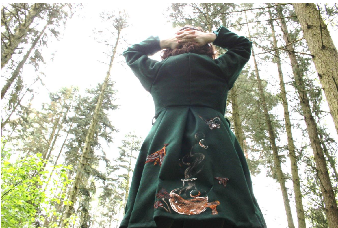
Obrázek 14 – Kabát na osobě zezadu detail