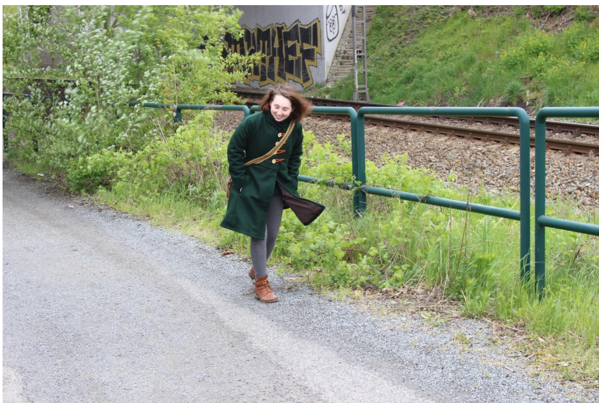
Obrázek 18 – Kabát na osobě v terénu II