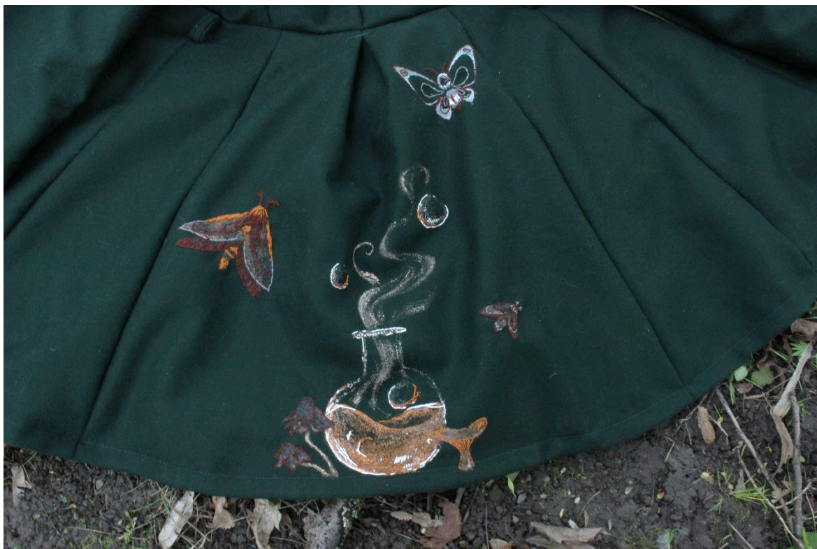
Obrázek 11 – Detail lektvar a můry