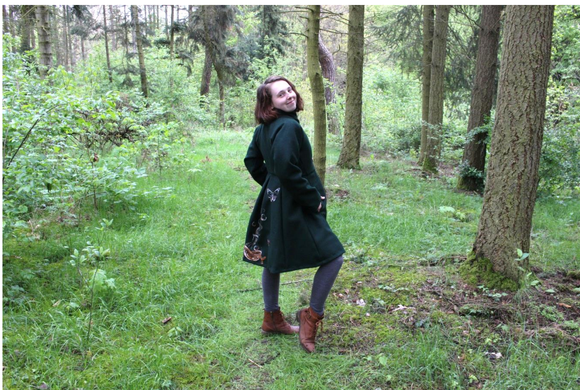
Obrázek 16 – Kabát na osobě zboku