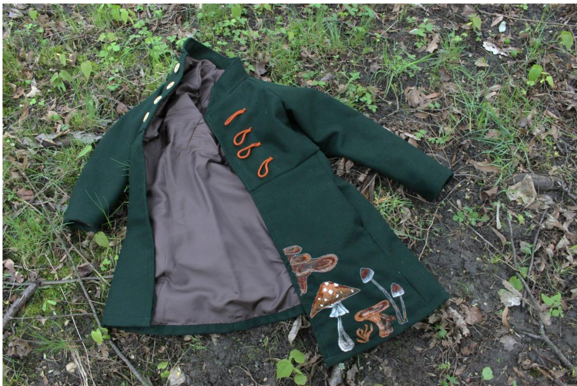
Obrázek 9 – Hotový kabát zepředu