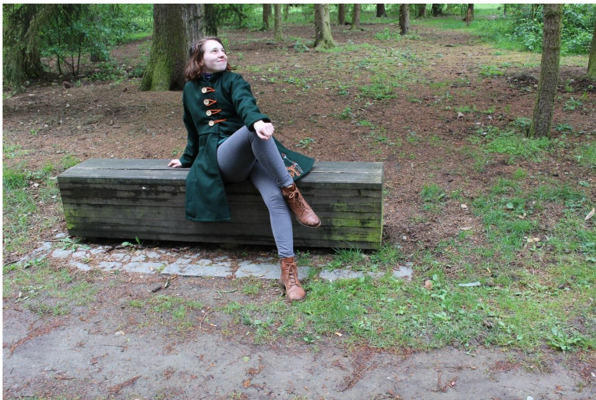
Obrázek 17 – Kabát na osobě v terénu I