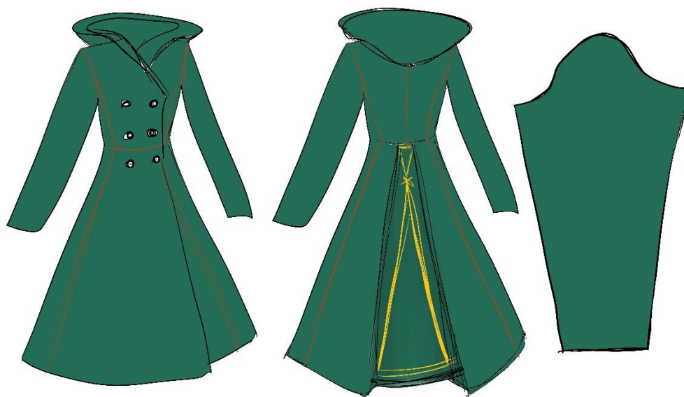
Obrázek 1 - Návrh střihu