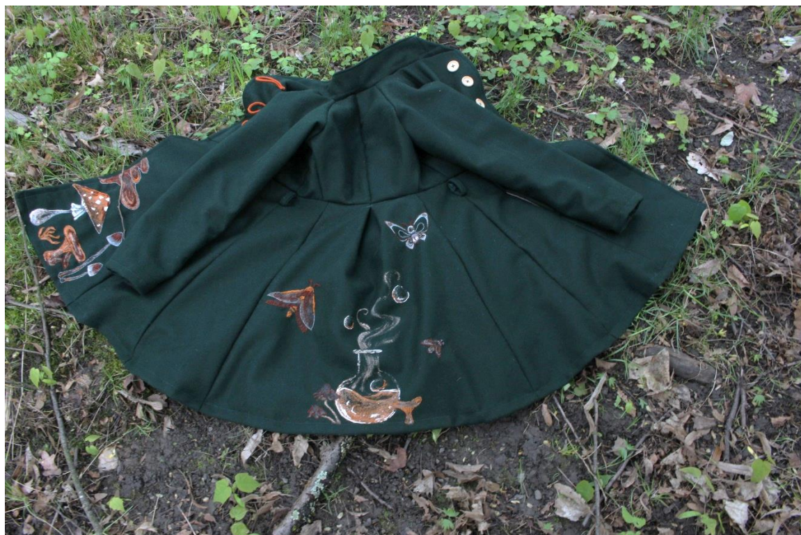
Obrázek 10 – Hotový kabát zezadu