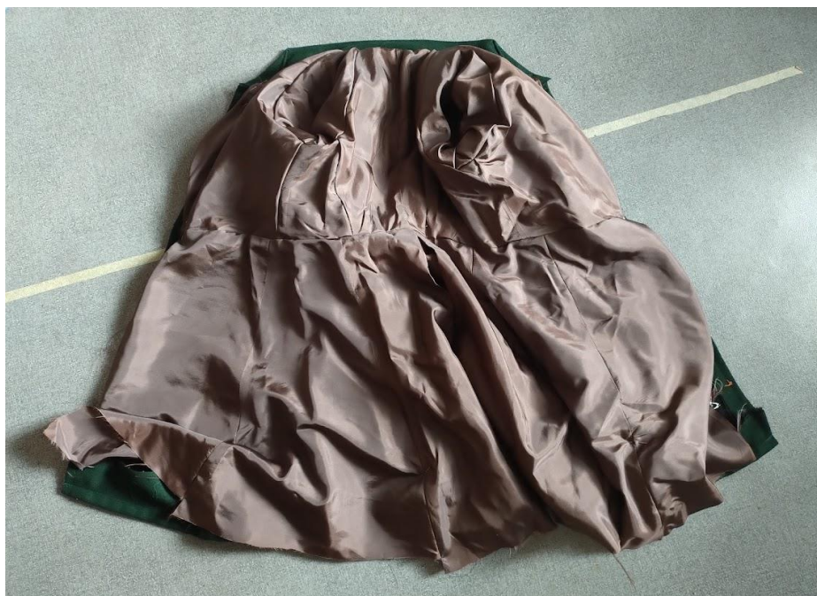
Obrázek 8 – Všívání podšívky